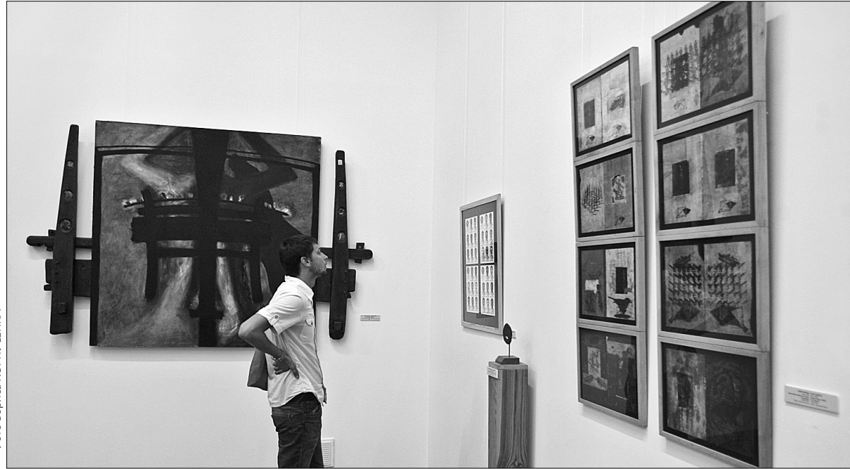
Розвиток українського мистецтва від 1960-х років до нашого часу відвідувачі можуть оцінити на власні очі

До цього мистецтво ХХ століття у Національному художньому музеї закінчувалося початком 1980-х років. Цілісну та повну картину напрямків, творчих індивідуальностей та визначних явищ мистецького життя країни покликана відтворити виставка "Переґони з часом: Мистецтво 1960-х — початку 2000-х років". Вона знайомить як із класиками нової хвилі, так і з молодими художниками, що здійснювали свої проекти в стінах музею.