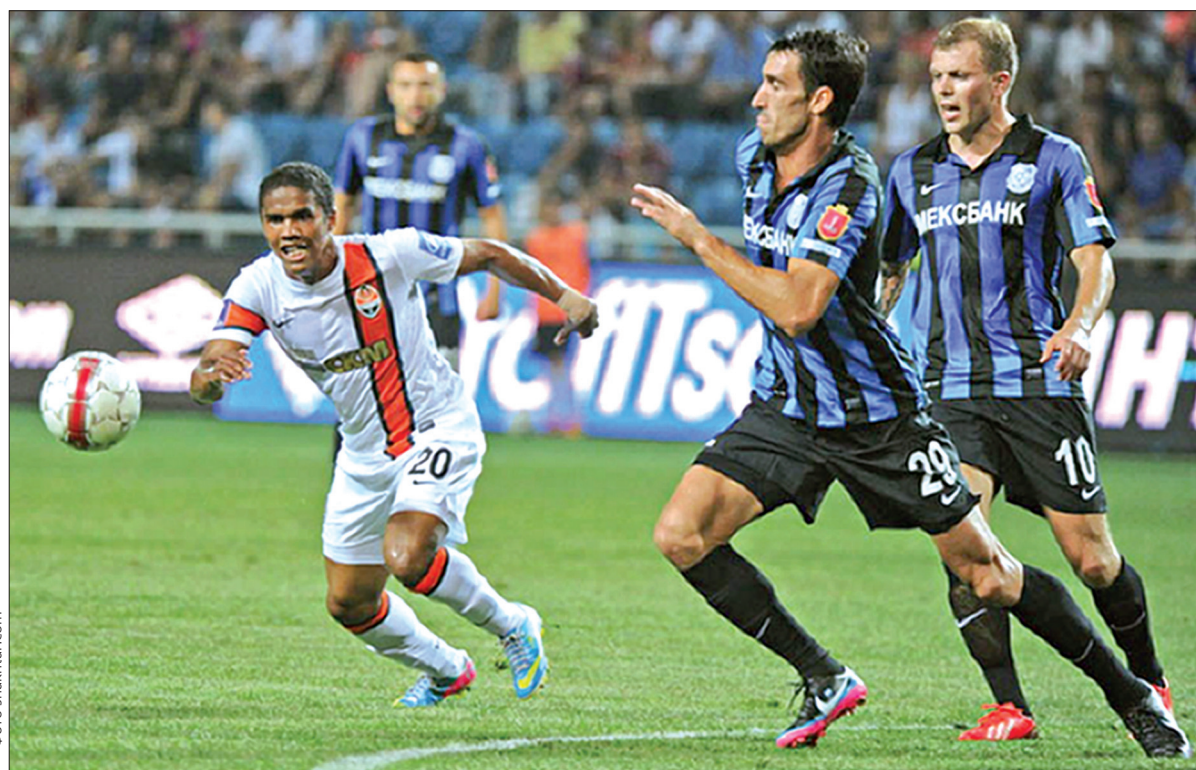
Гравці "Чорноморця" (у синьо-чорній формі) не змогли втримати атакуючого тиску з боку "гірників"