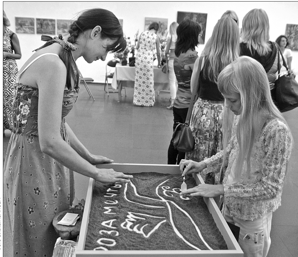
Малювання на піску — не лише захоплююче творче заняття, а й вид арт-терапії

Малювання на піску стало широковідомим в нашій країні завдяки переможниці першого сезону шоу "Україна має талант" Ксенії Симонової. Втім, це не просто розвага, а й метод арт-терапії, що допомагає зняти напруження та розвиває внутрішній потенціал людини. Вже восени спробувати себе у пісочній анімації зможуть всі охочі.