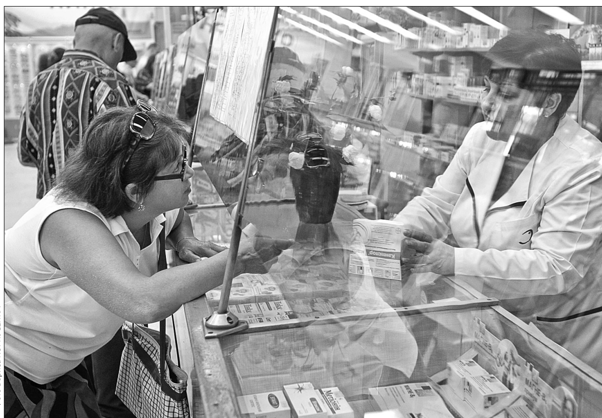
Карткою можна скористатися для проходу в метро та при купівлі ліків у мережі аптек КП "Фармація"

Нині по "Картці киянина" можна купити квиток на потяг через сайт "Укрзалізниця". Також з 2014 року соціальну картку планують зробити універсальним проїзним документом в наземному транспорті