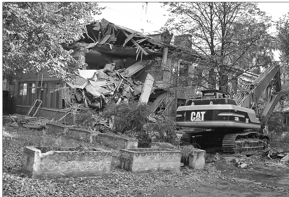
Навчальний корпус ДНЗ № 183 після зупинення незаконних дій з руйнування дитсадка у жовтні 2007 року