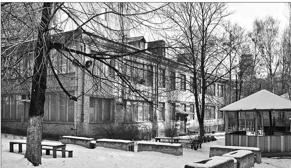
Такий вигляд мав дошкільний навчальний заклад в центрі столиці до руйнування рейдерами

Роками спостерегаючи безпорадність юристів Міносвіти в судах, переконалися у