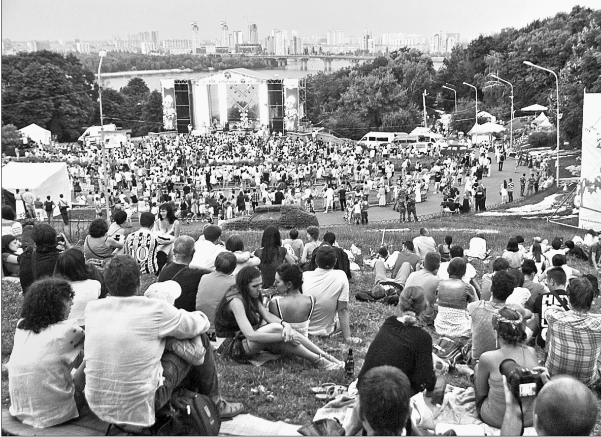
Десяту "Країну мрій" відвідало понад 30 тисяч шанувальників етніки

На території працювало вісім сцен: чотири музичні, одна танцювальна і три літературні. Зокрема відвідувачів знайомили з літературою етнічних спільнот, наприклад — з творчістю українських болгар і вірмен. В майстерні танців навчали танцювати, на дитячому майданчику розважали дітлахів, а на алеї здоров'я пригостили вегетаріанською їжею. Традиційно фестиваль завершився виступом його натхненника й організатора Олега Скрипки з піснею "Країна мрій" ●