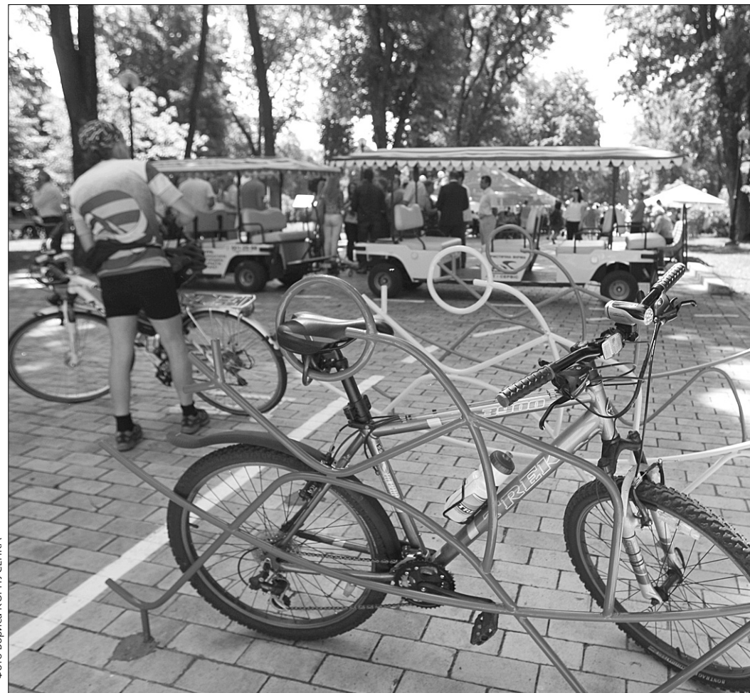
Перший у центрі Києва професійний пункт велопрокату з'явився у парку ім. Шевченка близько двох тижнів тому

Та найчастіше до пункту звертаються студенти, які у вільний від навчання час курсують парком, "протвірюючи" голову й тренуючи м'язи. До речі, найбільше бажаючих покататись тут з'явля-