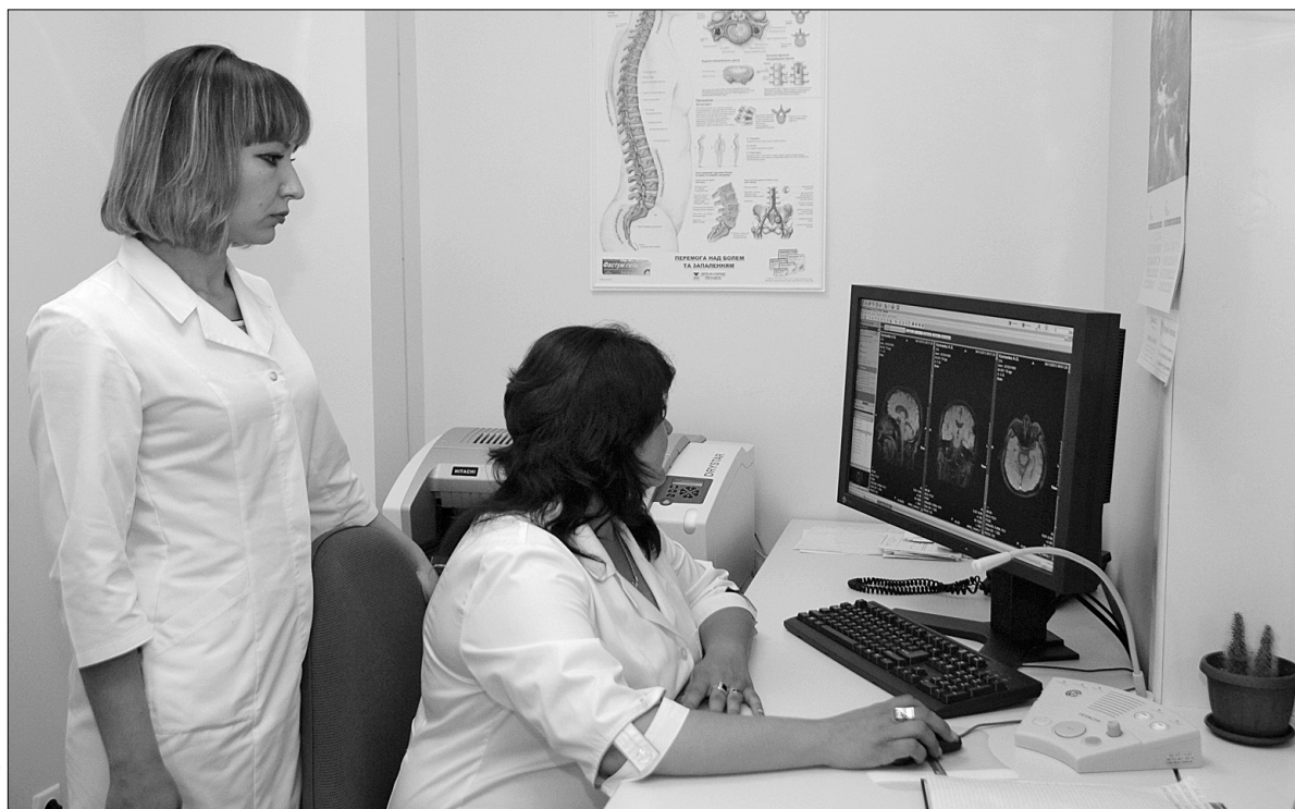
Для облаштування кабінету в ЦРП Оболонського району виділено окреме приміщення, де створені усі умови для якісного обстеження пацієнтів, ефективної роботи медичного персоналу

Оскільки процедура тривала, то щоб уникнути черг, пацієнтів записують заздалегідь, й ті приходять на призначений час. Цікаво, що для