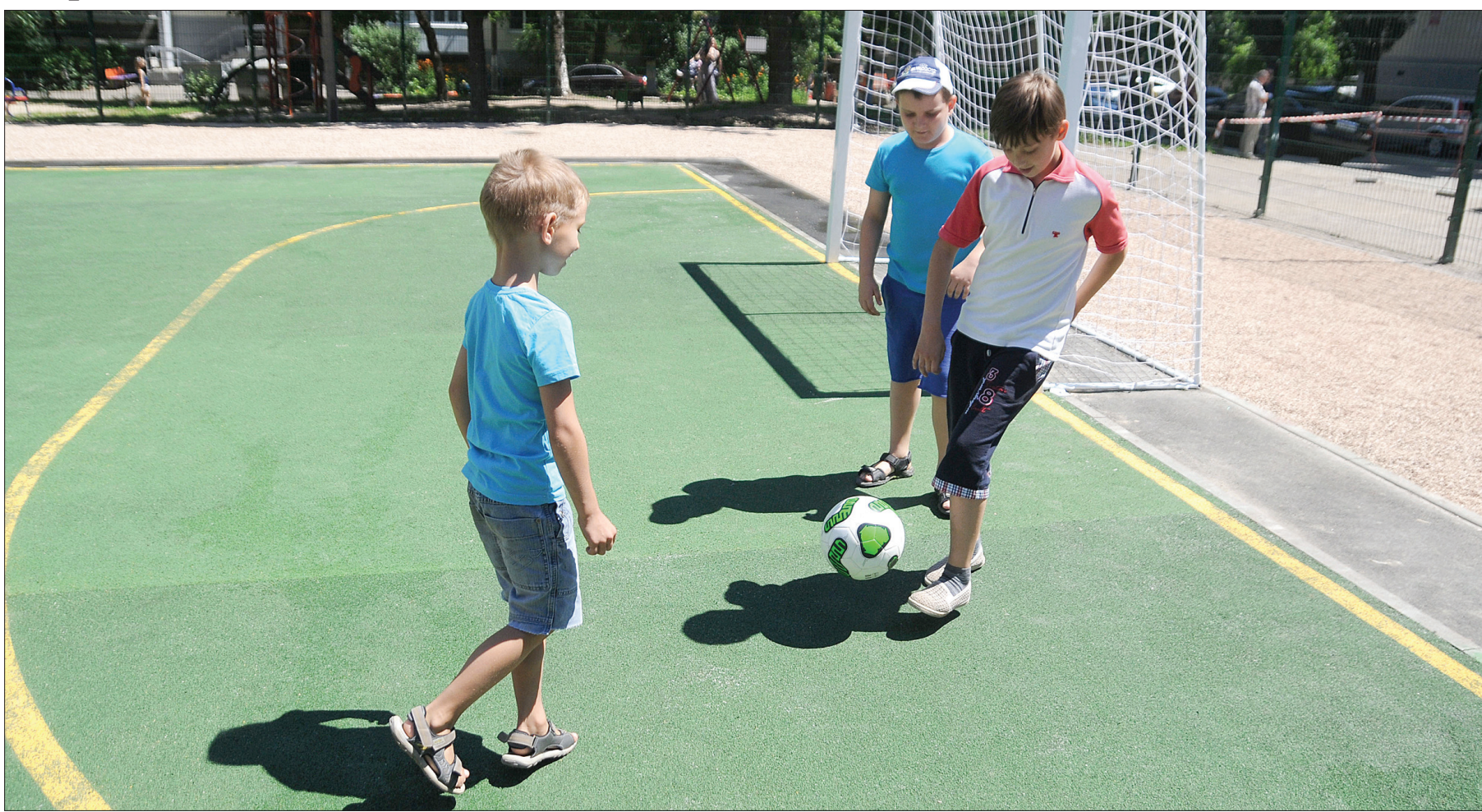
Сьогодні на місці напівзруйнованого спортивного майданчика на вулиці Миколи Островського у Солом'янському районі столиці з'явилося сучасне футбольне поле

За співпраці влади та бізнесу у Солом'янському районі з'явився новий спортивний майданчик