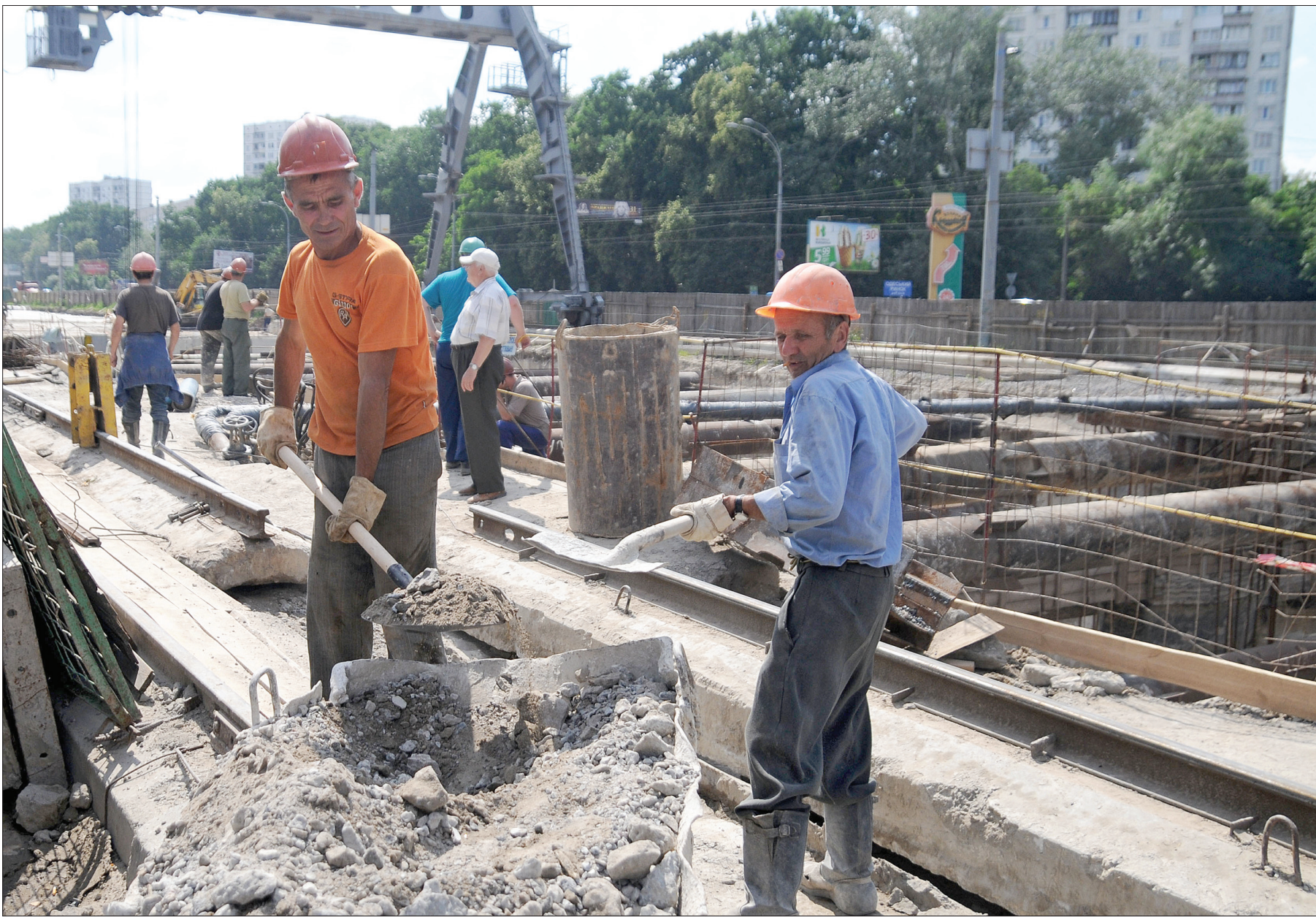
Наразі метробудівці вже завершили прокладання перегінних тунелів майбутньої станції "Теремки", тривають роботи з будівництва тягової підстанції та спорудження вестибюлів

За своєчасного фінансування нову станцію метрополітену здадуть в експлуатацію вже у серпні