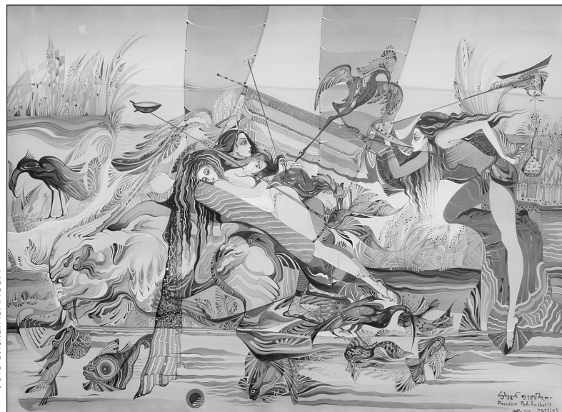
В схожих на казкові картинах Русудан алегорично відображає дійсність, боротьбу добра та зла

в Києво-Печерську лавру, відоме духовне місце. Сподіваюся відвідати її на кілька годин під час наступного візиту, коли приїду на відкриття виставки. Також планую пройти по музеев.