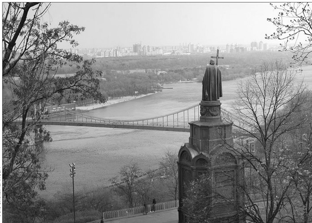
Наразі у столиці триває реконструкція багатьох церковних споруд, пам'ятників, зокрема княгині Ользі, князю Володимирі, Андрію Первозванному, реалізується проект з комплексного благоустрою Володимирської гірки

Окрім того, за словами Олександра Попова,