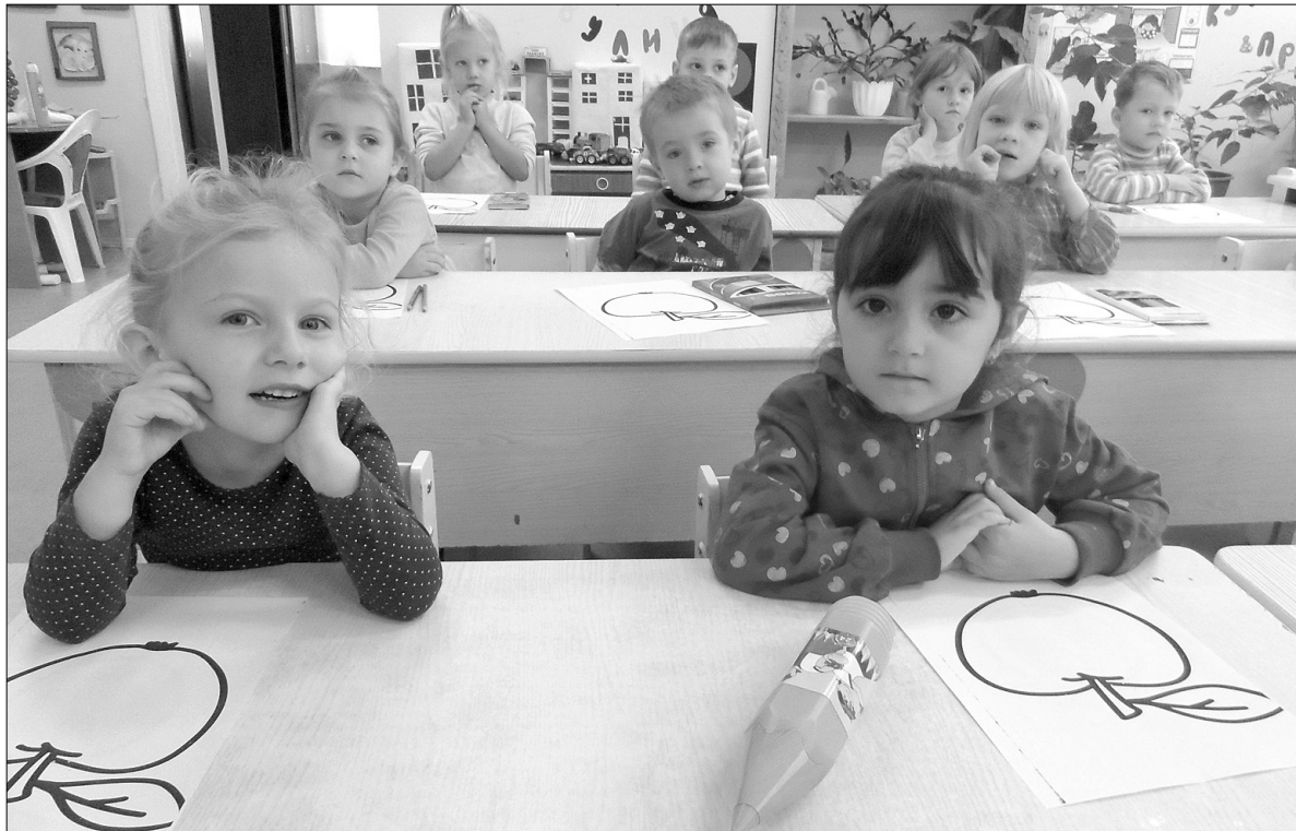
До 1 вересня в дитсадку №7 Дарницького району столиці відкриють дві нові ясельні групи і одну — молодшого садового віку

Столична влада ось уже третій рік поспіль успішно здійснює масштабну програму з відновлення дитячих садків. Тільки в поточному році у Києві буде створено 4300 додаткових місць у ДНЗ. Тож черга у 6600 дітей зменшиться приблизно на дві третини. Зокрема в дитсадку № 7 Дарницького району після ремонту приміщень перевантажені 11 вікових груп будуть реформовані у 14-ть (як це і має бути при кількості юних відвідувачів закладу у майже 260 осіб). До 1 вересня тут почнуть функціонувати дві нові ясельні групи і одна — молодшого садового віку.