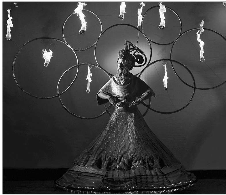
Виступ угорських гостей "Magma Firetheater" під назвою "LAVA" зачаровує естетикою та фантастичними вогняними костюмами

Наступного дня, 15 червня, на Співочому полі захід стартує з 17-ї години. За словами організаторів, фестиваль щороку розширюється, тож вони обрали нову локацію, що-