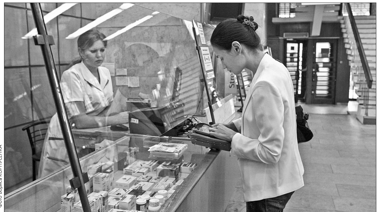
Відтепер власники "Картки киянина" можуть придбати лікарські засоби вітчизняного та закордонного виробництва зі знижкою у десяти аптеках КМДА "Фармація"

Нагадаємо, в цих аптеках для власників "Картки киянина" встановлена