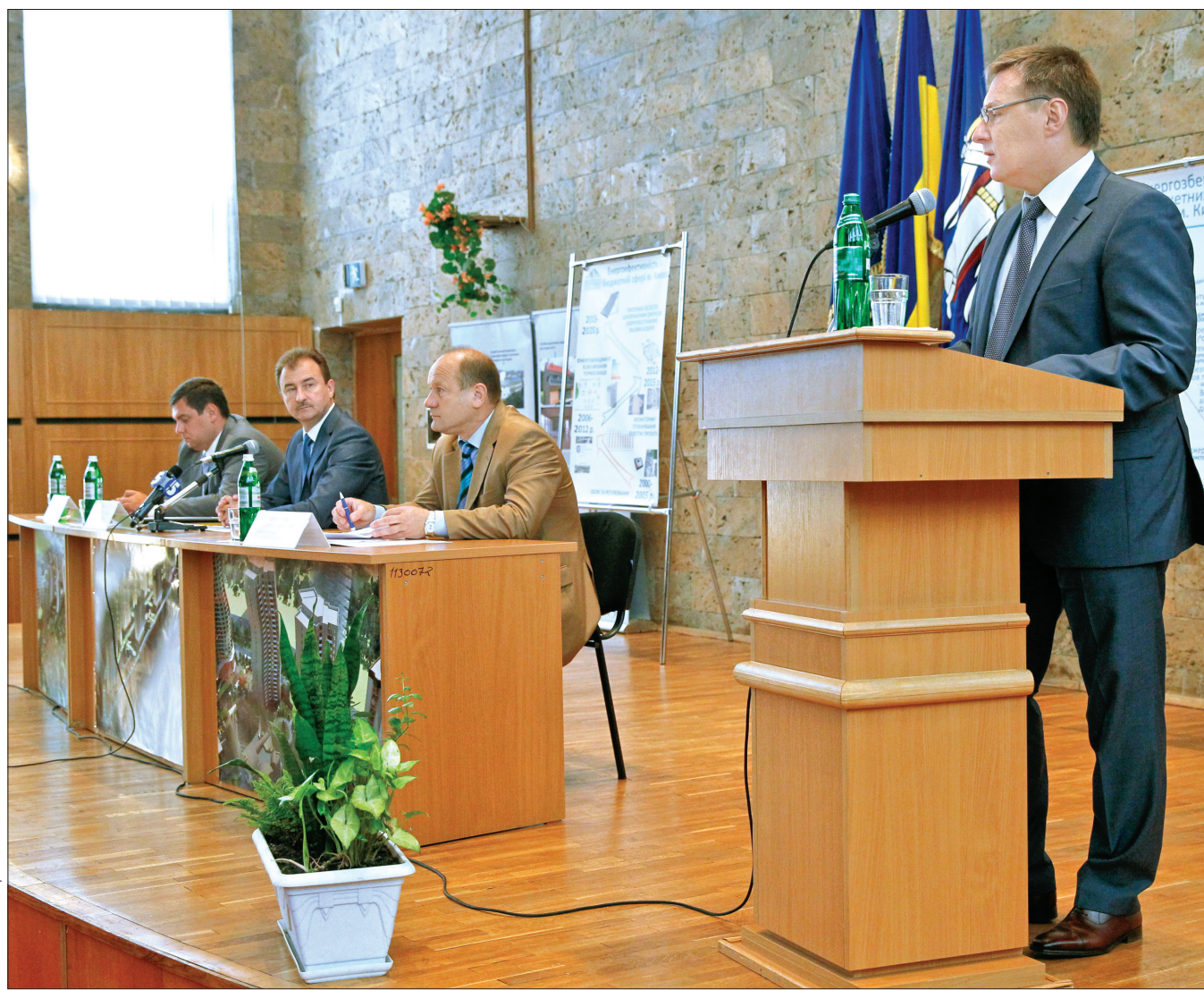
Під час засідання комітету з економічних реформ йшлося про те, що коштом Київського протоколу вже цьогоріч можуть бути проведені роботи з термосанації майже 80-ти шкіл та дитячих садочків

"Важливим напрямом залишається і навчання дітей з питань енергозбереження. У цьому році Департамент спільно з компанією "ДТЕК" провів конкурс на кращий проект з енергоефективності.