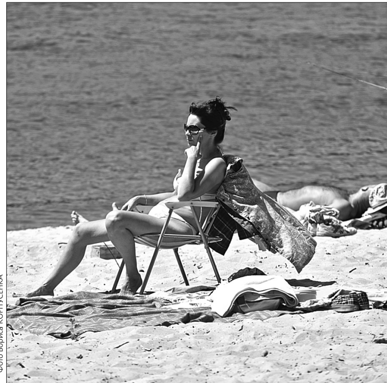
Для відпочинку киянам пропонують 11 міських пляжів та 14 зон відпочинку біля води

міських пляжах, а паспорти готовності нині передано на підпис до столичної санепідемстанції. Та поки що