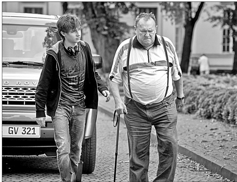
"Дні Польського Кіно" розпочне зворушлива оповідь "Мій велосипед", присвячена примиренню чоловіків в родині

червня о 17.10) про повітряні баталії на симуляторах польотів. А картинною закриття стане історична драма "Польська Сибіріада" Януша Заорського (4 червня о 16.00), яку глядачам презентує частина творчої групи. Стрічка оповідає драматичну до-