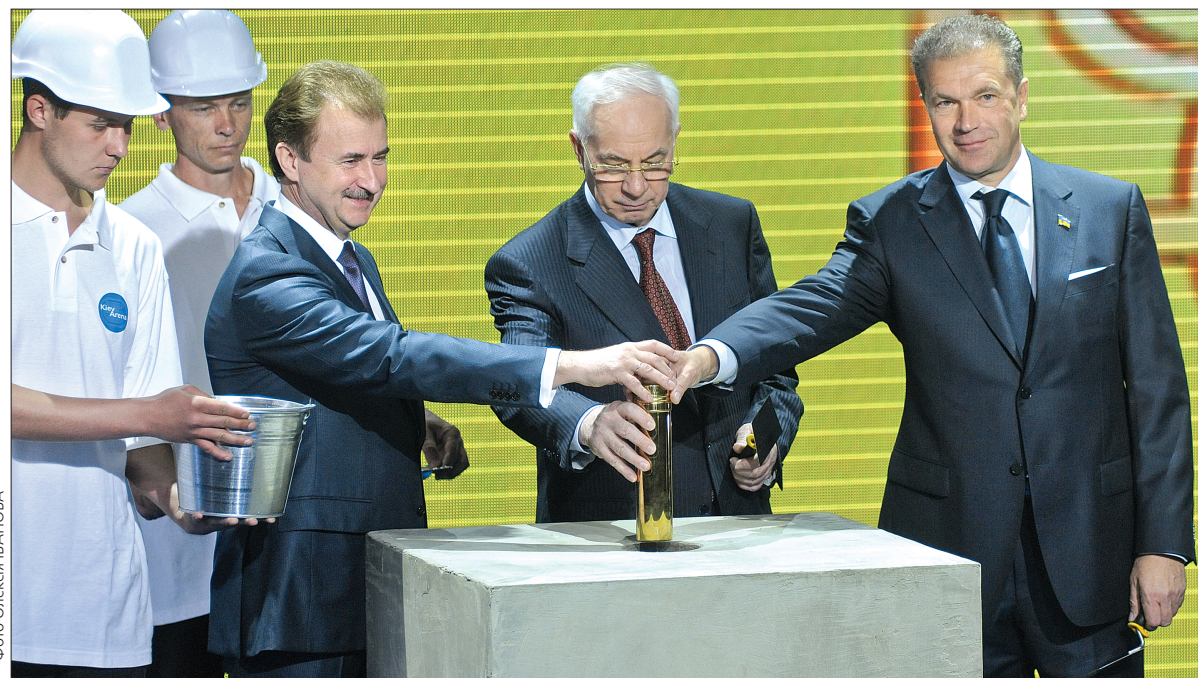
Голова КМДА Олександр Попов, прем'єр-міністр України Микола Азаров та голова Ради директорів компанії-забудовника "DeVision" Дмитро Буряк закладають капсулу у будівництво суперсучасного спорткомплексу

Напередодні 1531-ї річниці свого заснування столиця отримала по-справжньому царський подарунок — початок будівництва "Київ-Арени", яка повинна стати місцем проведення фінальної частини Євробаскету-2015. Закладання капсули у фундамент нового суперсучасного спорткомплексу "Kiev-Arena" відбулось за участі прем'єр-міністра Миколи Азарова, голови КМДА Олександра Попова, представників ФІБА-Європа та організаційного комітету Євробаскету-2015.