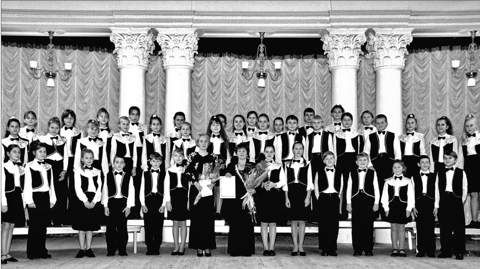
Переломним для колективу став 2004 рік, коли хор отримав бронзову медаль III Всесвітньої Хорової Олімпіади та виступив на концерті кращих дитячих колективів "Квітневі зорі" у столичній філармонії

Хор дитячої музичної школи № 24 відсвяткував 40-річний ювілей