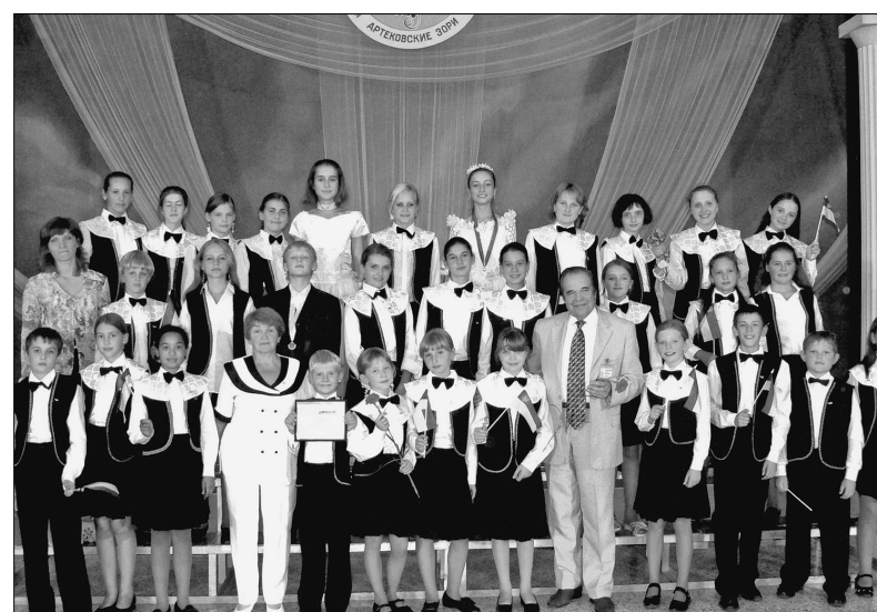
Хор є постійним учасником Міжнародного конкурсу "Артеківські зорі" ім. Г. Струве в "Артеку"