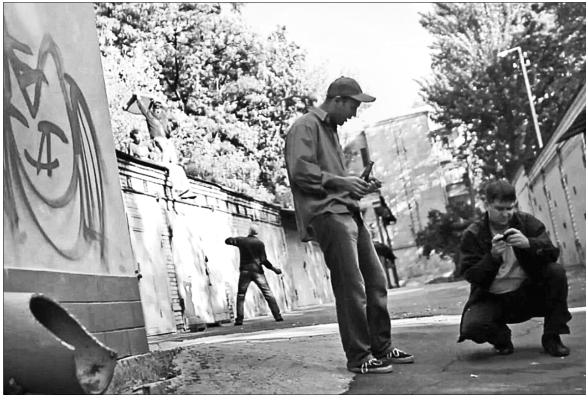
Короткометражка "День Незалежності" минулого року отримала Гран-прі національного конкурсу МКФ "Молодість-42"

Також у програмі фестивалю — драма Агнешки Холланд "У темряві" (2 червня о 16.00) про майстра львівських каналізаційних мереж Леопольда, що у 1942 році врятував від німців понад 10 євреїв. У 2012 році стрічка була номінована від Польщі на "Оскар". Любителю мелодрам пропонують переглянути картину "Яви лишень!" Анджея Якімовського (30 травня о 16.30) про нестандартні прийоми лікаря для сліпих, фільм про гріховне кохання брата й сестри "Не соромлячись" Філіпа Марчевського (1 червня о 17.00) та романтичну комедію Єжи Штура "Любовні історії" (31 травня о 16.30). Чоловікам має сподобатися політичний трилер "Кріп" Рафалія Левандовського (29 травня о 16.30), в якому герой намагається довести, що його батька несправедливо звинуватили у зраді. Окрім ігрового кіно, поляки презентують і документальну стрічку "Віртуальна війна" Янека Блавуца (3