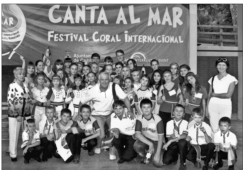
Минулого року на Міжнародному хоровому фестивалі Cantata al mar в Іспанії, який зібрав колективи з 36 країн, "Шкільний корабель" здобув друге місце

Такі конструкції застосовують в Голландії, і вони дуже добре себе зарекомендували. Таким чином Шевченківська РДА послідовно впроваджує тему екологічного транспорту в центрі міста. Наступних два пункти будуть розташовані на вул. Б. Хмельницького, 1 і Пушкінській, 1-3/5 ●