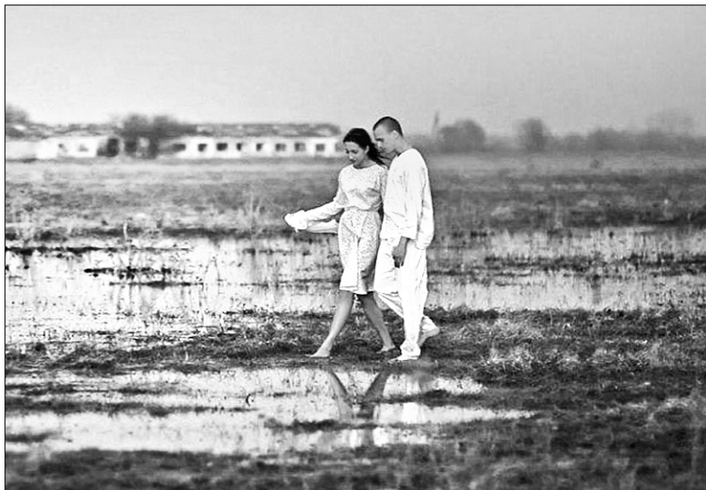
Стрічка "Уроки української" показує драматичне кохання молодої вчительки і хлопця-шахтаря