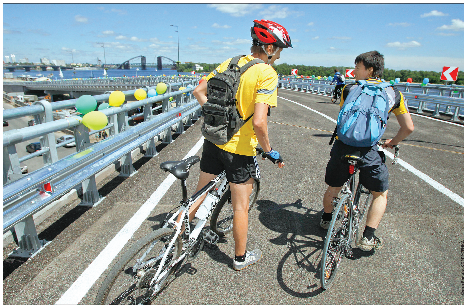
На День Києва на Поштової площі відкрили естакаду, а вже за місяць тут запрацює перша черга тунелю

На День Києва тут відкрили естакаду, а вже за місяць запрацює перша черга тунелю