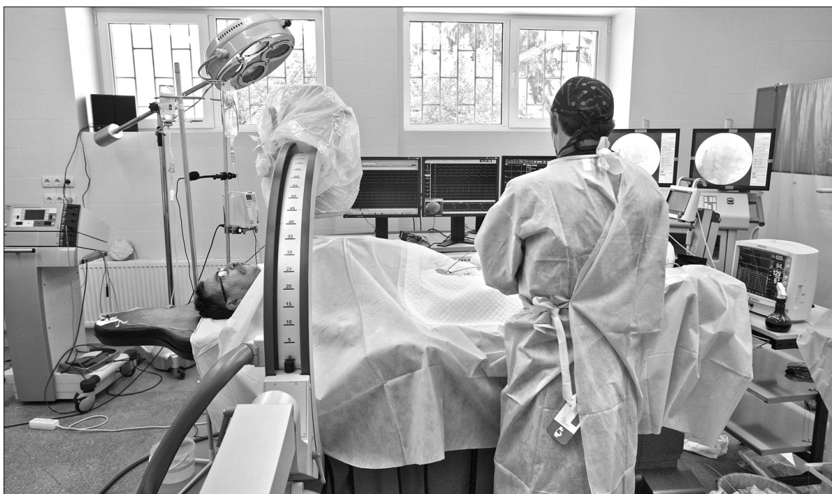
Операція катетерної абляції на серці дає змогу усунути причину аритмії

Лікарі Інституту серцево-судинної хірургії ім. Амосова та Інституту кардіології ім. М. Стражеска 16—17 травня провели операції із вживлення кардіовертерів-дефібриляторів, а також катетерної абляції за новою технологією Cartool3. Тривала пряма трансляція складних хірургічних маніпуляцій, тож ознайомлення з сучасними методами лікування змогло не лише широке коло хірургів, а й пацієнти ●