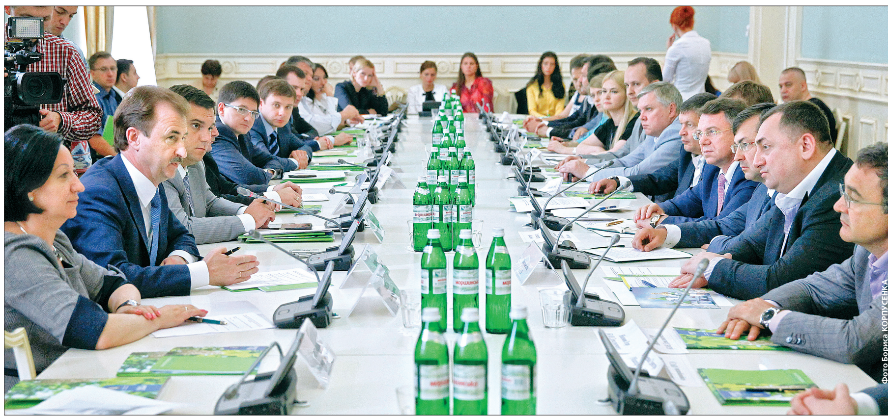
Під час засідання Ради інвесторів голова КМДА Олександр Попов зазначив, що створення належних умов для інвестиційної діяльності в столиці України є одним із пріоритетних завдань київської влади

Цього року місто очікує на збільшення притоку приватного капіталу на 10—15 %