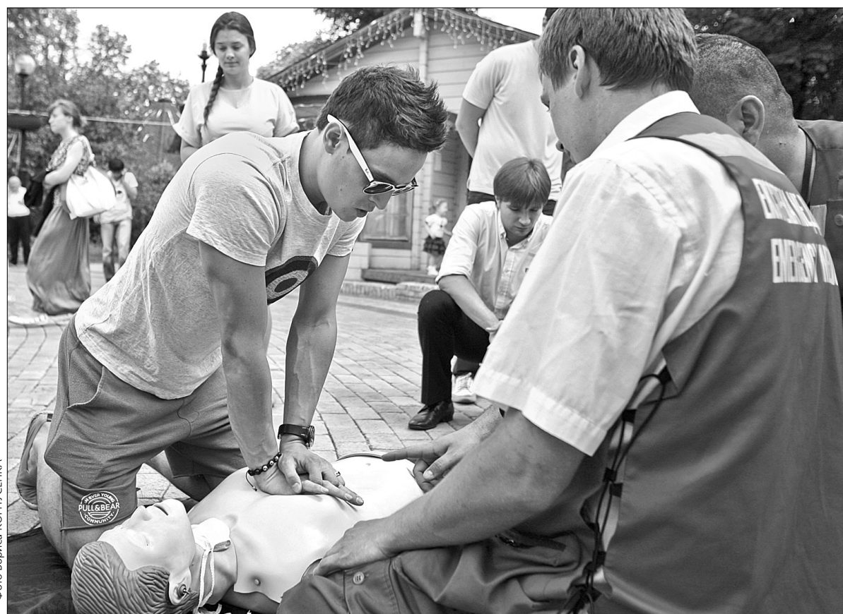
Під час акції у парку імені Шевченка чимало киян мали змогу навчитися робити закритий масаж серця

Сьогодні в Україні на 1 000 населення припадає одна смерть через раптову зупинку серця. Після інфаркту міокарда вона на другому міс-