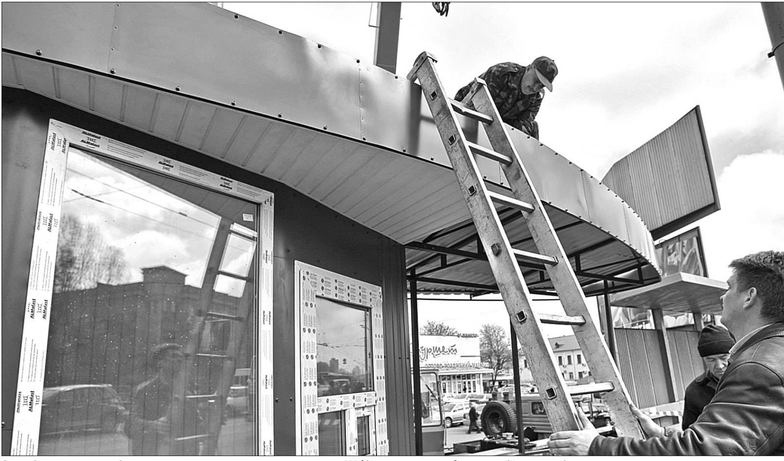
Останнім часом в столиці демонтували чимало незаконно встановлених МАФів, насамперед поблизу станцій метрополітену

Київська влада пришвидшує темпи демонтажу незаконних МАФів