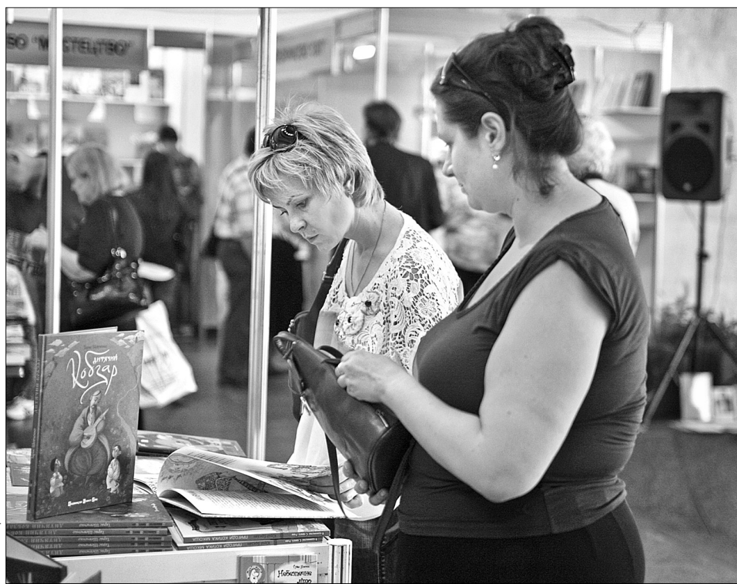
На виставці шанувальники літератури можуть знайти собі книжкові новинки до смаку і за доступною ціною

Видавництво "Старого Лева" презентувало со-