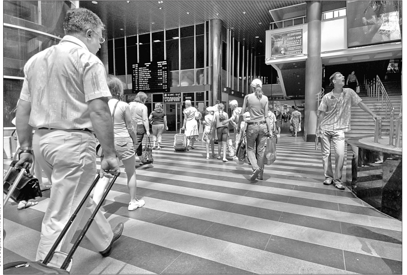
Українська столиця продовжує поповнюватися мешканцями та впевнено утримує лідерство за кількістю населення серед вітчизняних міст

Зокрема упродовж січня-грудня минулого року природний приріст склав 6 047 осіб, а міграційний — 24 718 осіб. Тоді міграційний приріст населення був зафіксований у десяти районах Києва, а найбільш "популяр-