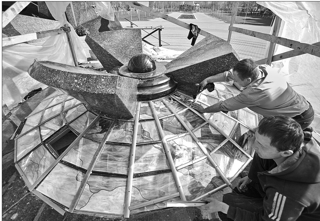
На території меморіального комплексу "Героям Чорнобиля", що в Деснянському районі столиці, у п'ятницю об 11.00 відбудеться урочисте відкриття архітектурного елемента "Земля"