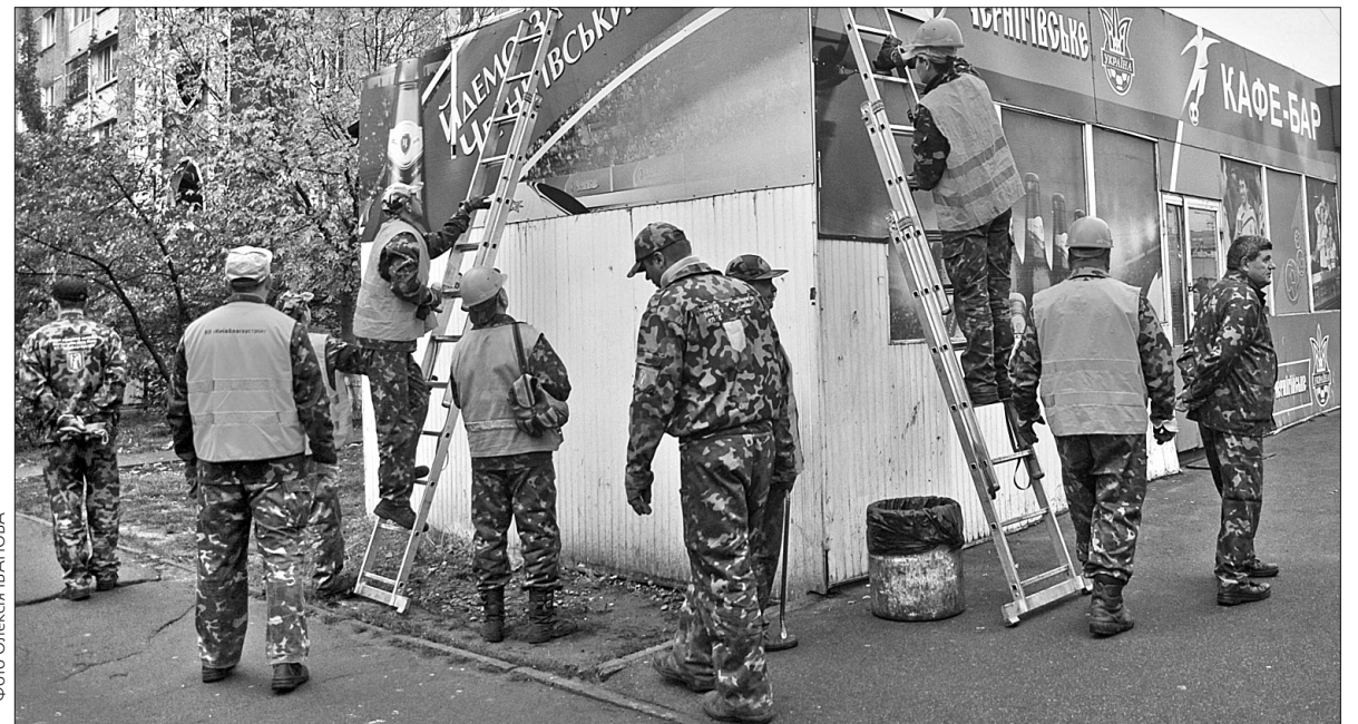
Від початку року в Києві демонтували майже 1 700 тимчасових споруд

В інших п'яти районах Києва значно нижчі показники. Так, за аналогічний період у Печерському районі знесли 163 кіоски, в Подільському — 145, у Солом'янському — 138. А Голосівський район "пасе задніх": від початку року тут демо-