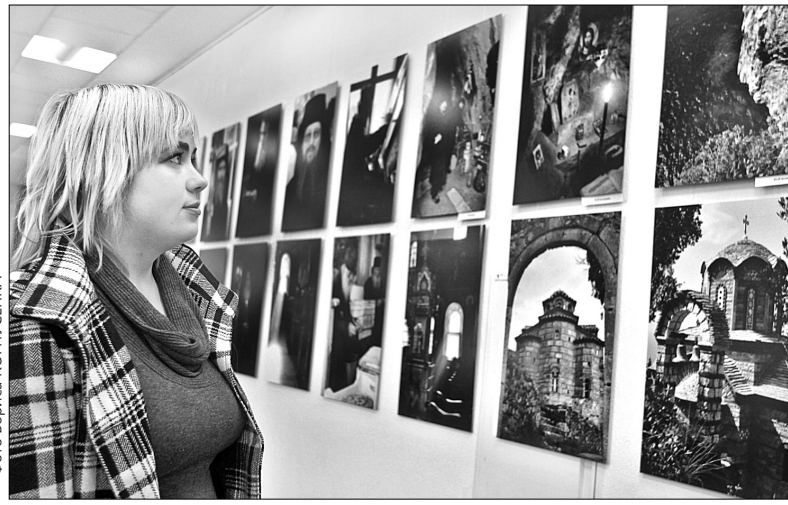
Фотографії Костаса Асиміса переносять в таємничий світ Афону, показуючи його природу, монастирі, побут і мешканців

У Музеї історії Києва відкрилася фотовиставка "Наш Афон", що знайомить з природою чернечої держави, храмами та побутом мешканців Святої Гори. Відвідувачі можуть порівняти історію та сучасні роботи: окрім понад 150-ти робіт нашого сучасника Костаса Асиміса, представлені також архівні чорнобілі світлини середини XIX — початку XX століття.