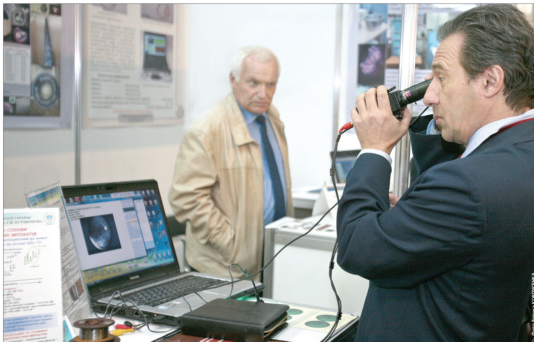
На виставці представлено 800 науково-технічних розробок, які спрямовані на підвищення технологічного та технічного рівнів різноманітних галузей господарства країни — охорони здоров'я, інформтехнологій, машинобудування, ЖКГ, енергетики

Столичні винахідники продемонстрували підприємцям міста власні розробки