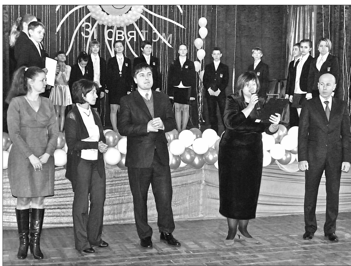
В навчальному закладі започатковано роботу факультативів, організовують конкурси малюнків та плакатів, творчих робіт, поробок, учні залучаються до участі в багатьох проектах

Виховати енергетично та екологічно грамотного, відповідального і свідомого громадянина, який зберігає і раціонально використовує природні ресурси — одне з завдань сучасної школи. Саме тому вчителі, учні та батьки середньої загальноосвітньої школи № 201, що у Дніпровському районі, з ентузіазмом сприйняли звістку про можливість взяти участь у впровадженні освітньої програми "Енергоефективні школи", створеної за сприяння компанії "D. ТЕК" Інститутом місцевого розвитку. Цього року вихованці навчального закладу долучилися до багатьох цікавих проектів, зокрема до конкурсів творчих робіт, анкетування та просвітницької роботи серед киян.