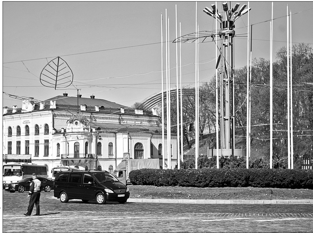
До Дня Європи на Європейській площі в столиці встановлять стяги всіх країн-членів ЄС і національний прапор України