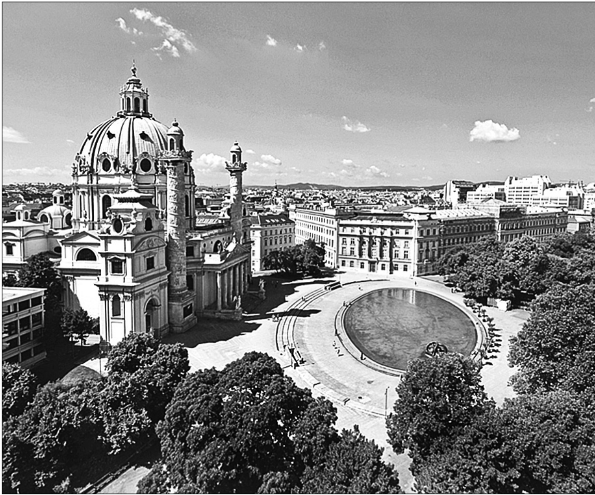
Вітчизняні підприємці повезли до Відня бізнес-пропозиції для австрійських інвесторів

Дні Києва у Відні 22 квітня стартували з бізнес-форуму, в якому взяли участь 25 вітчизняних та 70 австрійських компаній. На розсуд австрійських колег кийвська делегація представила програму "Київ інвестиційний", в якій окреслила всі стратегічні напрямки розвитку міста та презентувала проекти, де передбачається участь інвесторів. Розширені презентації для потенційних партнерів запропонували й кийвські компанії.