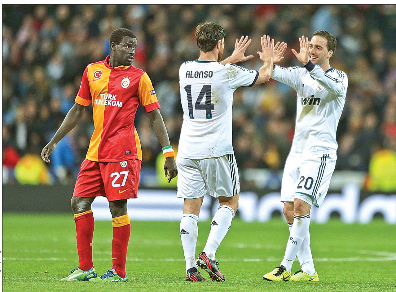
Автор третього голу у ворота "Галатасарая" нападник "Реалу" Гонсало Ігуаїн (праворуч) приймає вітання від партнера по команді Хабі Алонсо

У вівторок та середу оновилися змагання у найпрестижнішому футбольному турнірі Європи Лізі чемпіонів. Цими днями відбулися матчі в рамках 1/4 фіналу. За підсумками перших зустрічей найбільше шансів пройти у наступний раунд має мадридський "Реал". Іспанський клуб на власному полі не зустрів навіть зонального опору з боку турецького "Галатасарая" і завершив поєдинок з рахунком 3:0. Перемогу своїй команді забезпечили голи Кріштіану Роналду, Каріма Бензема та Гонсало Ігуаїна. А ось кривдник "Шахтаря" у 1/8 фіналу дортмундська "Борусія" на виїзді зіграла в "суху" нічию з "Малагою".