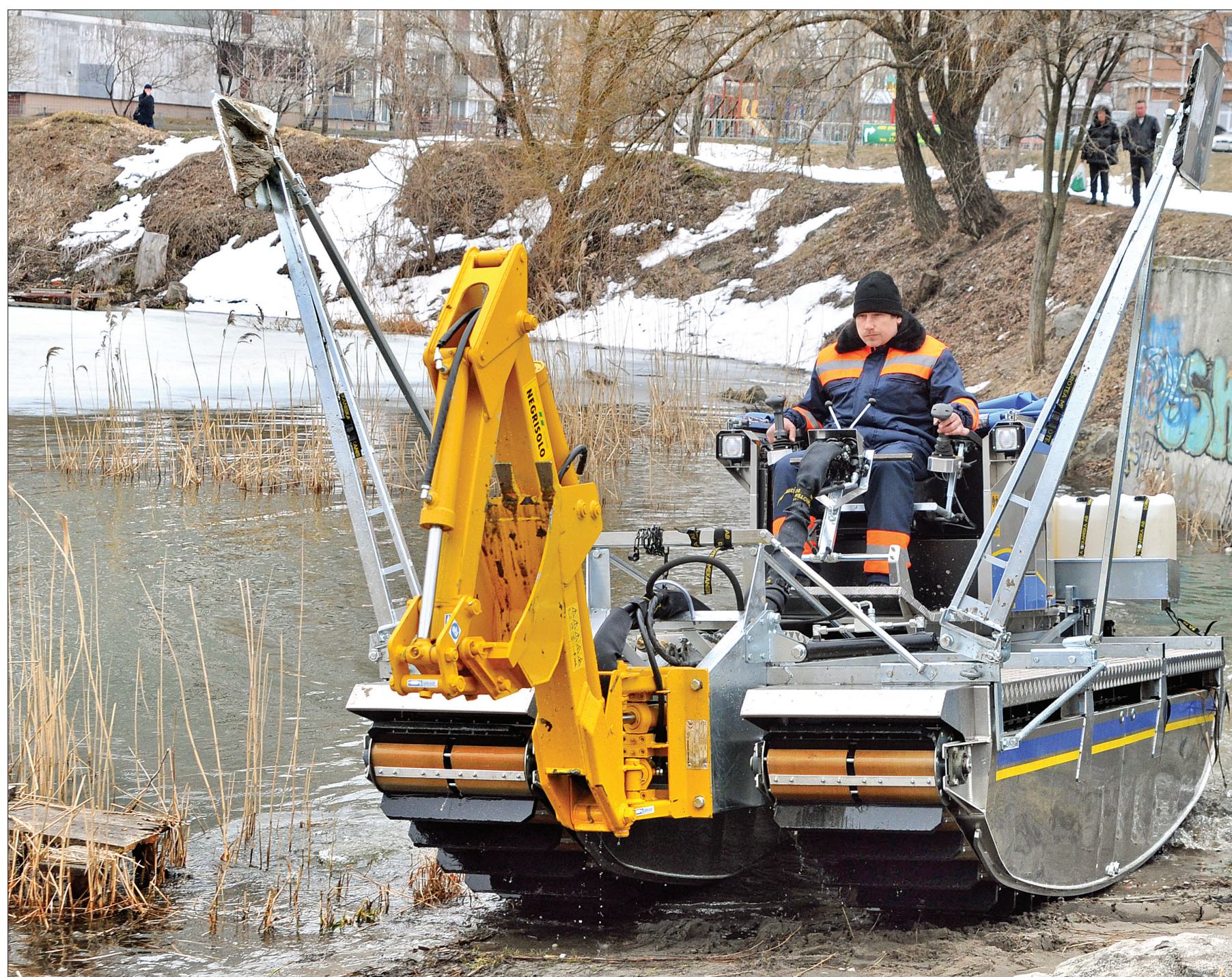
Амфібія має ковш з опорами, обладнання для скошування рослинності, очеретокосарку, граблі з відкидними боковими секціями, які укомплектовані сіткою для збирання бруду та водоростей

Для попередження паводку влада міста залучає унікальну техніку