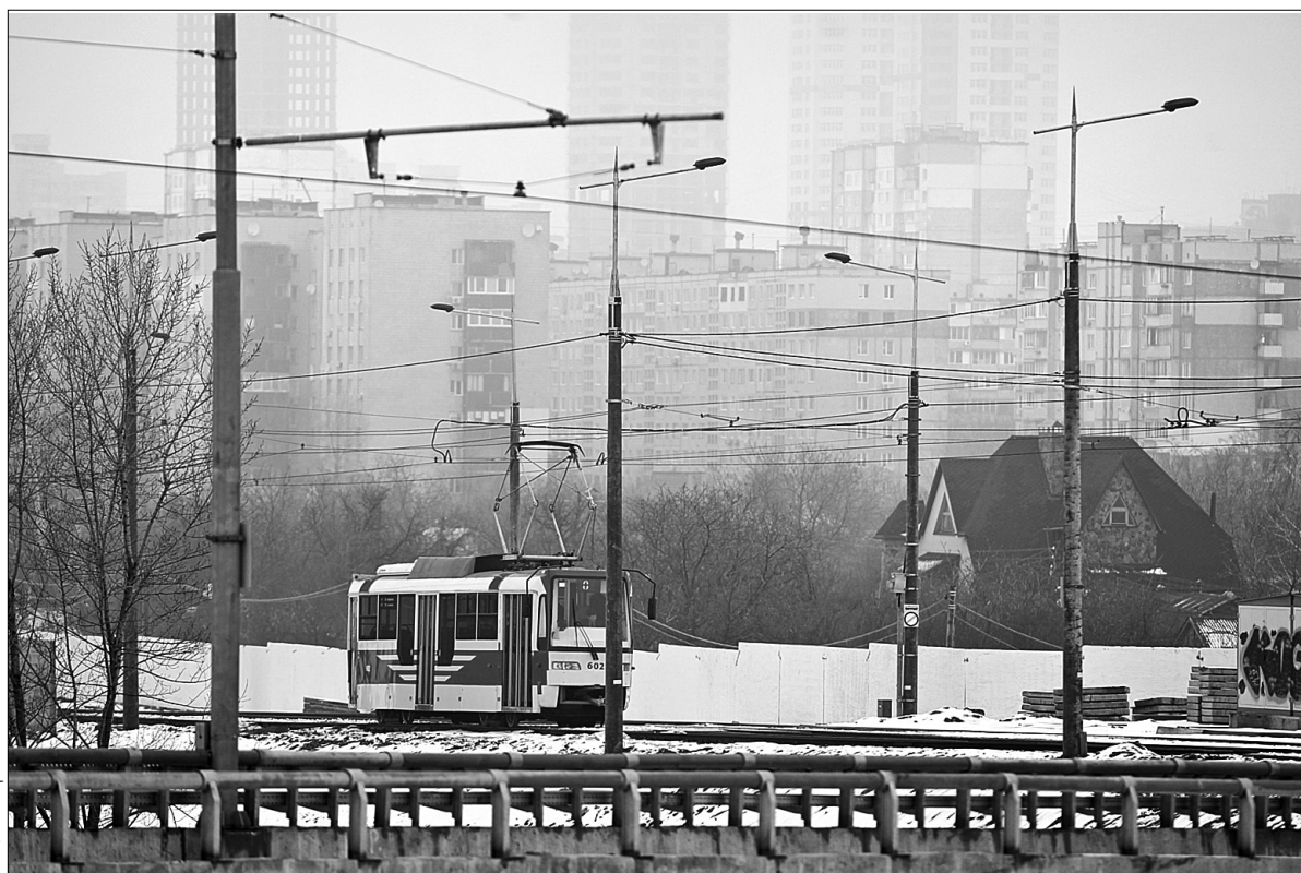
У майбутньому троєщинська четверта лінія метрополітену буде сполучена зі швидкісним трамваєм — він курсуватиме до станції "Райдужна"

Нині район готується до реалізації найважливішого проекту для мешканців Троєщини — будівництва метро. На омріяну транспортну ар-