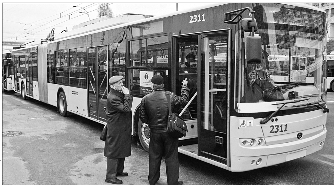
За кредит ЄБРР КП "Київпаstrans" у 2013 році придбає 114 троллейбусів марки "Богдан"

Планує влада реалізувати і низку енергозберігаючих заходів у всіх сферах. Крім того, продовжать роботи з підвищення якості і доступності освіти шляхом впровадження альтернативних форм ут-