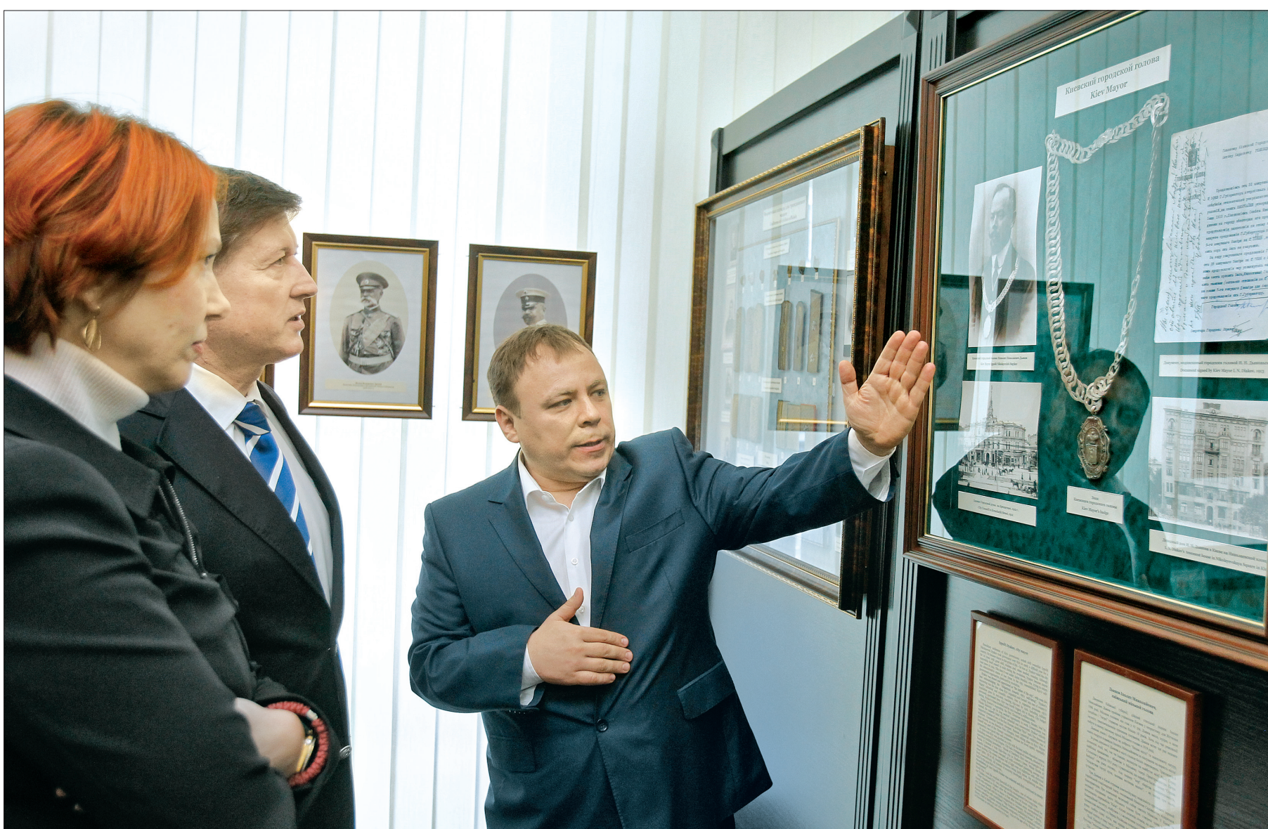
Поміж цікавинок в експозиції - посадовий знак Київського міського голови Іпполіта Дякова, який керував Київською думою 10 років - з 1906-го по 1916-й роки

В Музеї історії міста відкрилася унікальна експозиція про життя городян минулого століття