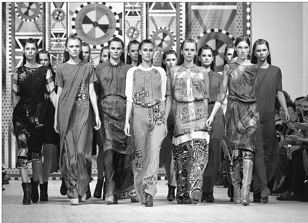
Незабаром вітчизняні дизайнери представлять своє бачення модного сезону "Осінь-зима 2013—2014"

З 6 по 10 березня в музейному комплексі "Мистецький Арсенал" триватимуть покази дизайнерів в рамках 32-го Українського тижня моди. За ці дні на подіумі промайнуть 39 колекцій 51 дизайнера на сезон "Осінь-зима 2013/2014". Крім того, на тижні моди презентують спеціальні проекти "Ретроспектива аксесуарів українських дизайнерів" та Fashion Move On, проведуть міжнародний круглий стіл "Дизайнери "нових" країн на fashion-ринку "старої" Європи".