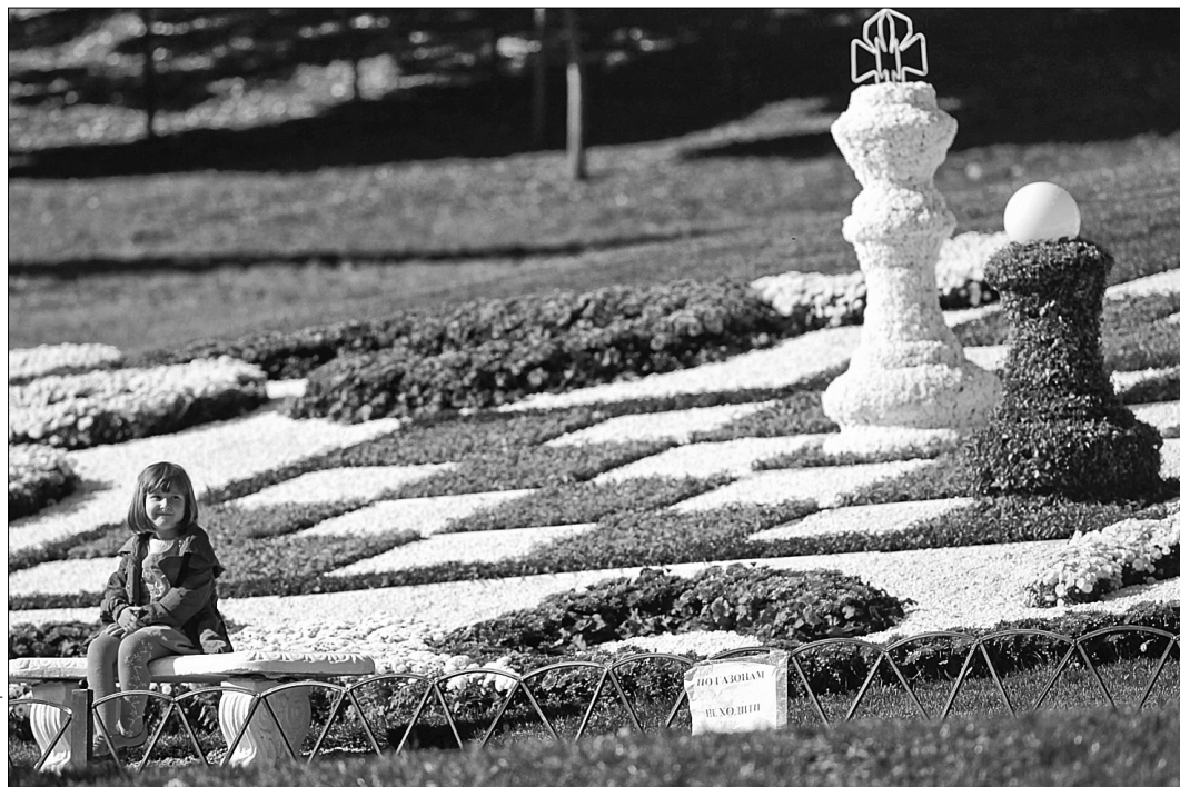
Цьогоріч у місті планується висадити 15 тисяч дерев, 40 тисяч кущів, 10 мільйонів різноманітних квітів

На думку очільника КМДА, реалізувати таку велику програму буде значно легше спільними зусиллями влади, громади та представників бізнесу. "Весна для столиці — це старт програм з благоустрою. Ми підготували дуже масштабну і цікаву програму, яку хочемо реалізувати разом із киянами. Я запрошую усіх небайдужих городян, ОСНІ, кооперативи, громадські організації та політичні партії — виходьте зі своїми ініціативами і давайте озеленювати місто разом", — закликав Олександр Попов. Водночас голова КМДА звернувся до киян, а та-