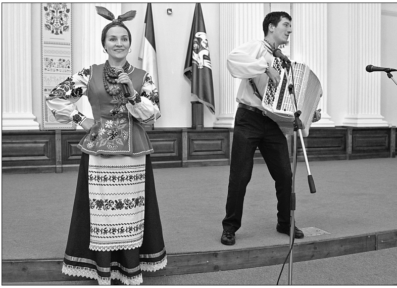
На гала-концерті лауреати конкурсу "Зорепад талантів-2013" приймали вітання та представляли свої номери

У Колонній залі КМДА пройшов гала-концерт та нагородження переможців одразу двох конкурсів Об'єднання первинних профспілкових організацій Київради та КМДА — "Зорепад талантів-2013" та "Рідна Україна — пісень і вишивок країна". Присутні змогли помилуватися кращими вишиваними роботами та почути лауреатів конкурсу самодіяльності.