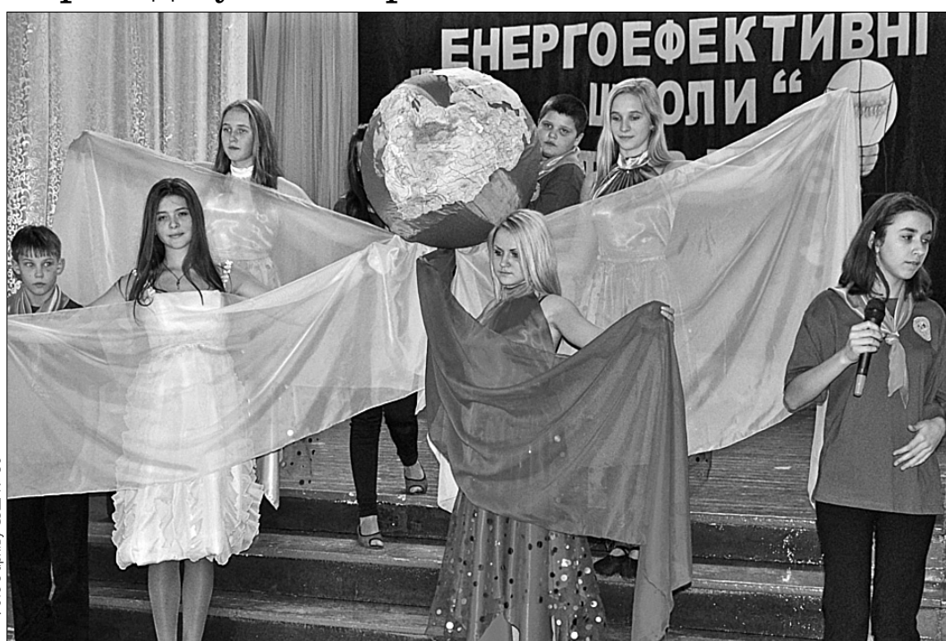
До проекту "Енергоефективні школи" долучилася й СЗШ № 96, учні якої не лише вивчають шляхи вирішення екологічних проблем, а й закликають усіх мешканців столиці докласти зусиль до збереження довкілля

В наш час збереження природних ресурсів є одним з найважливіших питань розвитку людства у майбутньому. Нещодавно десять шкіл міста Києва залучилися до проекту "Енергоефективні школи". Серед них середня загальноосвітня школа № 96, учні якої не лише вивчають шляхи вирішення екологічних проблем, а й закликають всіх мешканців столиці докласти власних зусиль до збереження довкілля.