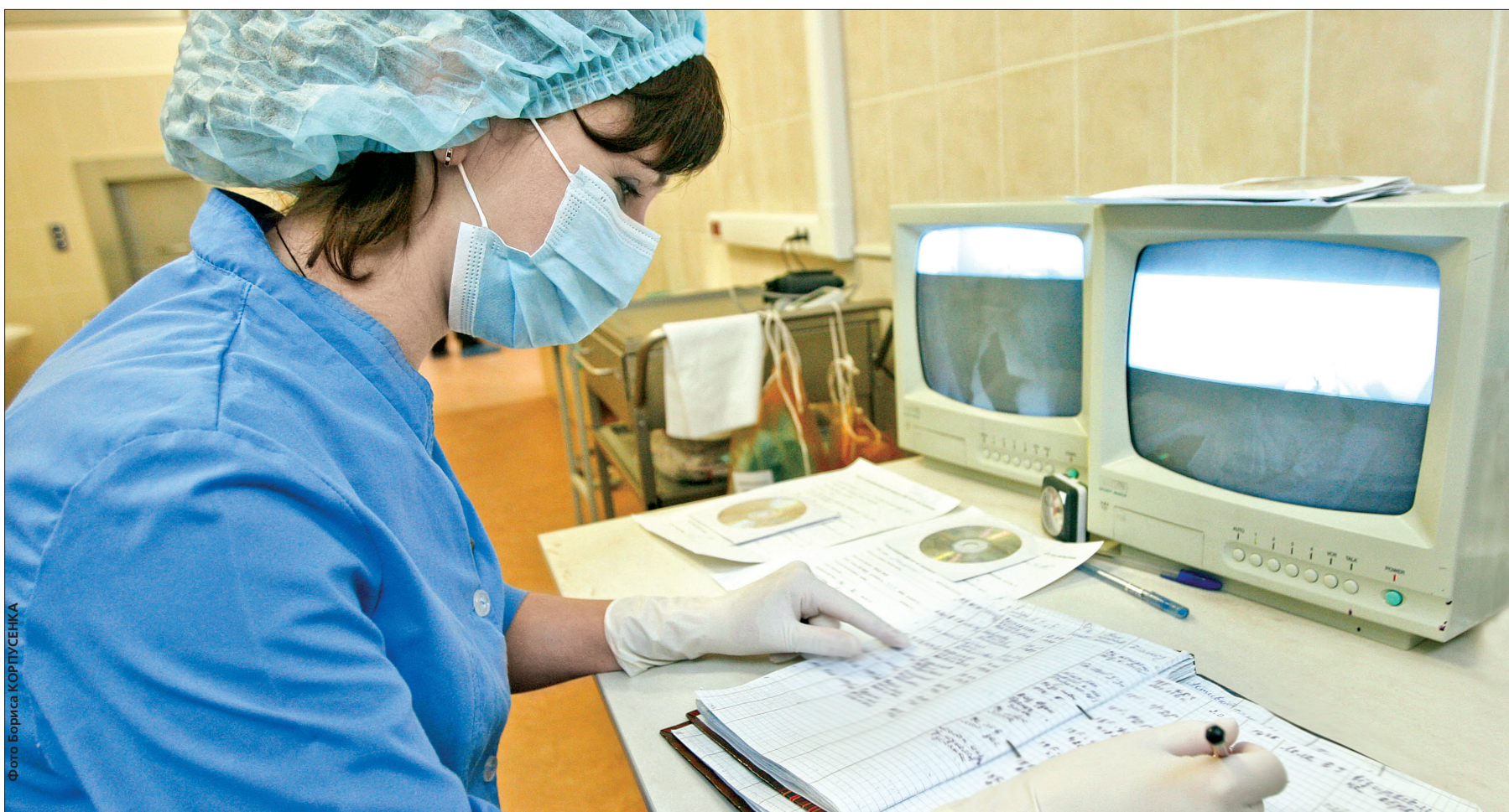
В Департаменті охорони здоров'я заявляють про створення у Києві муніципальної страхової компанії, яка буде надавати послуги у декілька разів дешевше за ринкові

Вона реалізовуватиме медичні поліси за прийнятними цінами