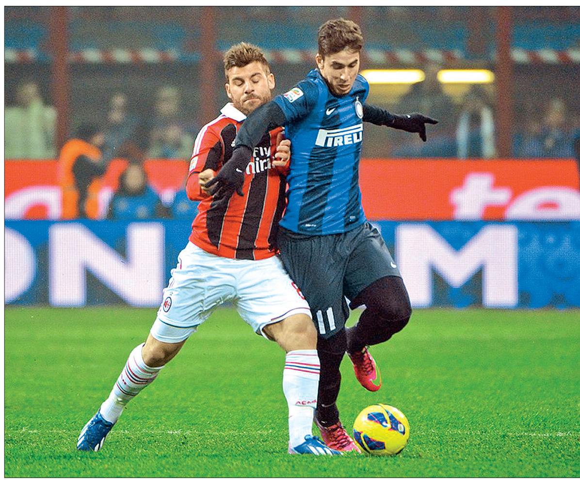
Останній раз нічийний результат у міланському дербі був зафіксований у 2004 році

У Серії А пройшли ігри 26 туру. У центральному матчі "Інтернаціонале" зустрівся із своїми сусідами по місту "Міланом". Протистояння відбулося у суто італійському стилі і вперше за останні 9 років завершилося нічиєю. Рахунок відкрили футболісти "Мілана", на 21 хвилині відзначився Стефан Ель-Шаараві. "Інтернаціонале" спромігся відігратися у другому таймі, коли Езеکیل Скетотто ударом голови встановив остаточний результат. У підсумку рахунок матчу 1:1. А лідувати у чемпіонаті продовжує туринський "Ювентус", який переміг футболістів "Сієни" — 3:0.