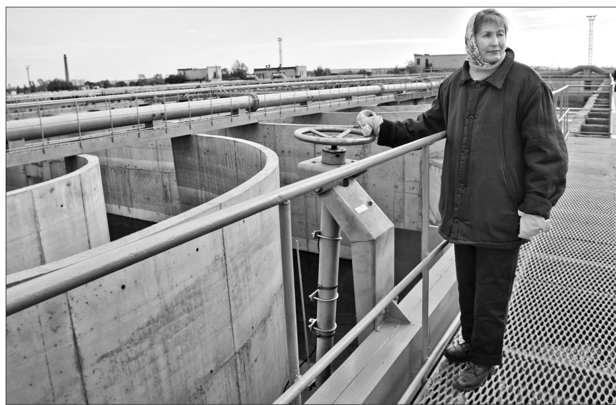
У стоках, які надходять на очистку до Бортницької станції аерації від підприємств міста, суттєво перевищено рівень допустимої концентрації забруднюючих речовин

До того ж він уже відбував тюремне покарання за вчинення крадіжок. Однак достроково звільнившись з місць позбавлення волі, скоїв нові злочини ●