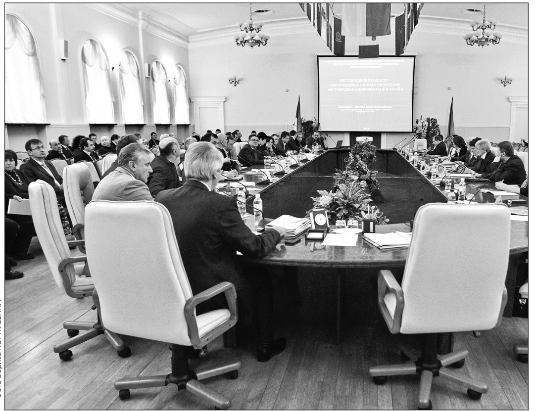
Містобудівний кадастр буде розміщений у вільному доступі в мережі Інтернет і усі охочі зможуть отримати вичерпну інформацію про містобудівні умови та обмеження для конкретних ділянок Києва

“Наприклад, до міської влади звернувся забудовник з пропозицією спорудити на конкретній земельній ділянці житловий будинок чи торговельний центр. А на цій території є необхідність зведення навчального закладу чи полклініки. За