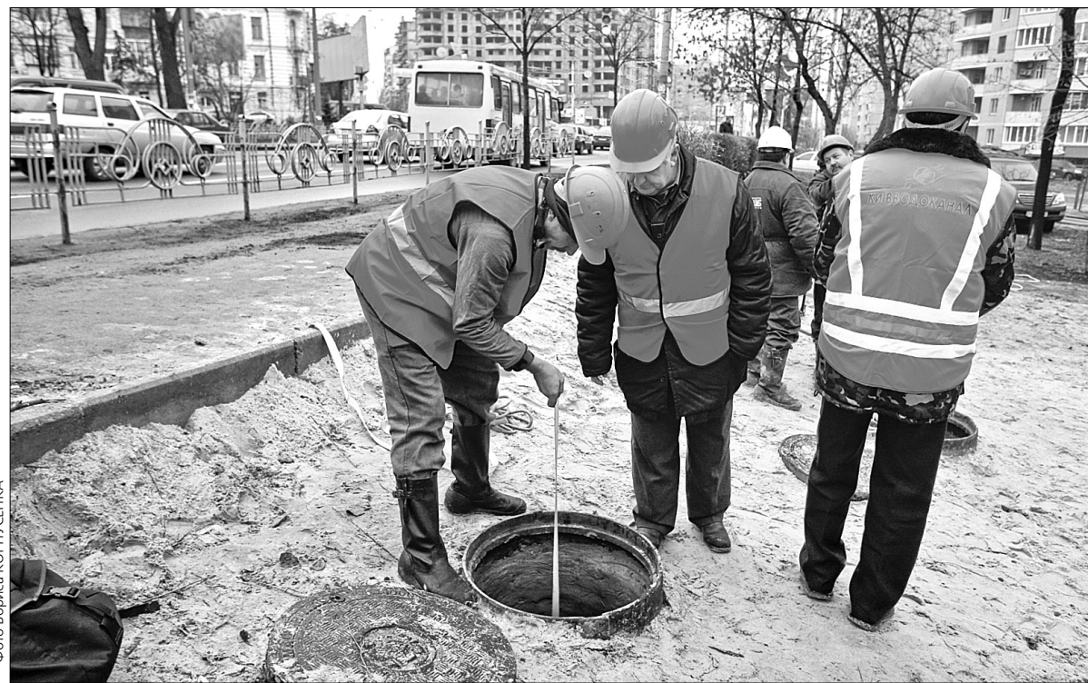
Щодня аварійні бригади Київводоканалу ліквідувають у середньому 40 засмічень каналізаційних мереж

Значну роль у збереженні довкілля столиці, а особливо її водного фонду, відіграє Управління екологічного нагляду ПАТ "АК "Київводоканал". Саме цей підрозділ компанії контролює дотримання Правил приймання стічних вод у систему каналізації Києва з боку підприємств та організації міста та моніторить хімічний склад рідини. Про це та інше йшлося під час традиційного круглого столу. Фахівці також обговорювали проблеми, які постають перед управлінням, і те, яким чином можна зменшити рівень забруднення київських водойм.