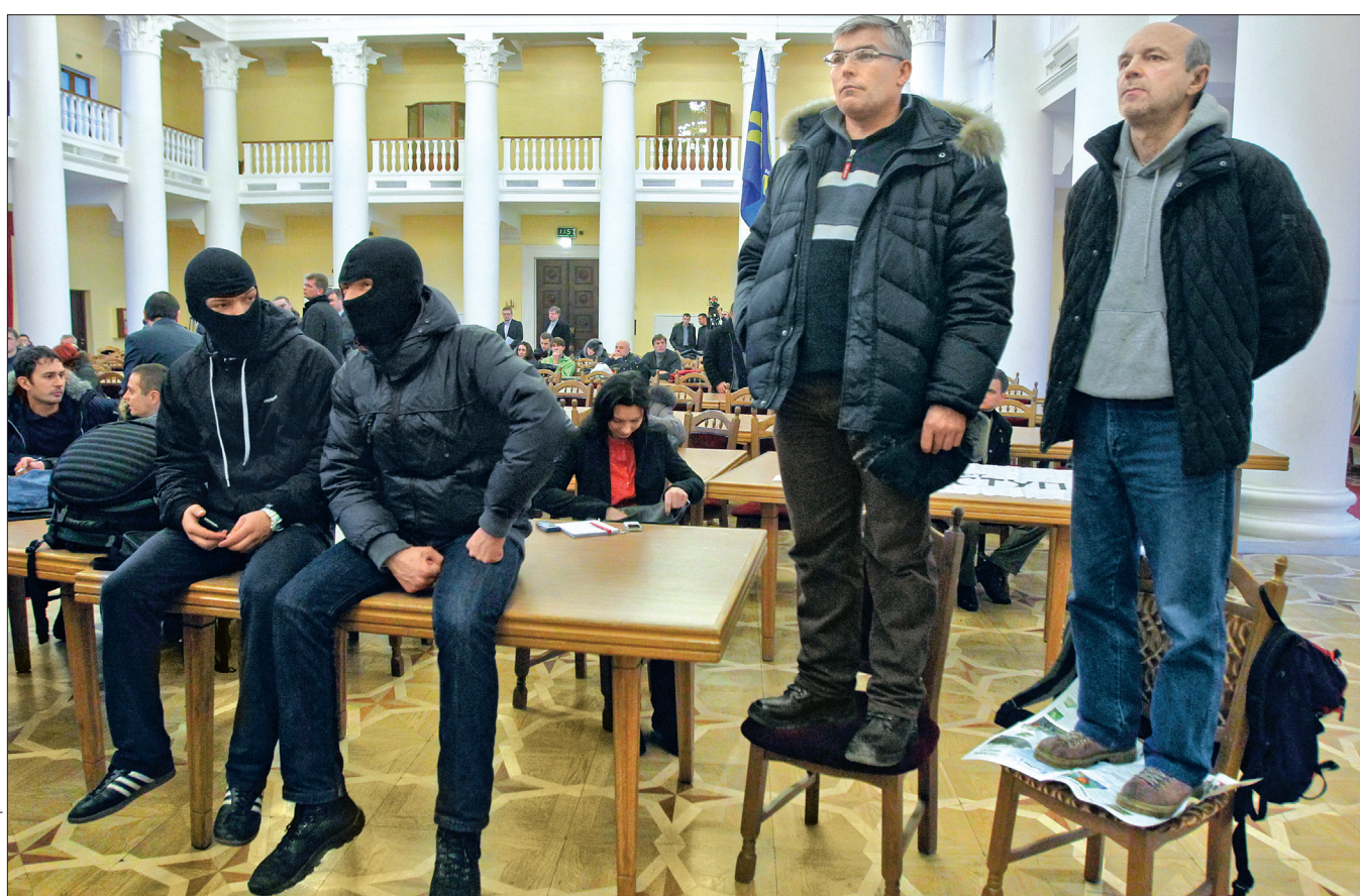
Учора пленарному засіданню Київської ради, на якому мали прийняти бюджет міста, завадив внутрішній та зовнішній штурм адмінприміщення опозиційними силами, які вимагали допустити багаточисельну публіку до сесійної зали