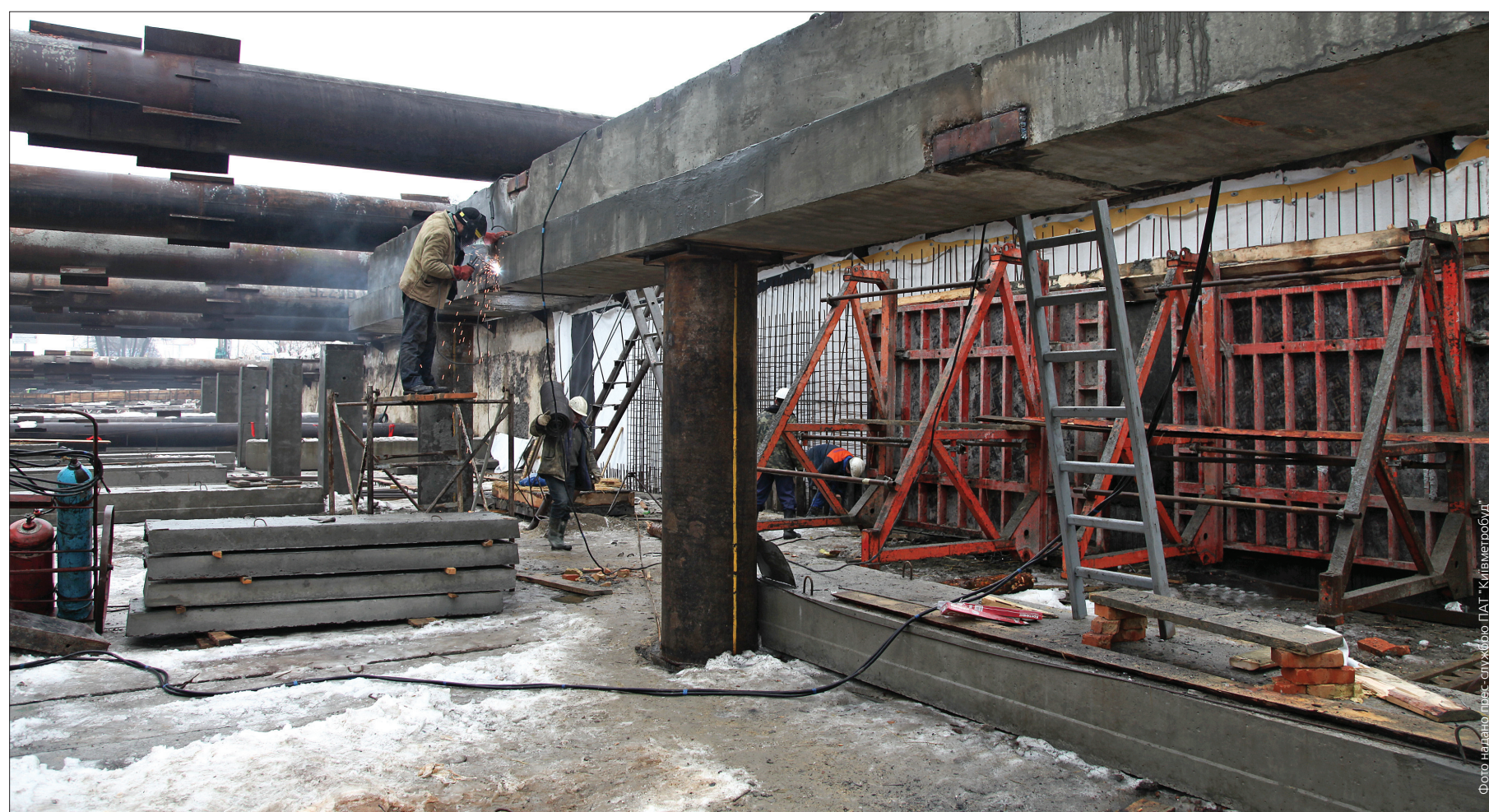
Нині столичні метробудівці готуються до завершального етапу спорудження станції метро "Теремки"

Метробудівці завершили проходку перегінних тунелів, тривають роботи на спорудженні вестибюля, тягової підстанції