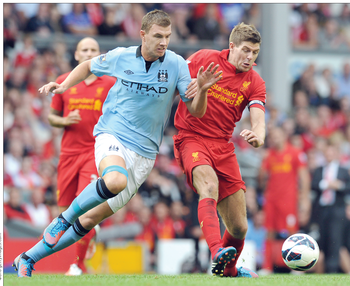
Нападник "Манчестер Сіті" Едін Джеко (праворуч) у боротьбі проти капітана "Ліверпуля" Стівена Джеррарда

В англійській Прем'єр-лізі відбулися матчі 25 туру. В Манчестері друга команда першості клуб "Сіті" приймала на своєму полі міцного середняка "Ліверпуль". Зустріч пройшла у видовищній непоступливій боротьбі і завершилася бойовою нічиєю з рахунком 2:2. На голи гравців "Манчестер Сіті" Едіна Джеко та Серхіо Агуерро мерсисайдці відповіли точними ударами Данієля Старріджа та Стівена Джеррарда.