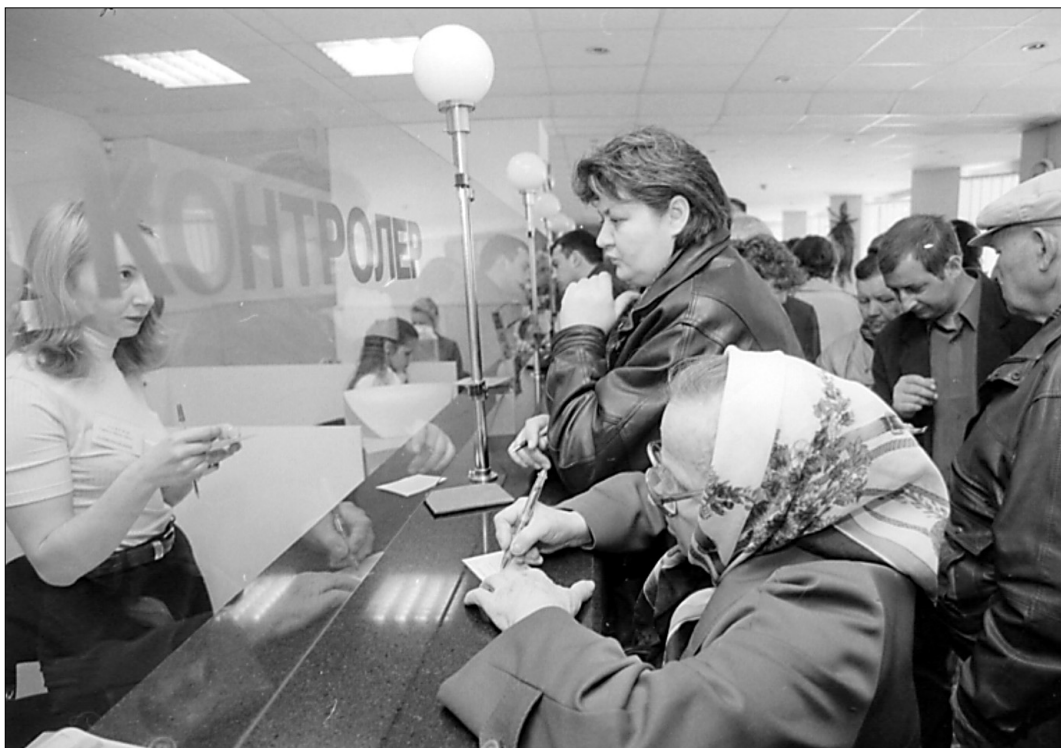
За обслуговування помешкань столичні мешканці протягом минулого року платили справно та стабільно

За словами директора ГІОЦ, торік загальний рівень заборгованості у місті значно зменшився.