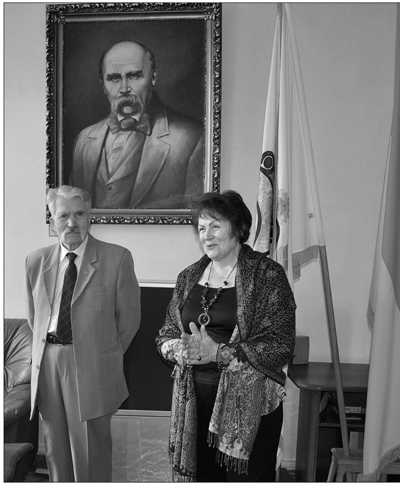
У гостях у вихованців ліцею побував Герой України Левко Лук'яненко

У рамках навчального процесу реалізується програма "Обдарованість", свідченням ефективності якої є 100% вступ випускників до найбільш престижних ВНЗ України (близько 80% вихованців ліцею стають студентами Київського національного університету імені Тараса Шевченка) й університетів світу (Франції, США, Південної Кореї, РФ, Німеччини, Італії, Польщі, Великобританії, Чехії тощо). Ліцейці щороку перемагають на III, IV етапах Всеукраїнських учнівських олімпіад (90% вихованців — переможці районних, 50% — міських, 5–10% — всеукраїнських) та на II, III етапах конкурсу-