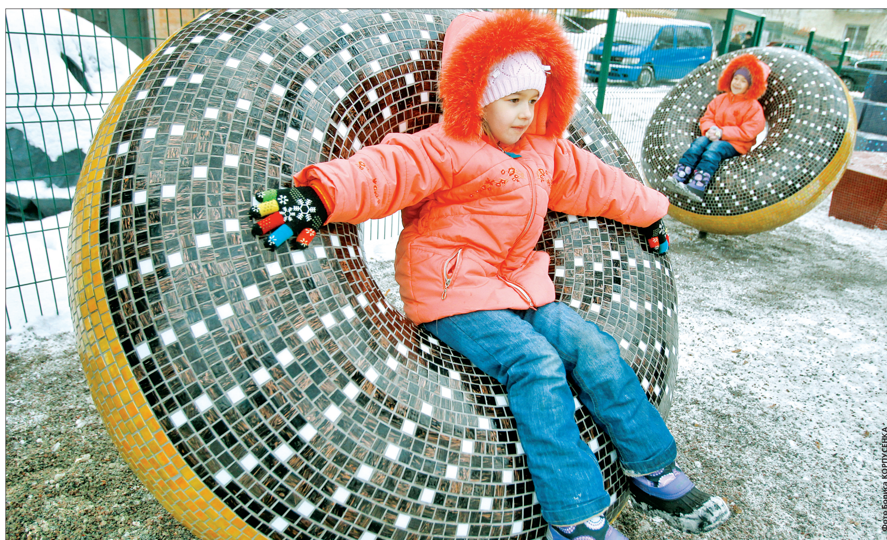
Майданчик візуально розділений на два "світи" — Країну Тіні та Країну Процвітання. Маленькі кияни практично одразу обирали його другу частину

На першому в історії країни інтерактивному майданчику малеча не лише розважатиметься, а й отримуватиме економічні знання