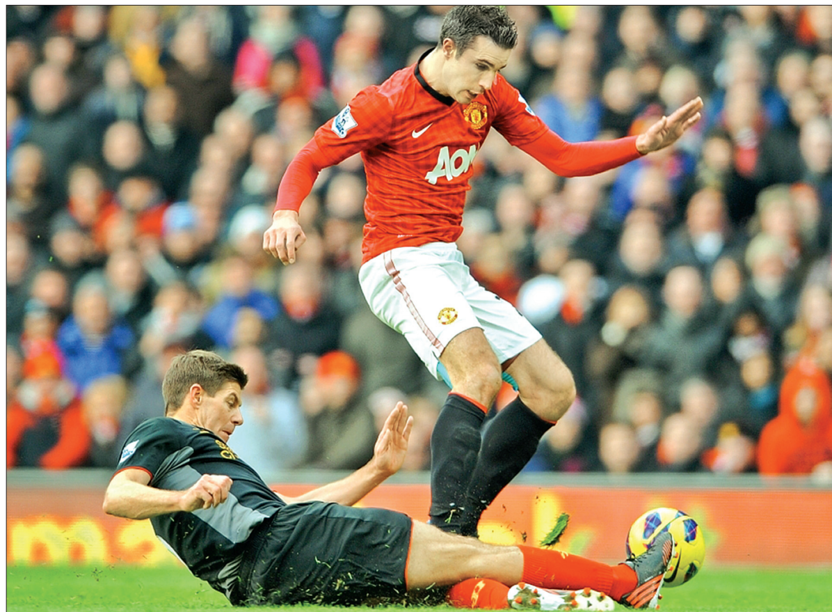
Капітан "Ліверпуля" Стівен Джерард (у чорній формі) не зміг завадити форварду "Манчестер Юнайтед" Робіну ван Персі (у червоній формі) відкрити рахунок у матчі

Цими вихідними в англійській першості з футболу відбулися ігри 22 туру. Лідери чемпіонату здобули досить складні перемоги у боротьбі проти принципових суперників. "Манчестер Юнайтед" виявився сильнішим у так званому "Червоному дербі" у матчі проти "Ліверпуля" — 2:1. Не менш цікаве протистояння відбулося в Лондоні, де місцевий "Арсенал" на рівних протистояв "Манчестер Сіті", але кілька помилок у захисті не дозволили господарям здобути навіть нічию. У підсумку — 2:0 на користь гостей.