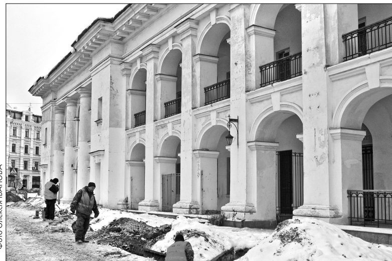
Днями питання збереження Гостинного двору розглядали під час слухань у парламентському Комітеті з питань культури і духовності

Як зазначив перший заступник міністра культури України Юрій Богуцький, під час прийняття відповідної постанови в урядовців не було підстав не довіряти результатам дослідження наукової установи. "Ті проблеми, які виникли, з'явилися великою мірою через непоінформованість, відсутність дієвого, живого діалогу між тими, хто приймав рішення, вносили пропозиції, і членами громадських об'єднань, які вбювають за охорону культурної спадщини. Ми