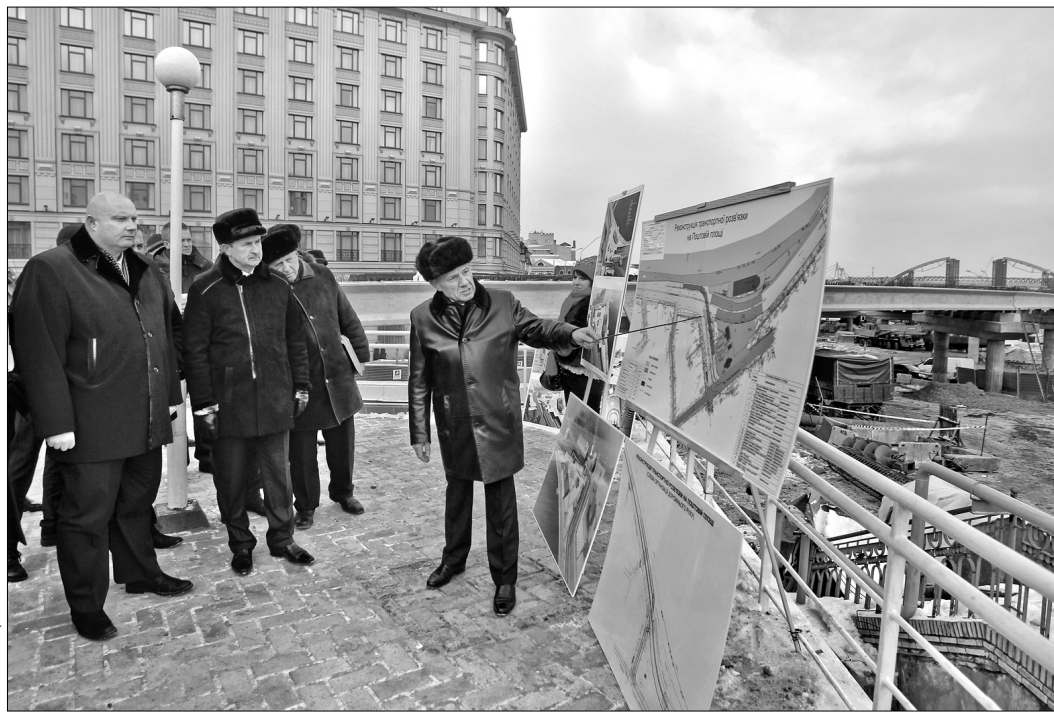
Днями з процесом реконструкції Поштової площі ознайомилися міністр регіонального розвитку, будівництва та ЖКГ України Геннадій Темник та голова КМДА Олександр Попов

Щоб встигнути у зазначені терміни, роботи на об'єкті тривають цілодобово. "Бригади працю-