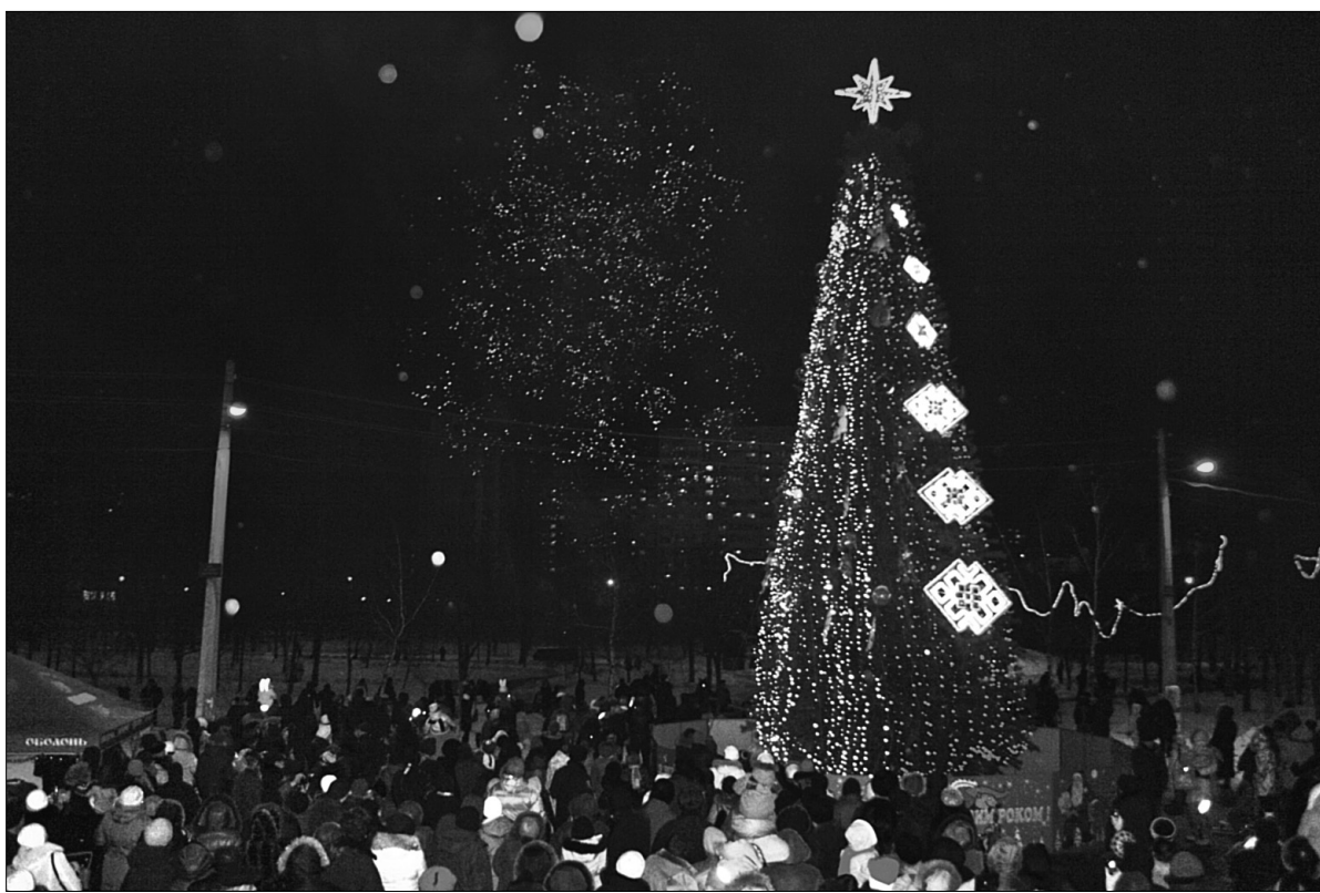
На Дарниці головну ялинку району встановили в парку імені Воїнів-інтернаціоналістів

За його словами, торік вперше на Дарниці запровадили практику засвічення ялинок у житлових мікрорайонах. Кожне таке дійство відбувається за участі народних колективів та артистів. "Це сподобалося нашим мешканцям, тож нині такі урочисті відкриття ялинок пройдуть ще у кількох мікрорайонах Дарниці. Наприклад, учора ми засвітили новорічне дерево у мікрорайоні "Бортничі", завтра — о 16.00 в мікрорайоні "Рембаза" на вул. Бориспільська, 32. Цього ж дня о 18.00 замерехтіть пухнаста красуня поряд з Будинком культури "Дарниця", що на вул. Княжий Затон, 18. Післязавтра ялинка засяє у приватному житловому мікрорайоні "Осокорки", — розповів "Хрещатику" голова Дарницької РДА ●