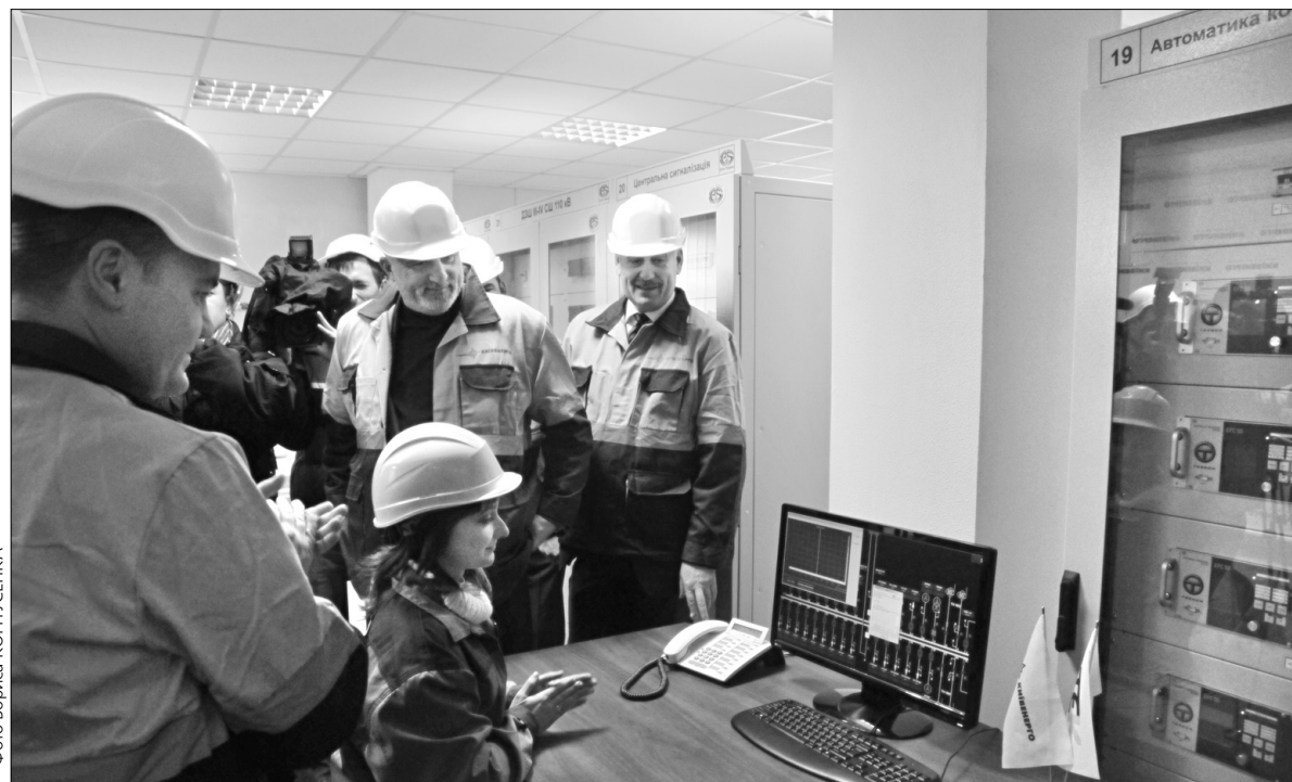
Відчора енергопостачання у центральну частину міста здійснюється із нової підстанції "Московська"