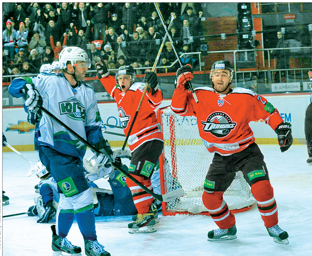
Донецький "Донбас" здобув четверту перемогу поспіль у Континентальній хокейній лізі

У середу в Континентальній хокейній лізі після десятиденної перерви, пов'язаної з виступами національних збірних, поновилися змагання. Єдиний представник України у цьому турнірі донецький "Донбас" на своєму майданчику приймав хантимансійську "Югру". Матч для вітчизняного клубу видався надто складним. Двічі поступаючись у рахунку, підопічні Юліуса Шуплера все ж таки спромоглися переломити хід поєдинку і перемогти суперника — 4:2. Цей успіх став для донецчан четвертим поспіль у КХЛ, завдяки йому вони піднялися на 6 сходинку у Західній конференції.