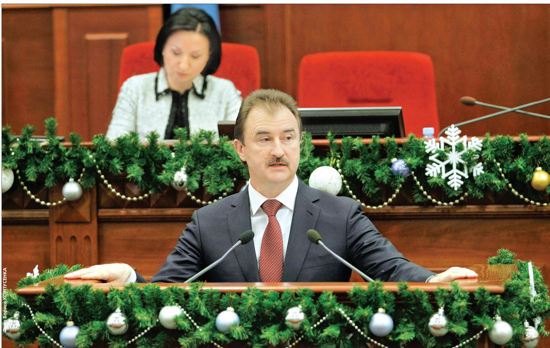
Голова КМДА Олександр Попов закликав депутатів не приймати бюджет міста на 2013 рік

Депутати міськради підтримали пропозицію Олександра Попова відтермінувати прийняття столичного бюджету-2013