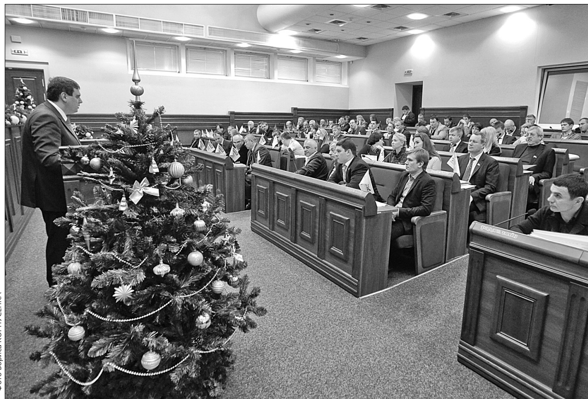
Якщо до кінця цього року новий бюджет столиці розроблений не буде, то Київ житиме з фіндокументом 2012 року

Відтак для вирішення всіх інших нагальних потреб залишилося тільки 221 млн грн. Мається на увазі реконструкція просп. Петра Григоренка, будівництво розв'язки на правобережних підходах до Південного мосту з і'здами з вул. Саперно-Слобідської на Столичне шосе, ліквідація наслідків п'яти аварій на об'єктах