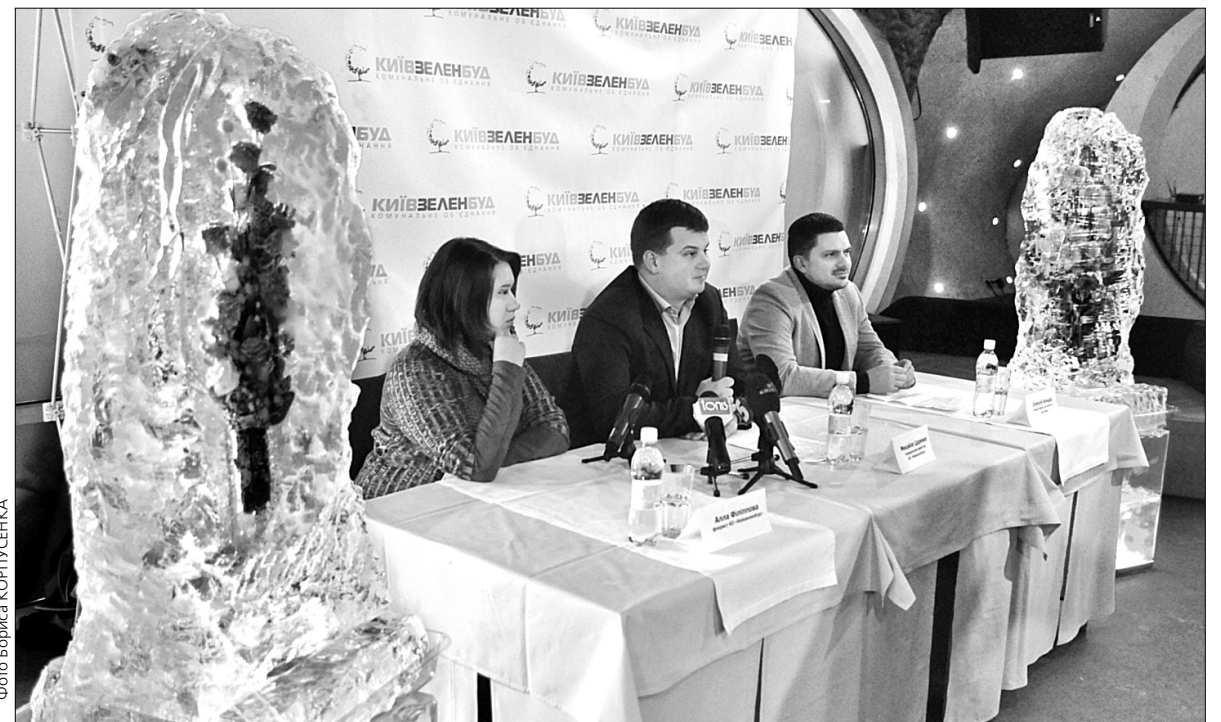
Всі охочі зможуть ознайомитися з льодовими композиціями з 2 до 27 січня на Співочому полі

Особливі уваги заслуговує технологія створення композицій. Живі квіти встановлюють в спеціальні крию-блоки, і через спеціальну трубу до них повільно надходить вода. Таким чином лід наростає поступово і без помітних прошарків. А для того, щоб досягнути максимальної прозорості скульптури, використовували виключно дистильова-