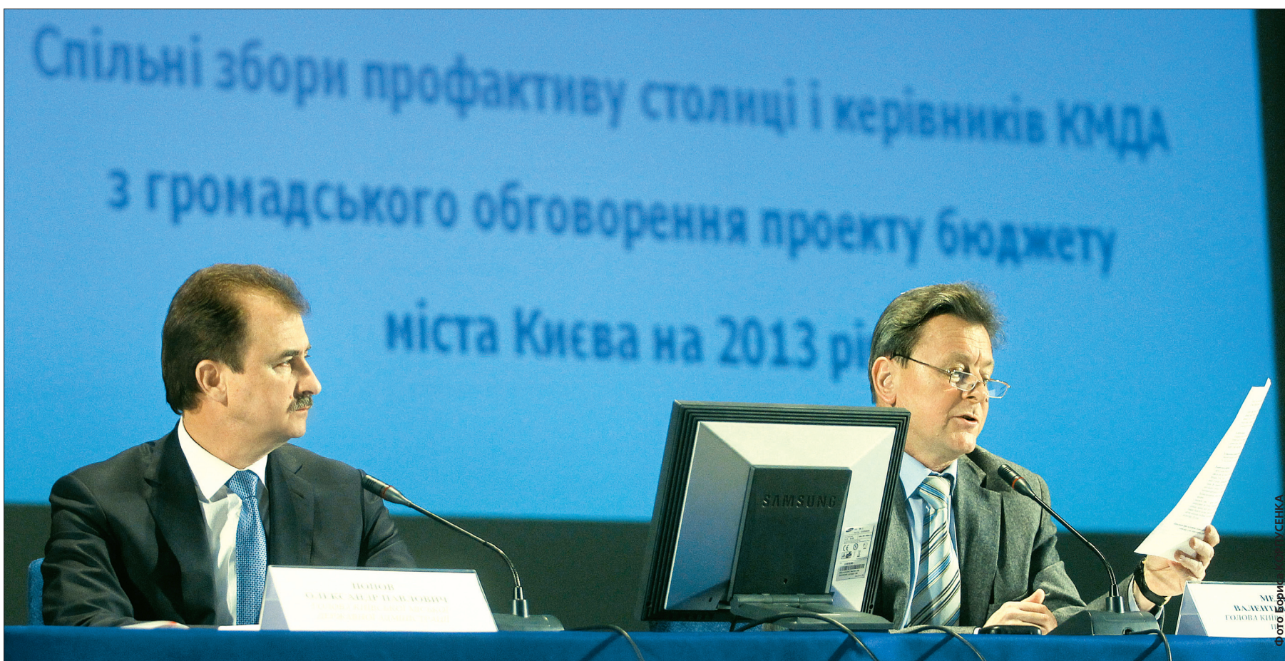
Днями 1,5 тисячі представників первинних профспілок столиці, керівництво КМДА, народні депутати України та депутати Київради обговорили ситуацію з фінансовим забезпеченням міста

Громадськість міста звернулася до керівництва держави з проханням внести зміни до головного кошторису на 2013 рік