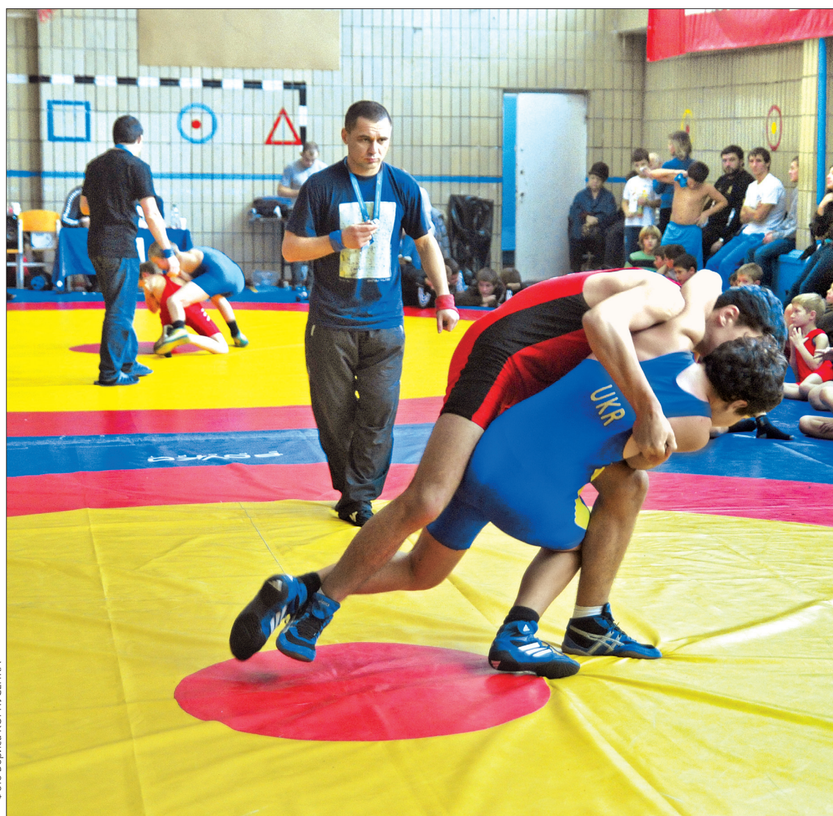
У змаганнях взяли участь понад 250 юних борців віком від 6 до 16 років зі столиці, Київської області та Чернігова

У приміщенні спортивного залу спеціалізованої школи № 269 відбувся традиційний відкритий турнір з греко-римської боротьби серед вихованців ДЮСШ "Школа боротьби". Змагання зібрала понад 250 учасників віком від 6 до 16 років зі столиці, Київської області та Чернігова. Приемною несподіванкою для всіх став візит першого олімпійського чемпіона незалежної України В'ячеслава Олійника, а також призера Олімпіади в Пекіні та дворазового чемпіона Європи з греко-римської боротьби Армена Варданяна.