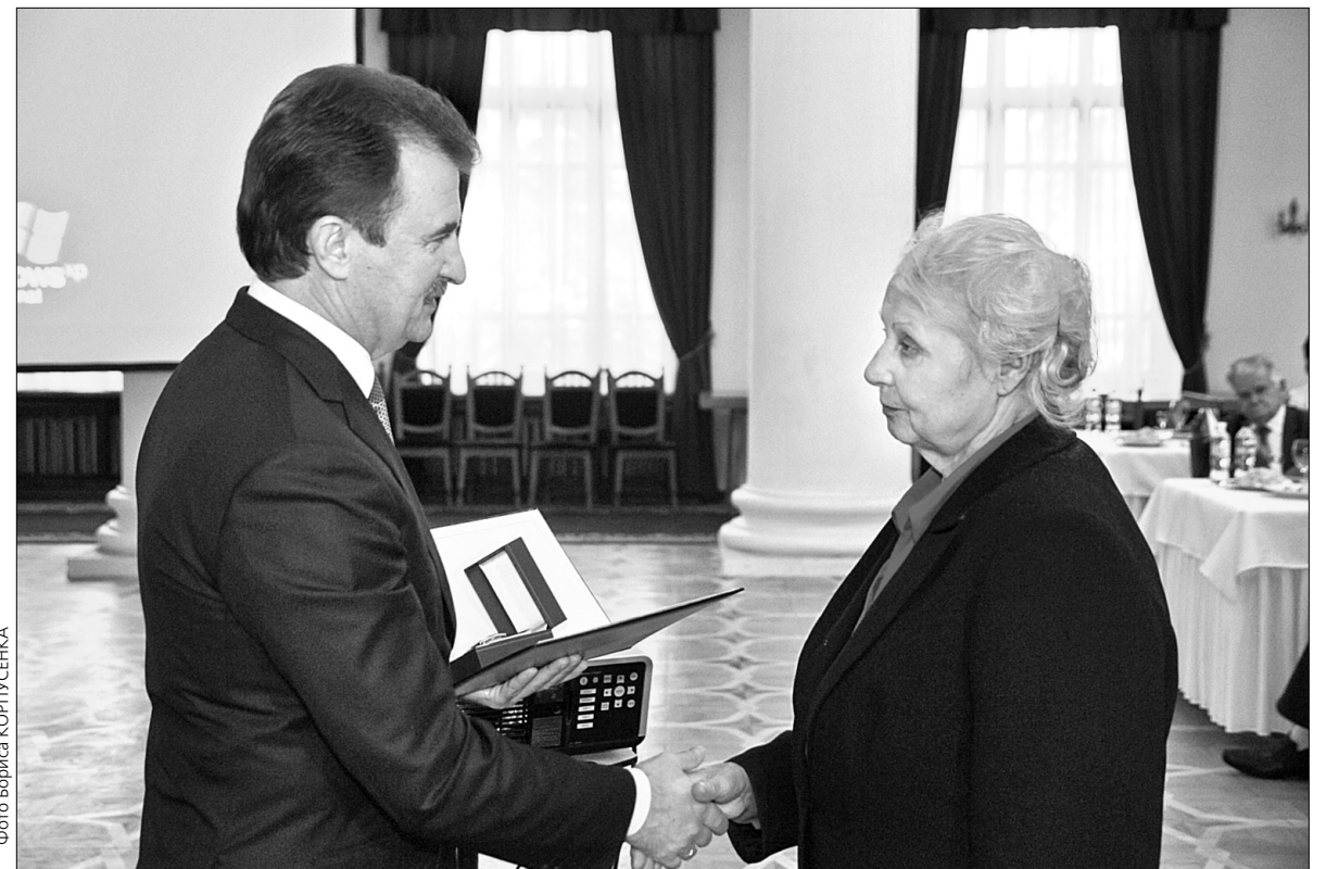
Голова КМДА Олександр Попов вручає чорнобильцям 39 повідомлень про отримання квартир, грамоти та пам'ятні медалі

Очільник міськдержадміністрації подякував присутнім за здійснений ними подвиг у 1986 році та активну життєву позицію сьогодні і побажав чорнобильцям здоров'я та благополуччя. "Ціною власного здоров'я і