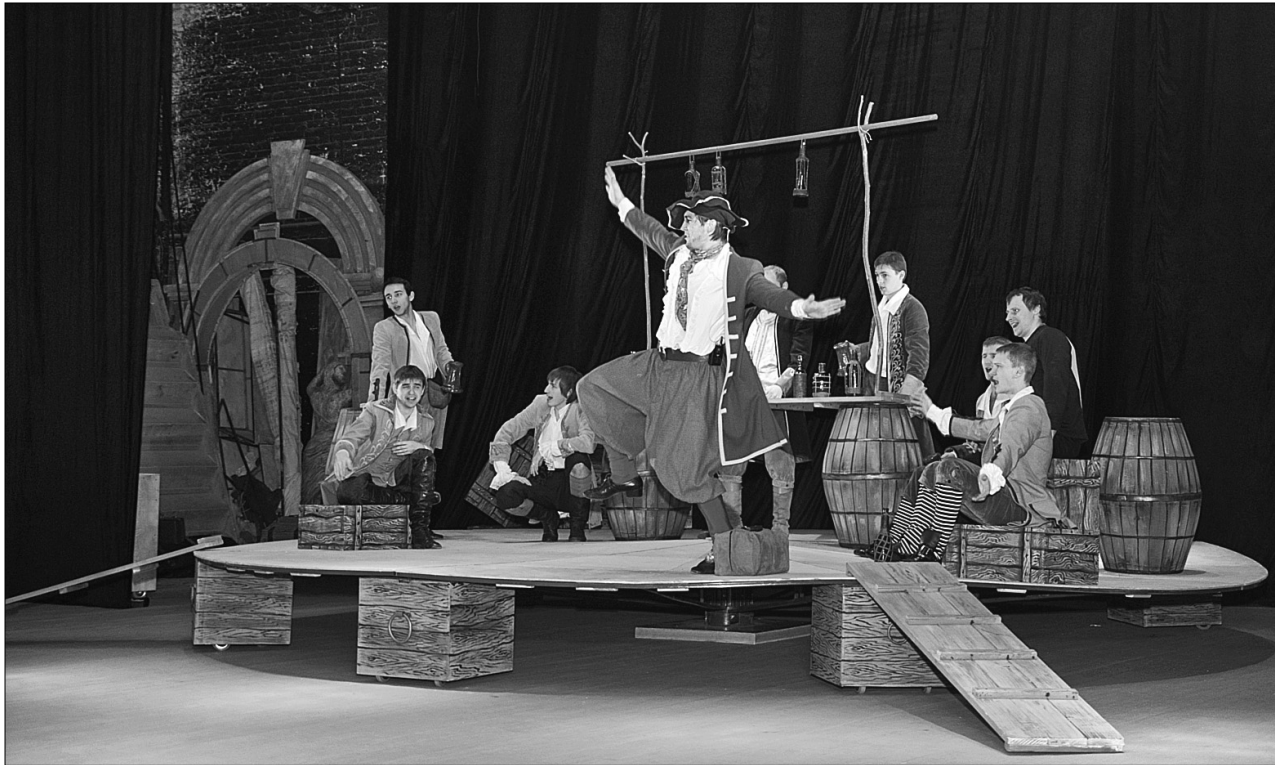
У творців "Острова скарбів" є чимало родзинок, які притаманні лише цьому музичному проекту, і якщо порівнювати однойменний мультфільм з новим мюзиклом, то останній обіцяє бути значно яскравішим та динамічнішим

Київський національний академічний театр оперети готує надзвичайний подарунок до Дня Святого Миколая — дитячий мюзикл "Острів скарбів", прем'єра якого відбудеться сьогодні — 19 грудня. Маленькі відвідувачі зможуть оцінити нову музичну виставу, де веселі пригоди поєднуються з пошуком власного "я".