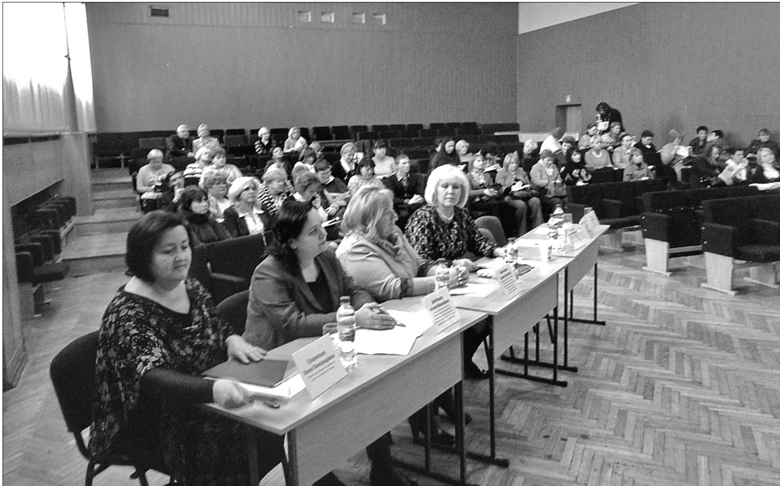
У приміщенні гімназії міжнародних відносин № 323 відбувся міський науково-практичний семінар для керівників навчальних закладів Києва

Цій темі був присвячений семінар для директорів столичних шкіл