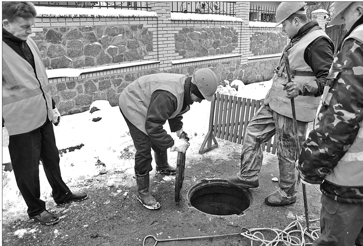
У присутності журналістів працівники компанії намагалися відключити нелегалів від водопостачання

Наразі розрахунковий департамент "Київводоканалу" проводить роботи з виявлення несанкціонованих під'єднань до водопровідних мереж. Вже вдалося знайти декілька сотень порушників