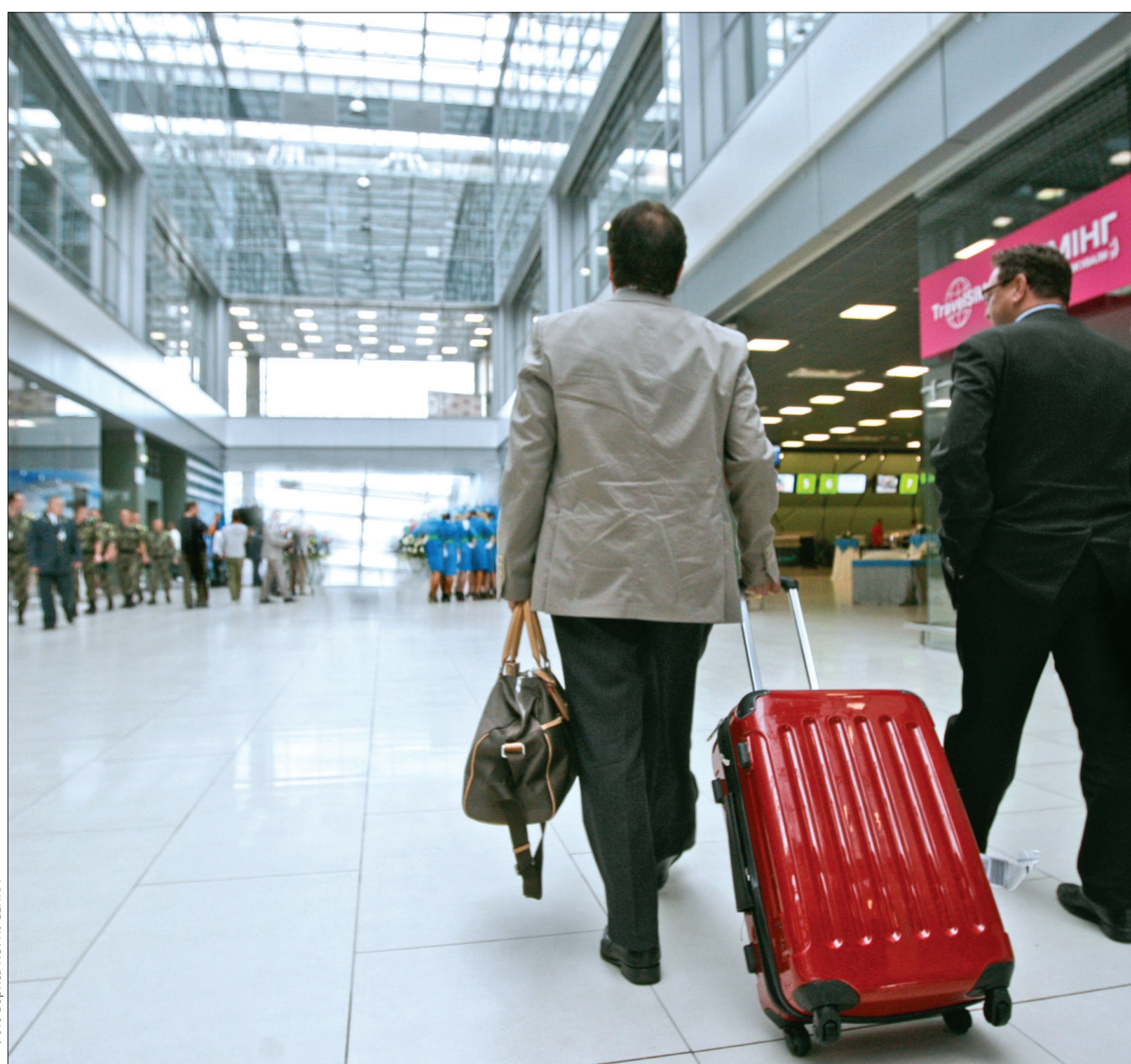
До 2025 року Київ має стати центром ділового туризму в Східній Європі

Важливо, що власний стратегічний "туристичний" документ столиця вже отримала — план розвитку галузі до 2025 року в листопаді затвердила Київрада. Згідно з програмою, місто позиціонуватимуть як центр слов'янської культури. Крім того, паралельно розвиватимуться ще шість напрямків: козацтво, духов-