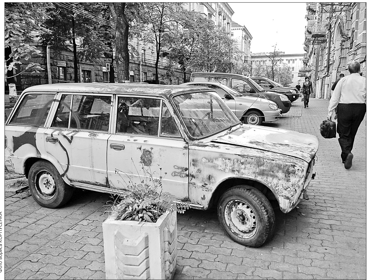
ГУ контролю за благоустроєм КМДА ініціює кампанію з прибирання покинутих авто зі столичних вулиць

Міську кампанію по прибиранню старих авто з вулиць та прибудинкових територій ініціює ГУ контролю за благоустроєм КМДА. "Демонтаж таких авто періодично проводиться нашим комунальним підприємством, втім є суттєве зауваження — ми прибираємо машини, які не ма-