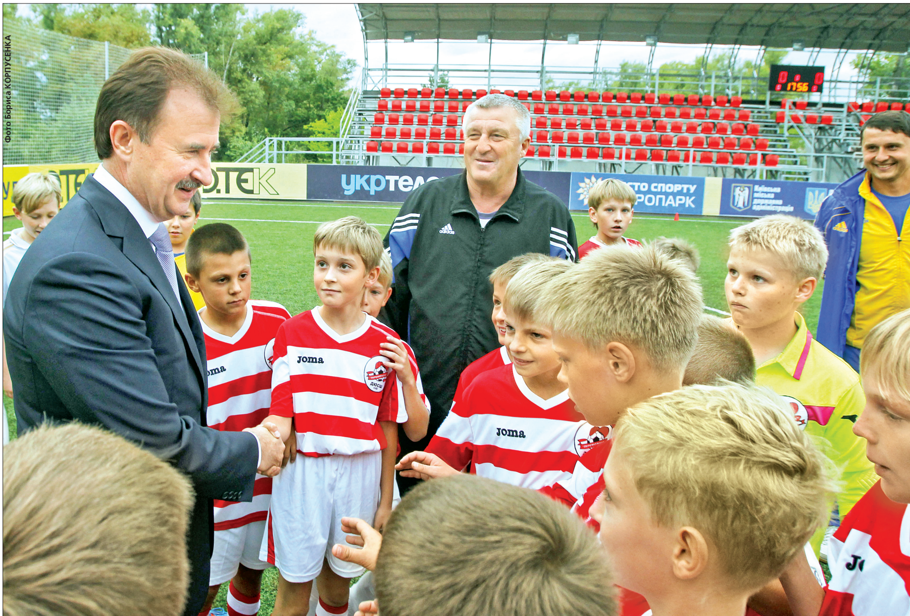
Під час відвідин спортивних об'єктів голова КМДА Олександр Попов поспілкувався з майбутніми чемпіонами

Лише цього року в парку Дружби народів з'явилось 37 нових тренувальних майданчиків