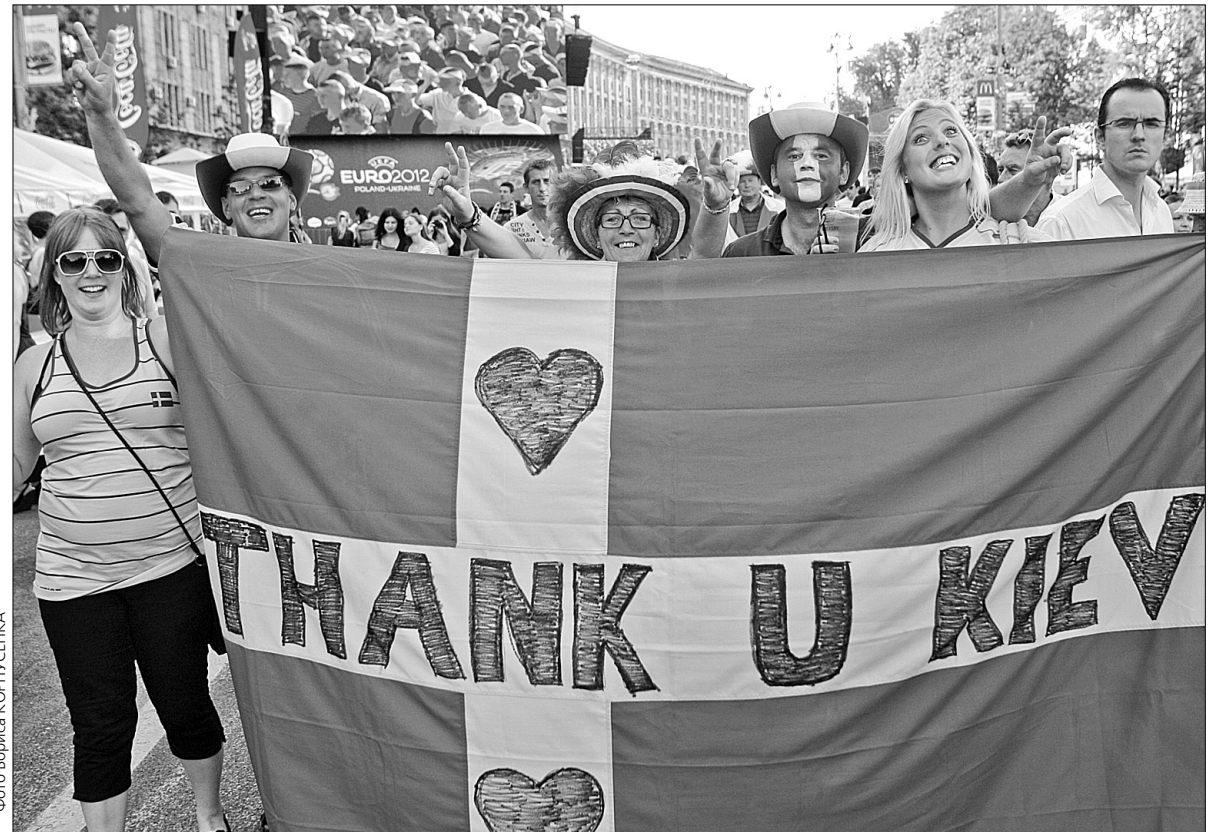
Понад 80% туристів приїхали до України вперше, але кожен третій гість має намір відвідати нашу державу знову

"Відповідно до опрацьованих даних, середньостатистичний відвідувач футбольного чемпіонату мав вік від 30 до 39 років. Під час свого перебування іноземці витратили в середньому від 200 до 400 євро. Більшість туристів, а це понад 80%, приїхали до України вперше, але кожен третій гість має намір повернутись сюди знову", —