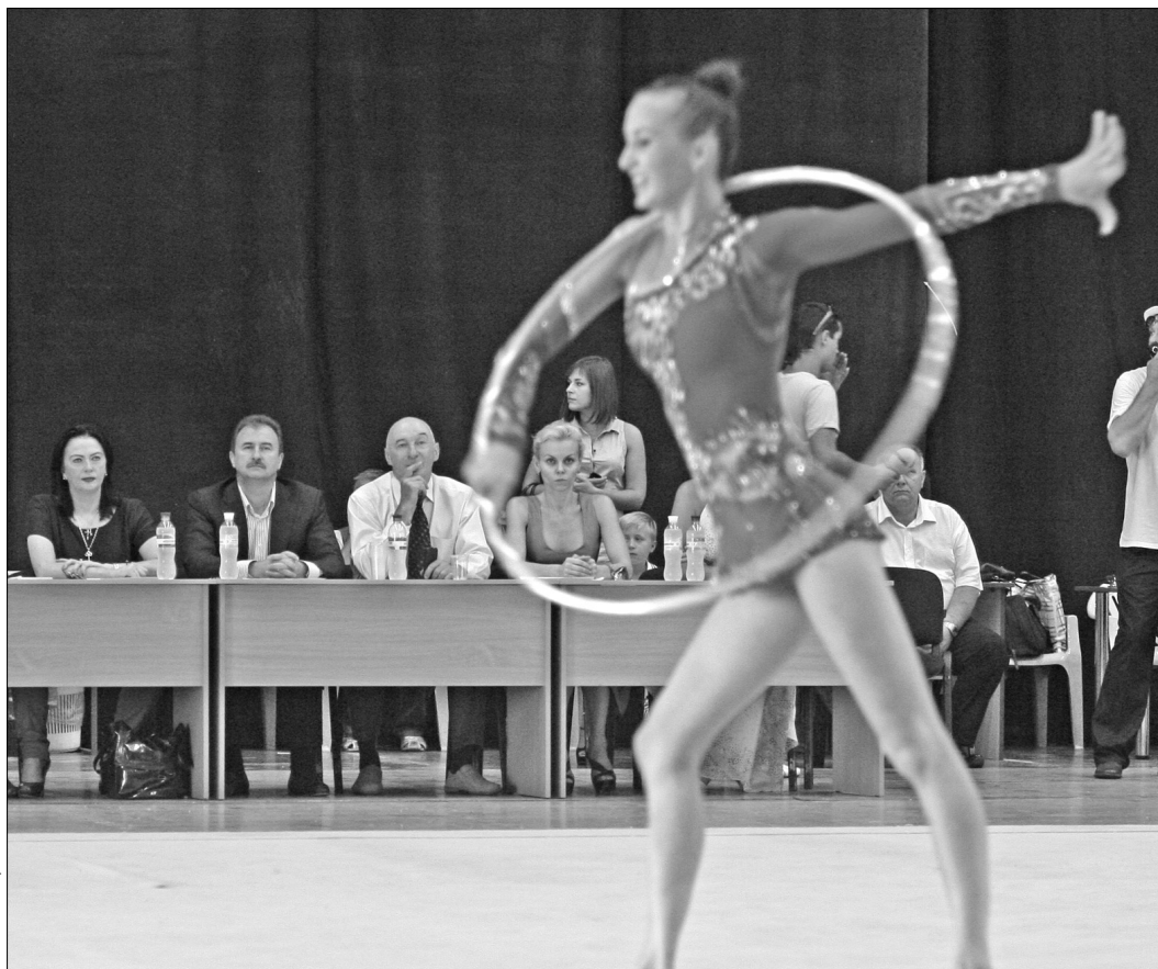
Вже наступного тижня українські гімнастки покажуть свою майстерність на спортивних майданчиках Олімпіади у Лондоні

Він також поділився планами щодо будівництва нового центру художньої гімнастики у Києві. Ймовірно, що такий заклад запрацює уже