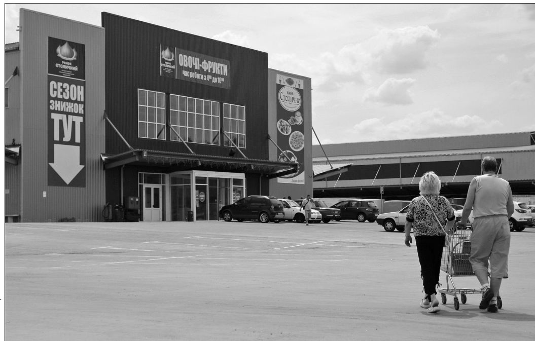
На оптовому ринку "Столичний" запрацюють павільйони "Молоко і ковбасні вироби" та "Риба і м'ясо"

В центральній частині павільйону "Риба і м'я-