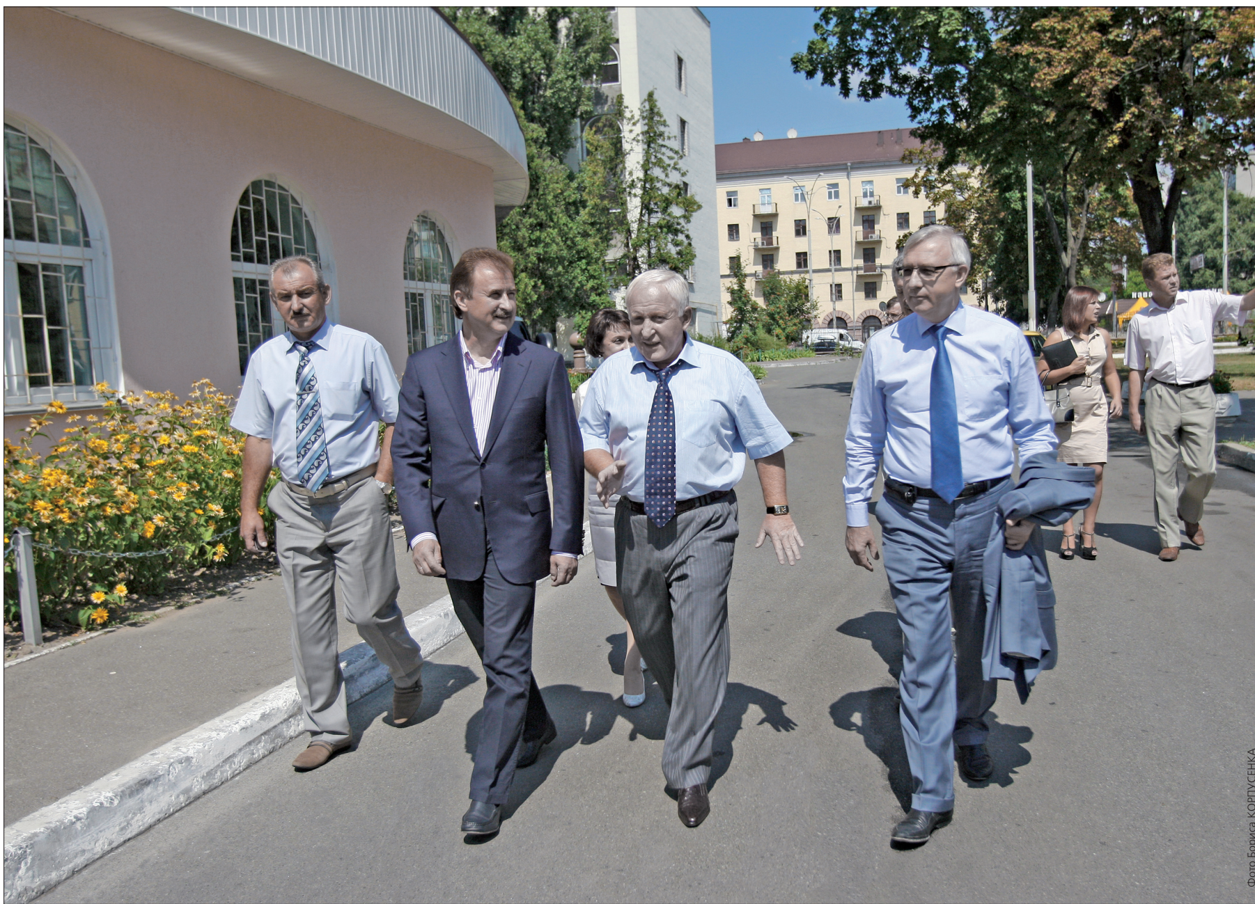
Вчора голова КМДА Олександр Попов ознайомився з досвідом забезпечення житлом працівників столичного пологового будинку №5

Столичні медики на власному прикладі показали, як будувати доступне житло. Міська влада обіцяє підтримати ініціативу