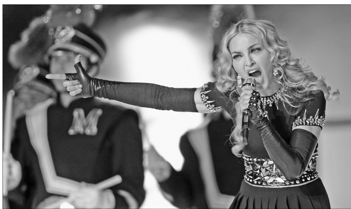
В рамках європейської частини туру MDNA співачка Мадонна виступить зі своїм яскравим шоу на НСК "Олімпійський"

На НСК "Олімпійський" сцену споруджують уже кілька днів. Мадонна подбала про здоров'я працівників: поряд зі сценою працюють кондиціонери і чергують медики. Стійкість сцени буде підтримувати міні-океан — в її опори заллють 27 500 літрів води.