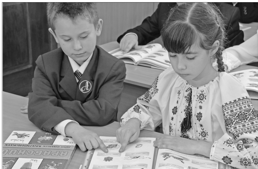
Учні гімназії № 290, окрім англійської та німецької, вивчають японську, корейську та арабську мови

4 та 5 серпня з 17.00 до 19.00 год. на Андріївському узвозі відбудуться виступи аматорських колективів Святошинського району. Так, 4 серпня свою творчість для киян та гостей столиці подарують: Народний хор української народної пісні "Надія" центру культури "Святошин" та вокальний ансамбль "Святошинські мелодії". А 5 серпня концертну програму проведуть: Народний вокальний ансамбль "Рідня" центру культури "Святошин" та хор ветеранів "Джерело". Нагадаємо, що, за дорученням голови КМДА Олександра Полова, щосуботи та щонеділі протягом червня-серпня цього року на Андріївському узвозі проведуться виступи творчих колективів районів столиці та Київського академічного драматичного театру на Подолі.