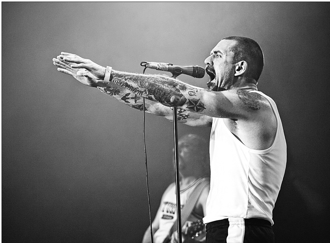
29 серпня фестиваль відкриє "Ляпис Трубецкой" з прем'єрою концертної програми "Робкор"

Ще один майданчик Open Stage продовжує діяти як денна та безкоштовна сцена "нової і молоді музики". Тут відбуватимуться презентації нових проектів відомих музикантів та виступи молодих артистів. Серед її учасників: Tinavie (RU), Sophie Villy (RU), Лаура і Марті Крісті