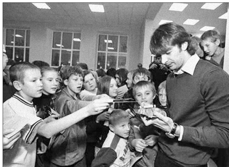
Вихованці навчального закладу мають змогу спілкуватися з відомими особистостями, що допомагає їм у подальшому виборі професії. Нещодавно їх гостем був футболіст Олександр Шовковський

До того ж, у навчальному закладі створено належну оздоровчу базу: тут є спортивний та тренажерний зали, стадіон, баскетбольний та волейбольний майданчики, футбол-