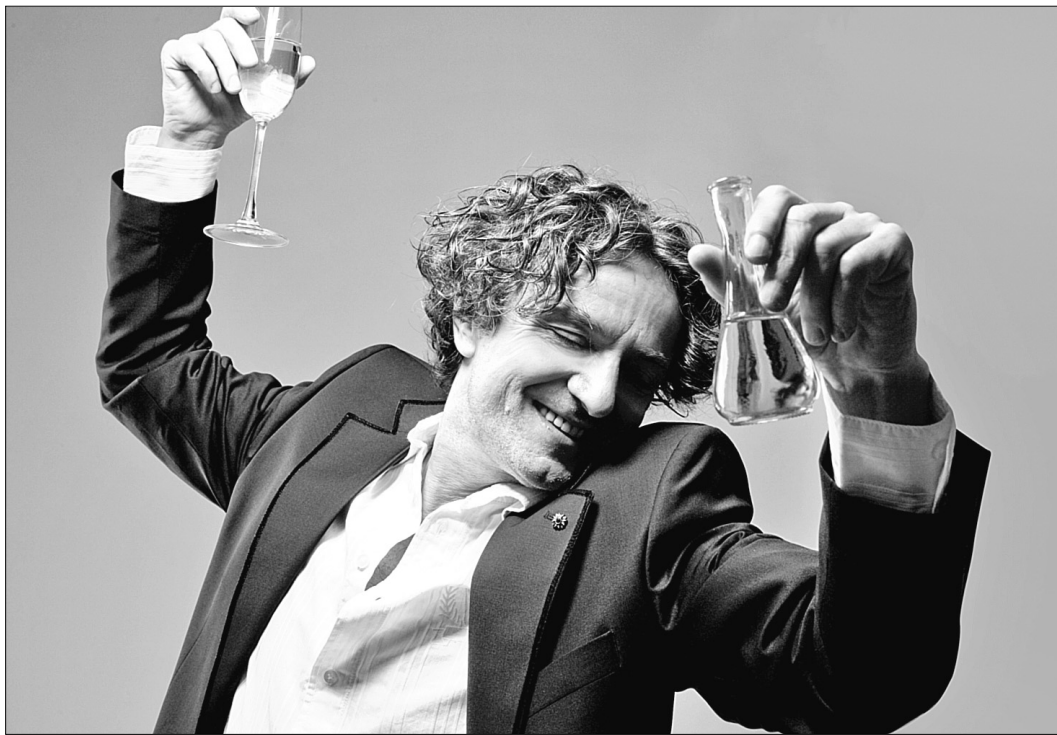
У супроводі "весільно-похоронного оркестру" Горан Брегович представить на "Джаз Коктебелі" альбом "Champaigne for Gypsies" ("Шампанське для циган")

Очікується, що щодня фестивалю відвідуватимуть 5–6 тисяч гостей. Для зручності туристів, що прибувають сюди на автомобілях, в Коктебелі введуть спеціальні умови організації дорожнього руху. На пляжі чергуватимуть додаткові матроси-рятувальники.