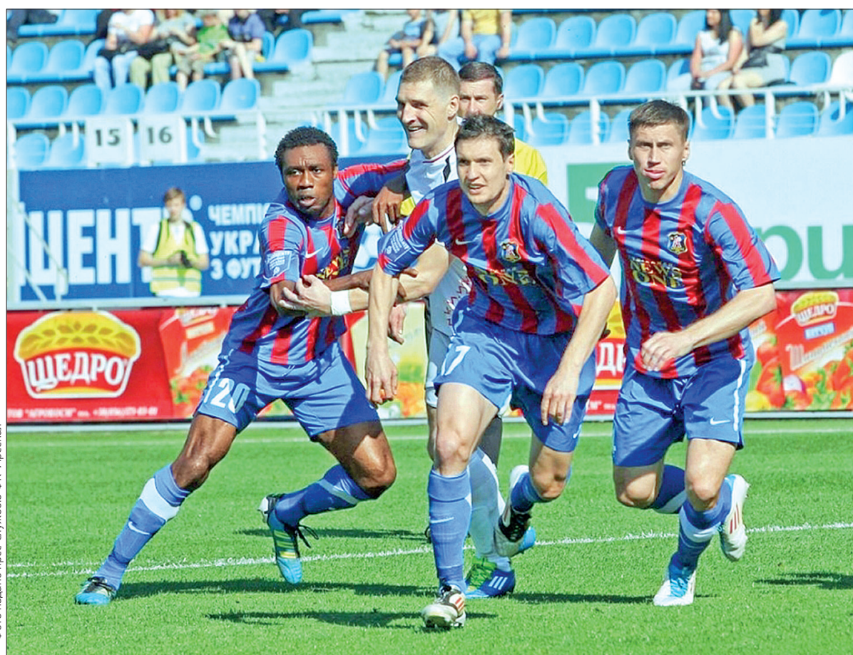
Гравці "Арсеналу" здобули першу перемогу у цьому сезоні