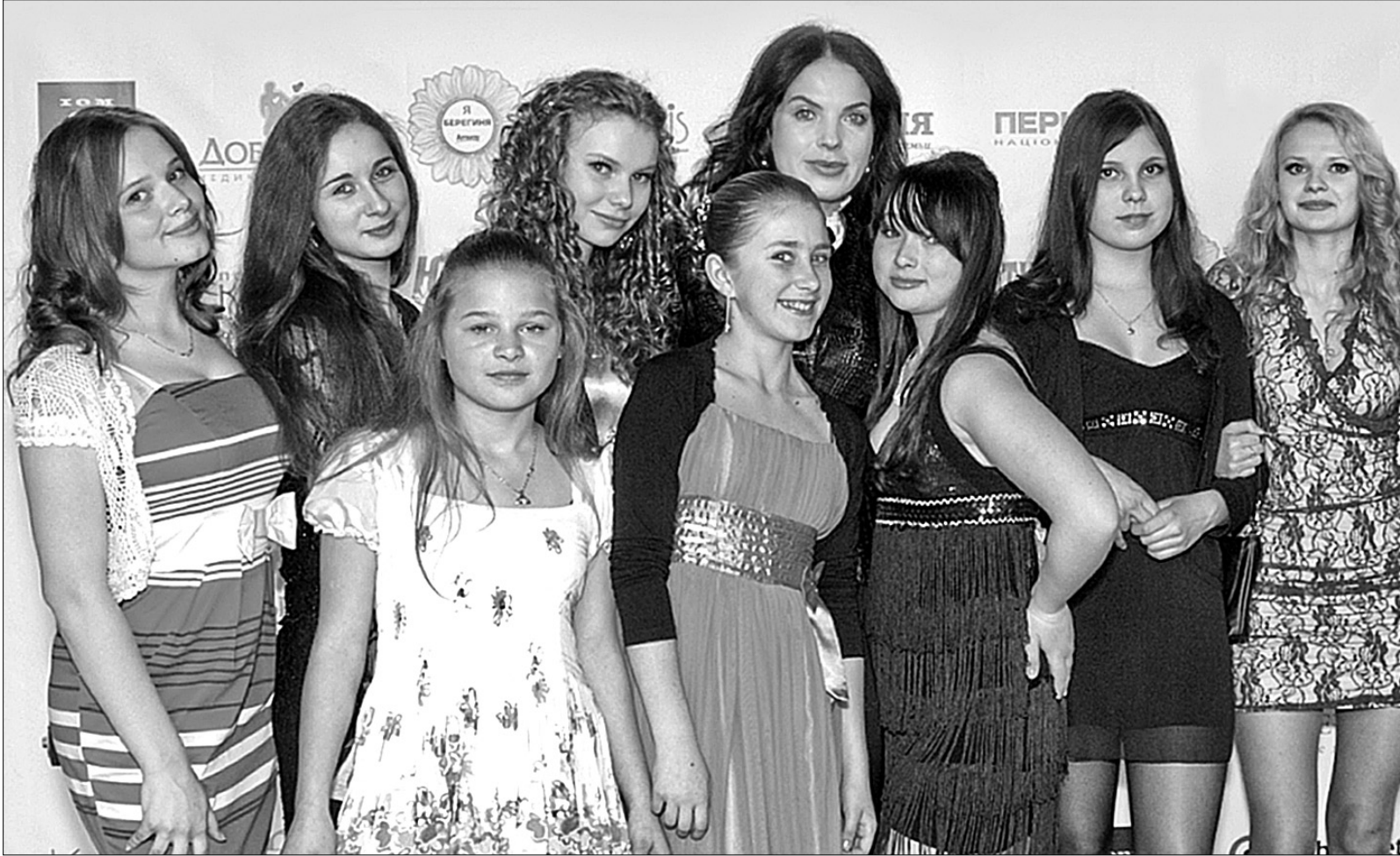
Учні школи-інтернату приймали участь у проекті "Я – Березиня" Всеукраїнського благодійного фонду "Талановиті діти – майбутнє України"

У навчальному закладі № 14 вихованці навчаються, живуть та активно розвиваються