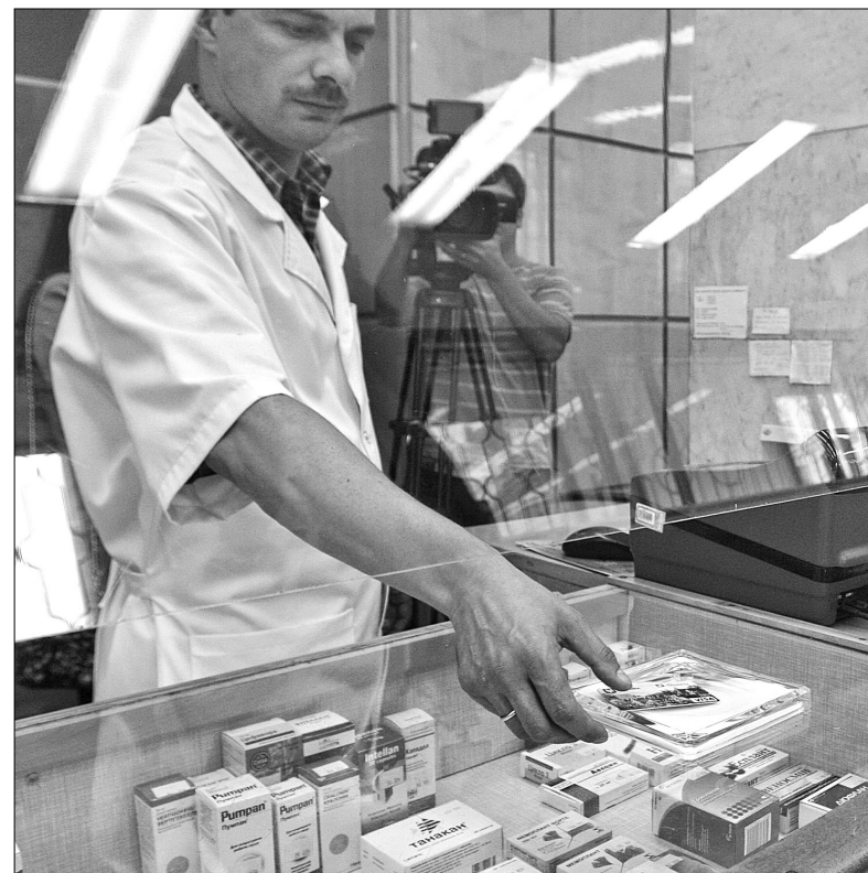
Власники “Картки киянина” отримують знижку до 30% на 52 види лікарських препаратів в мережі аптек “Фармація”

Зауважимо, з усіх питань, що стосуються реєстрації в системі “Кар-