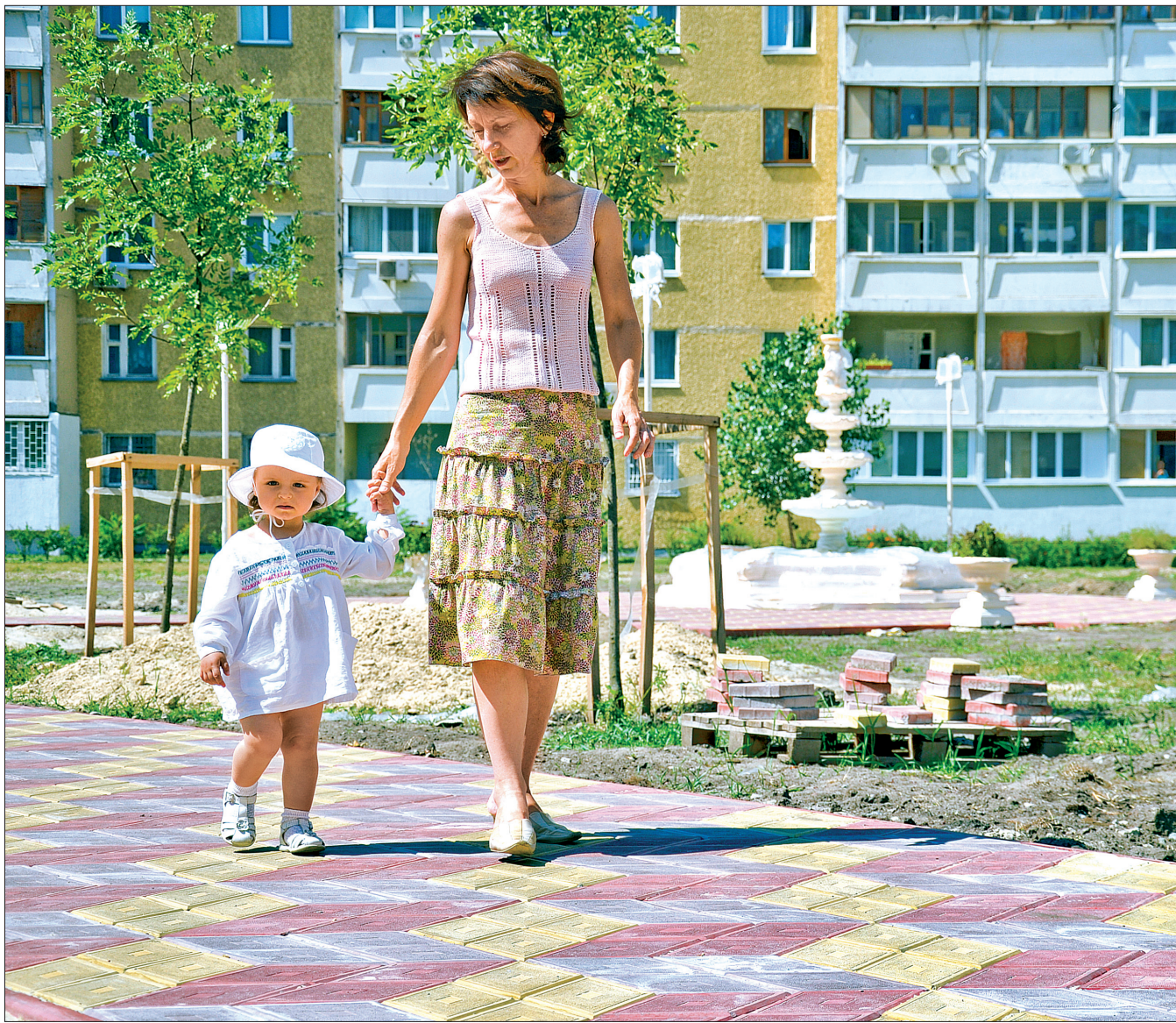
До Дня Незалежності мешканці будинків на проспекті Григоренка отримають новий сквер з фонтаном

красиві білі вази, в яких висаджено квіти та фітограви — м'яту та чебрець (рослини надали зі столичного ботанічного саду). До відкриття біля кожної вази з'являться таблички з назвами рослин. До речі, початок кожної пішохідної доріжки прикрасять шістьма вазами з живими квітами.