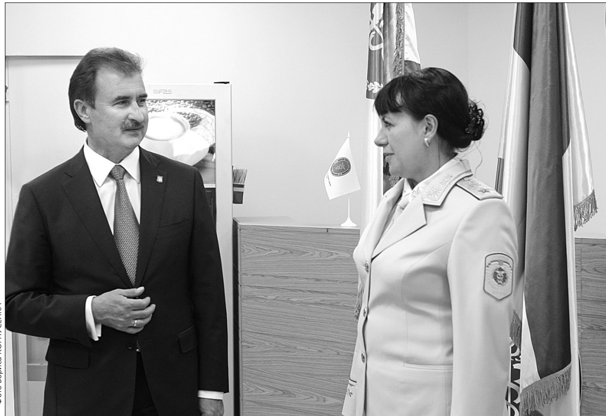
Голова КМДА Олександр Попов привітав податківців з професійним святом та відкриттям Центру з обслуговування платників податків для іноземних громадян

У нововідкритому центрі кожен іноземець, який зареєстрований у столиці, зможе отримати реєстраційний номер облікової картки, так званій ідентифікаційний номер. Сервісний центр знаходиться на першому поверсі Державної податкової адміністрації у м. Києві, що за адресою: вул. Шолуденка, 33/19. У ньому працює приймальня, відділ забезпечення доступу до публічної інформації та розгляду звернень громадян, канцелярія, сектор сертифікації ключів ЕЦП (електронного цифрового підпису) для подання електронної звітності та сучасна зала обслуговування платників податків, де розміщено шість діалогових вікон. Окрім того, іноземці зможуть скористатися послугами медичного кабінету та перукарнею. При вході у центр клієнтів зустрічатиме модератор, який володіє англійською мовою і зможе керувати відвідувача у потрібний відділ. Додамо, що центр