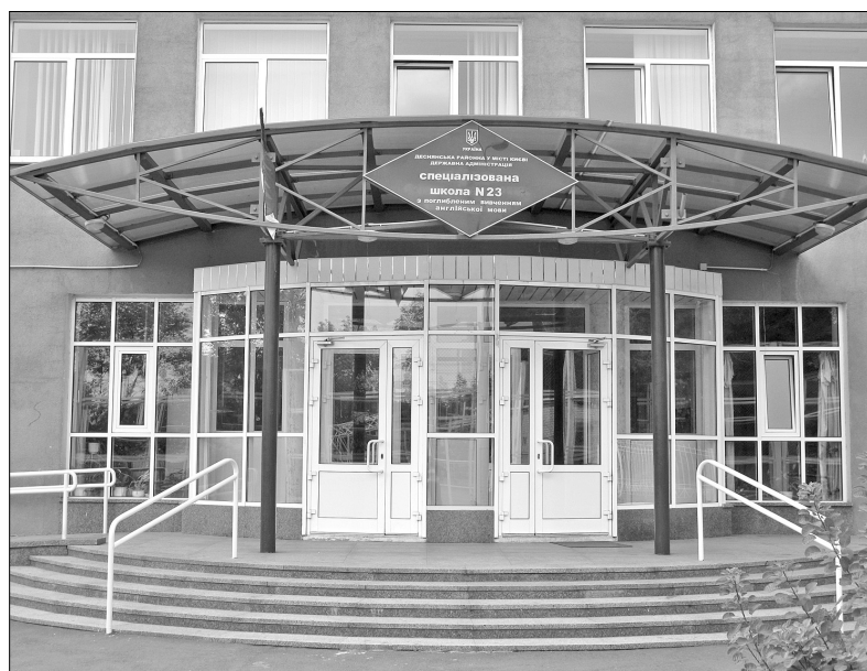
Навчальний заклад має багату історію, адже його було відкрито ще у 1956 році, а сім років тому до приміщення добували новий корпус

До слова, театральне мистецтво в школі № 23 впроваджується не лише у театральному класі, тут діє театральна студія "Пролісок", яку відвідують понад 60 учнів 1-9 класів. Її вихованці беруть активну участь у районних, міських та міжнародних фестивалях та конкурсах. Торік учні спеціалізованої школи № 23 посіли призові місця у Всеукраїнському благодійному дитячому фестивалі "Чорноморські ігри", що проходить у місті Скадовськ.