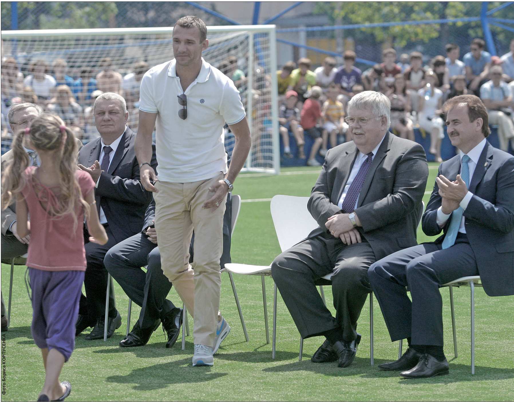
Вчора Андрій Шевченко та Олександр Попов відкрили оновлений стадіон в спеціалізованій школі № 216, де навчався український футболіст

Голова КМДА Олександр Попов та легендарний український футболіст Андрій Шевченко відкрили оновлений стадіон на Оболоні