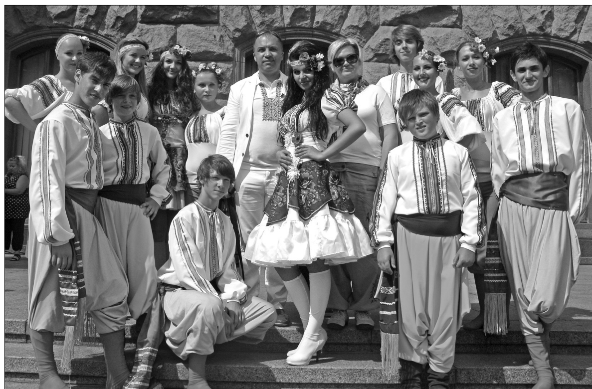
Вже два роки поспіль в спеціалізованій школі № 23 діє унікальний проект "Театральний клас", мета якого — якісна профільна мистецька освіта учнів 10-х та 11-х класів

Проект "Школа повного року навчання" діє тут понад три роки, він є основою всієї інноваційної діяль-