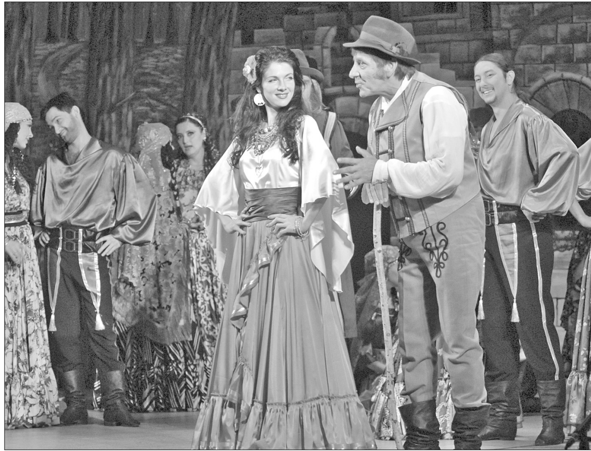
В центрі оперети — протистояння волелюбних романтичних ромів та меркантильного власника свиней Зупана

В Києві оперета йде українською мовою. Як розповів Богдан Струтинський, лібрето було надіслане зі Львова, де постановка йшла в 1950-х