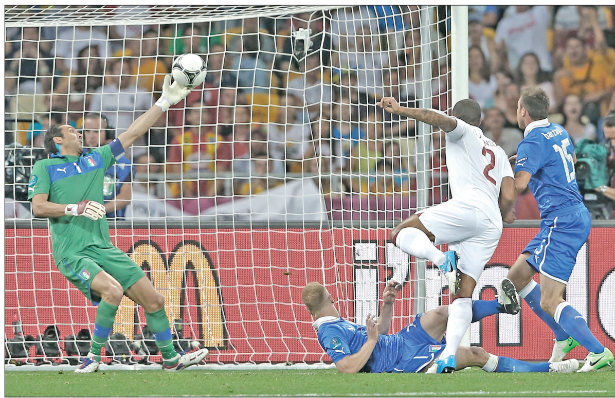
Воротар збірної Італії Джанлуїджі Буффон (відбиває м'яч) неодноразово рятував свою команду у матчі проти збірної Англії

Менше тижня залишилось до фінального матчу Євро-2012. Упродовж чотирьох днів поспіль тривали матчі 1/4 фіналу цього престижного футбольного турніру. Так, першим півфіналістом стала збірна Португалії, яка завдяки голу Кріштіано Роналду здолала збірну Чехії. За ними у наступну стадію вийшли німецькі футболісти, які розгромили збірну Греції — 4:2. Чинний чемпіон континенту — національна команда Іспанії здобула важку перемогу над французами — 2:0. А в заключному матчі між Англією та Італією долю путівки визначили у серії післяматчевих пенальті. Тут влучнішими були представники Апеннінського півострова.