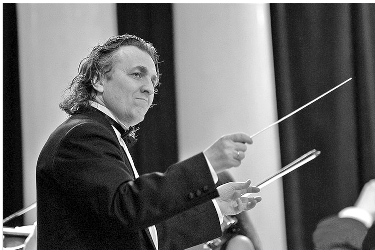
На вечорі пролунає класична музика у виконанні Національного камерного ансамблю "Київські солісти" під керівництвом головного диригента Володимира Сиренка

Також слухачі почують класичну музику у виконанні відомих колективів: Національного камерного ансамблю "Київські солісти" під керівництвом головного диригента Володимира Сиренка, Київського квартету саксофоністів Національної філармонії України під керівництвом заслуженого артиста Укра-