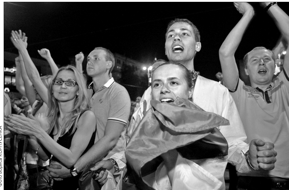
Українські вболівальники святкують у фан-зоні першу перемогу вітчизняної збірної з футболу на Євро-2012

Загалом цього вечора за протистоянням збірних України та Швеції на екрані Швеції «Camp Sweden». Нагадаємо, у тимчасовому таборі на Трухановому острові наразі розмістилося 3,5 тис. футболних вболівальників зі Швеції. Там встановлено 500 наметів, а на паркінгу обліковується 120 трейлерів. Мешканці кемпінгу задоволені умовами тимчасового проживання.