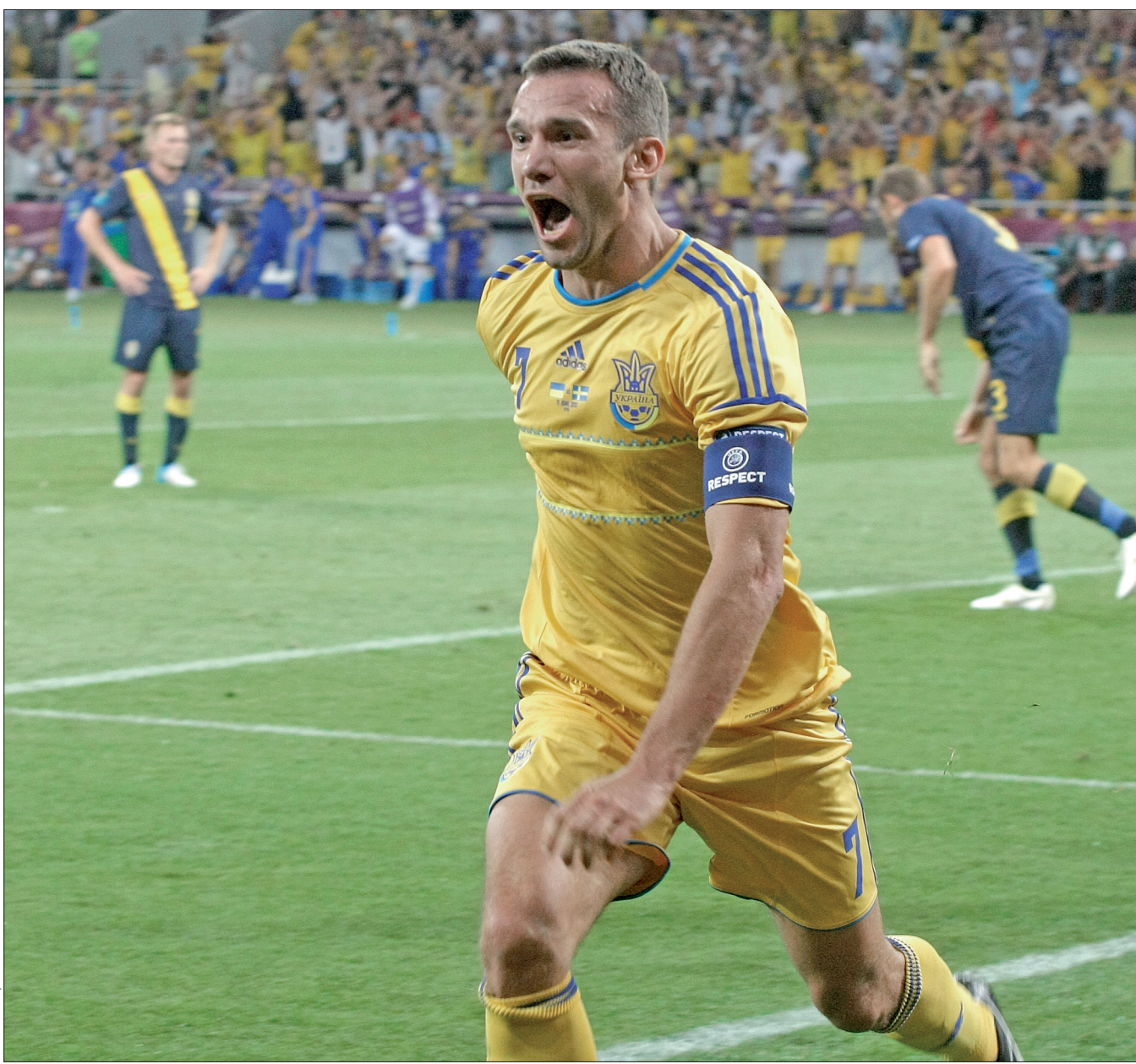
Шойно Андрій Шевченко зрівняв рахунок у матчі проти збірної Швеції

Як виявилось згодом, саме цей баланс подарував нам переможний результат. Перед самим матчем мало хто з експертів брався прогнозувати перемогу цієї пари. Для обох збірних ця зустріч стала першим офіційним поєдинком. У товариських матчах українці та шведи зустрічалися тричі, і в цих іграх був зафіксований паритет: по одній перемозі та нічії. Також усіх цікавило протистояння двох легенд своїх збірних — Андрія Шевченка та Златана Ібрагімовича, проте футболісти такі питання журналістів одразу ж припиняли. Зокрема український форвард зазначив, що передусім ця гра відбудеться між збірними, а не футболістами, і жоден з них не здобуде перемоги без підтримки усієї команди. Тож відпо-