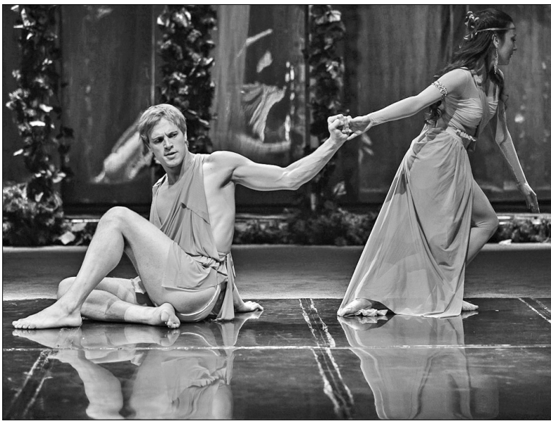
Справжні пристрасті розгортаються у любовному чотирикутнику молодих афінян

Тож якщо ви засумували за магією та казкою, не пропустіть "Сон літньої ночі". Наступний показ цієї вистави відбудеться на великій сцені Театру на Липках 7 липня ●