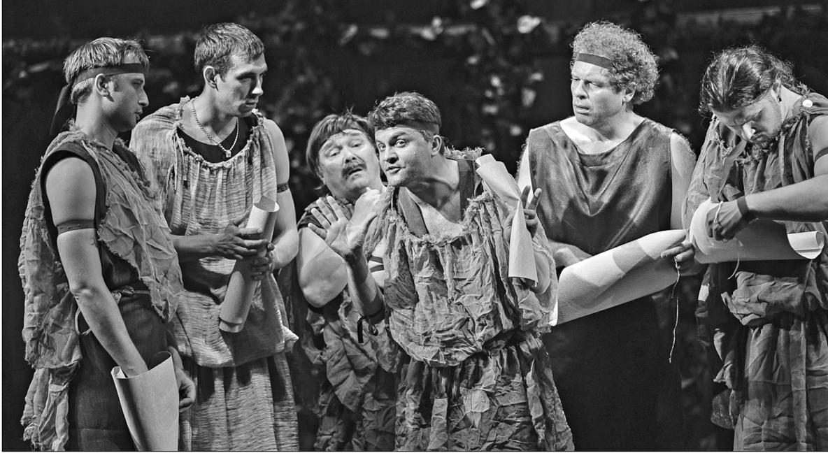
Найкумедніші моменти вистави створюють актори-ремісники, які репетирують у лісі

"Сон літньої ночі" вважається однією з найцікавіших п'єс Шекспіра, що не вписується в певні стилісовані рамки. Драматургу вдалося поєднати реальне та фантастичне, лірику та гумор, античну міфологію та англійський фольклор. Так само заплутаними і переплетеними є кілька сюжетних історій. В лісі панує королівське подружжя Оберон і Титанія, яке "побило глечики" через нового пажа королеви. Сюди ж потрапляють четверо молодих афінян, справжній любовний чотирикутник — двоє хлопців, дівчина, в яку