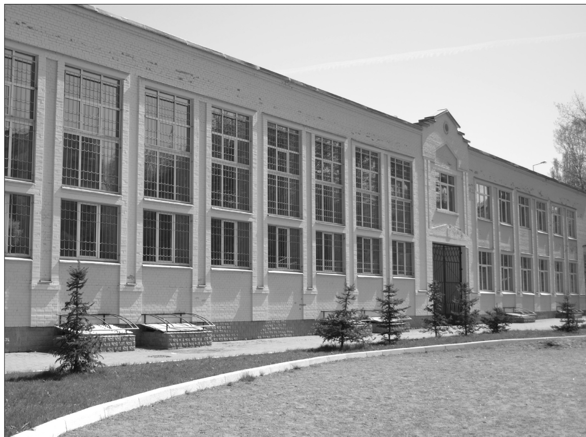
З 2005 року загальноосвітня середня школа № 193 набула статусу спеціалізованої з поглибленим вивченням української мови і літератури

З 2005 року загальноосвітня середня школа № 193 набула статусу