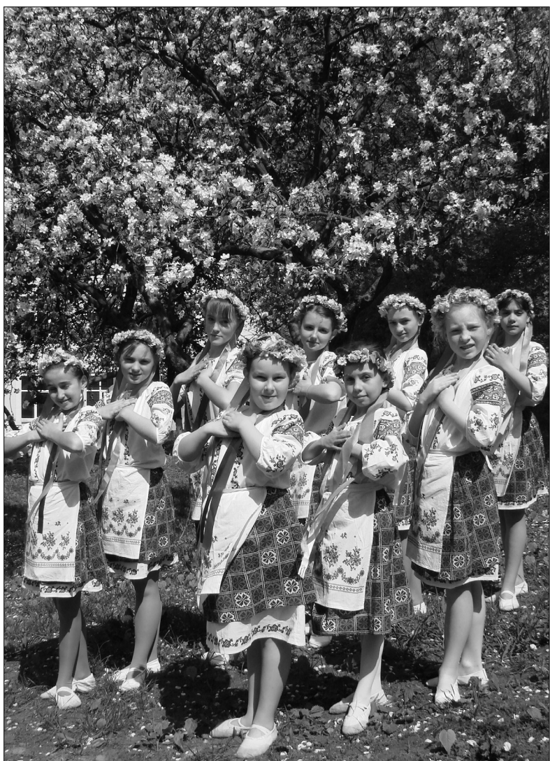
Гордість спеціалізованої школи — це хореографічний ансамбль "Троно"

Інформацію надано Синодальним відділом Української Православної Церкви