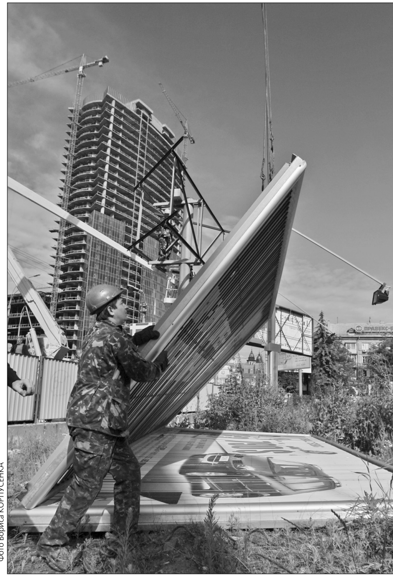
Зовнішню рекламу прибирають поблизу Києво-Печерської лаври, у буферній зоні Софії Київської, навколо Михайлівського та Володимирського соборів

За даними ГУ з питань реклами КМДА, у нульовій зоні, де передбачено повне очищення від зовнішньої реклами, з початку квітня демонтовано 115 конструкцій