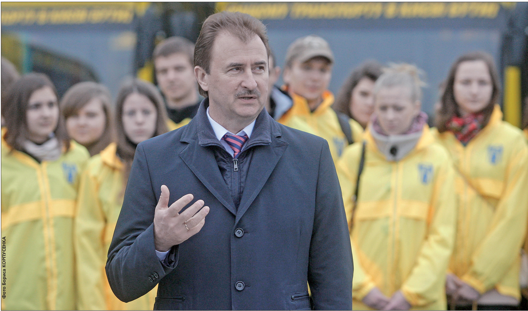
Разом з новим транспортом на міських маршрутах працюватимуть волонтери, завдання яких — підвищувати культуру пасажирів

Міська влада робить громадський транспорт зручним для киян