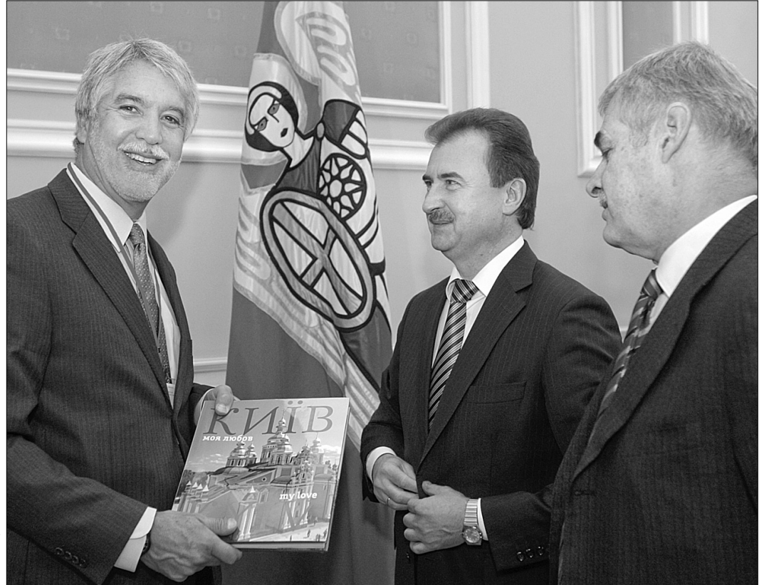
Учора голова КМДА Олександр Попов зустрівся з головою Ради директорів Інституту розвитку і транспорту Нью-Йорка Енріке Пеньялоса

Також пан Пеньялоса вклевнений, що у Києві