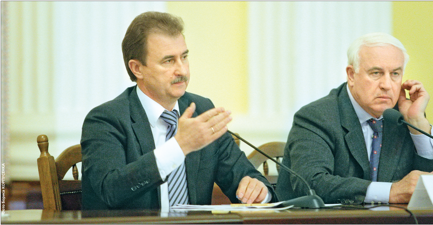
Голова КМДА Олександр Попов наголосив, що після впровадження адміністративних змін система міської влади має стати прозорою та зрозумілою для киян

Голова КМДА Олександр Попов зазначає, що вона має бути проведена динамічно та у стислі терміни