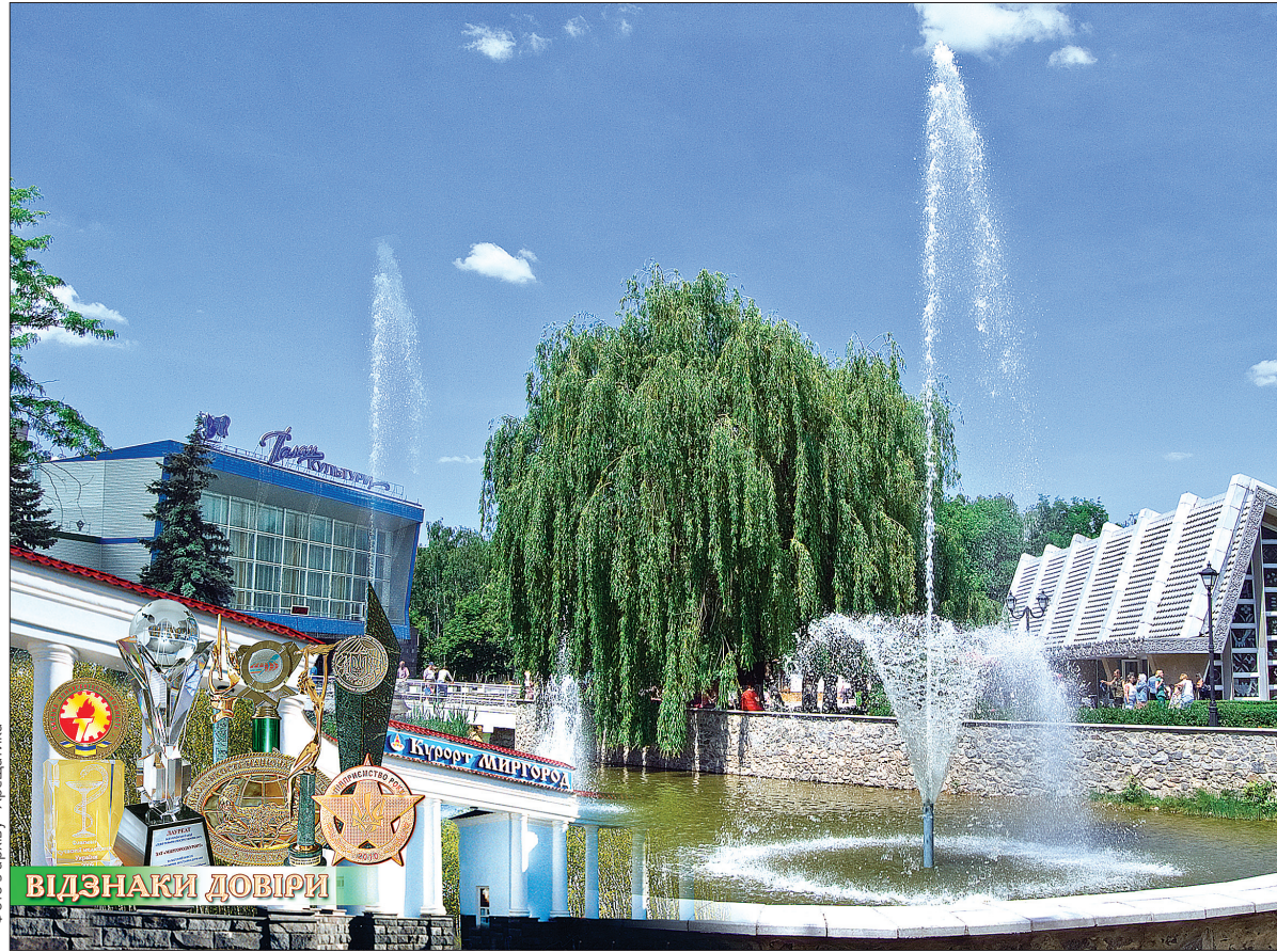
Улюбленим місцем відпочинку є центральна площа курорту Миргород

Оскільки, як жартують медики, немає абсолютно здорових людей, є тільки недообстежені, то на курорті Миргород саме діагностичні заходи мають приділяти величезне значення. У комфортних кабінетах із апаратурою кращих світових виробників кваліфікований медперсонал проводить ретельну діагностику: комплекс включає сотні обстежень і процедур. Сьогодні навіть іноземні партнери визнають, що такого комплексу найсучаснішого обладнання й ефективних методик, розроблених фахівцями