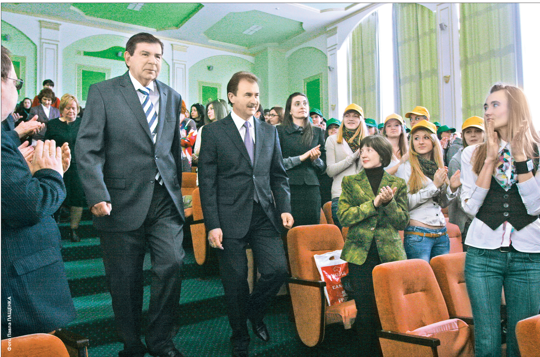
Голова КМДА Олександр Попов відповів на низку запитань студентів та подякував молоді за активну волонтерську діяльність

Міська влада використовуватиме розробки молодих науковців для вирішення проблем столиці