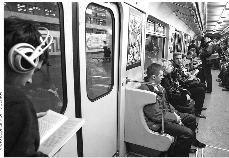
У КП "Київський метрополітен" запевняють, що користуватися метро так само безпечно, як і раніше

Заступник начальника "Київського метрополітену", головний ревізор