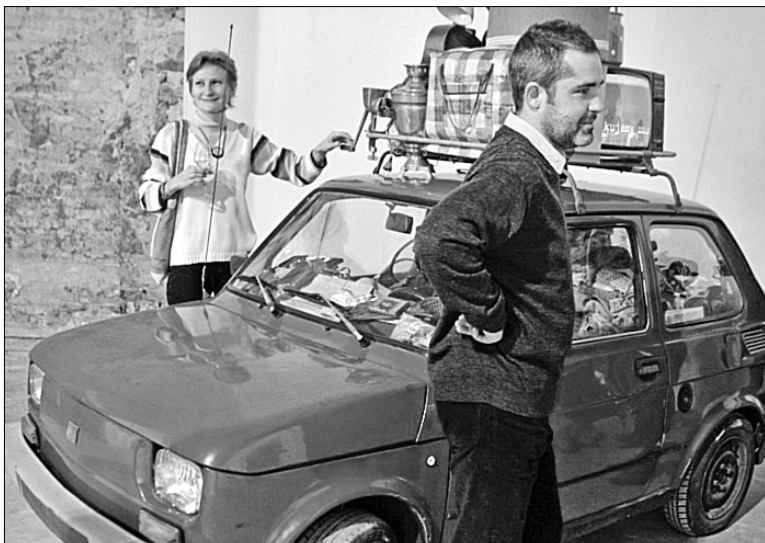
Для польського проекту "Подорож на Схід" українські митці використали "Фіат" та різні побутові предмети минулого століття

Для того, щоб обійти всі зали та познайомитися з сучасним мистецтвом, знадобиться не одна година. Проте витрачений час того вартий. Нагадуємо, що ART-KYIV Contemporary триває до 14 листопада •