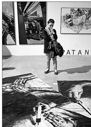
На виставці можна ознайомитися з роботами близько 30 галерей сучасного мистецтва з України, Росії, Німеччини, Франції та Швейцарії