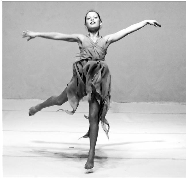
Київські танцівники вражали своєю майстерністю

народного конкурсу “Art Premier”, член хореографічного журі Володимир Соболев задоволений тим, що було багато учасників не лише з усіх куточків України, а й Російської Федерації, Санкт-Петербурга, Москви, та з Абхазії: “За хореографією цього разу особливо вирізнявся народно-сценічний танець, який представили кияни, — каже пан Соболев. — Гран-прі здобули студенти факультету хореографічного мистецтва Київської дитячої академії