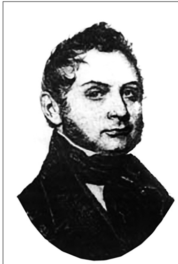
Іван Фундуклей став одним із найефективніших київських губернаторів

єві було відновлено субординацію в стосунках між панами та звичайними городянами, що спричинило ненависть пересічних киян. У 1840 році Дмитро Гаврилович домігся скасування дії Литовського статуту в Південно-Західному краї, причому, окрім суто політичних підстав, посилався і на те, що "дія статуту є кричущою несправедливістю стосовно маси населення, бо закони в усьому протегують знатного і багатого". У 1845 році казенні селяни були переведені на оброк, а в 1847-му Бібіков ввів "інвентарні правила", що визначали стосунки кріпаків-селян до поміщиків.