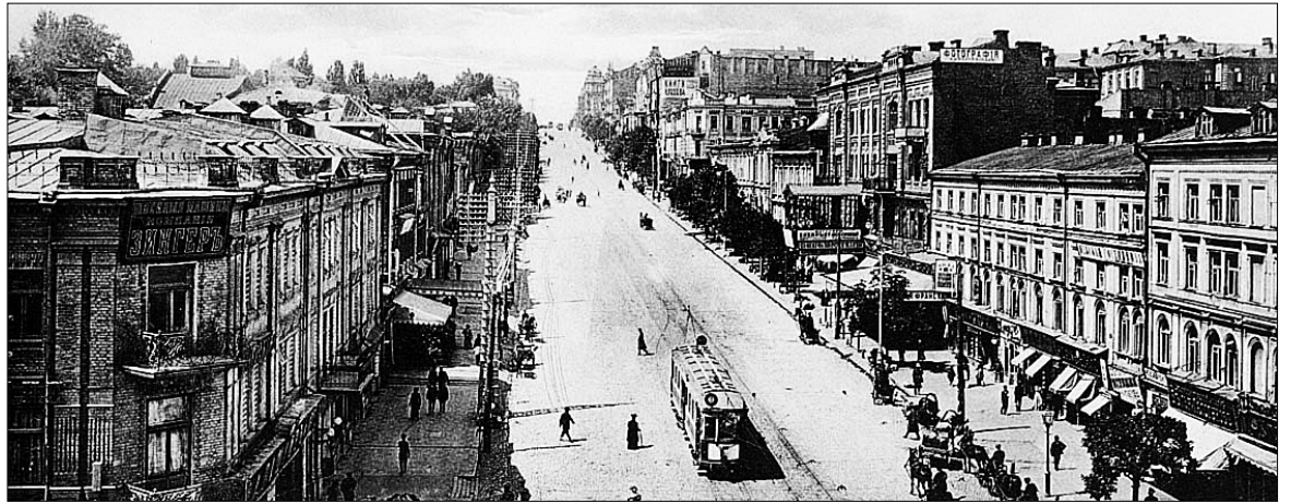
Такий вигляд мала вулиця Фундуклеївська до революції

З іншого боку, Бібіков дуже любив розкіш і навіть у 60 років постійно залицявся до жінок. У веселих гулянках він убачав протидію революційним настроям. Але на все це були потрібні гроші. У 1839 році Дмитро Гаврилович "пронохав" про волинського губернатора Івана Фундуклея, котрий володів величезними багатствами. Бібіков дуже активно взявся за переведення перспективного чиновника до Києва, сподіваючись, що той щедро віддасть йому.