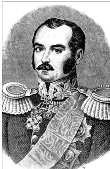
Дмитро Бібіков був виконавцем волі царя у Києві