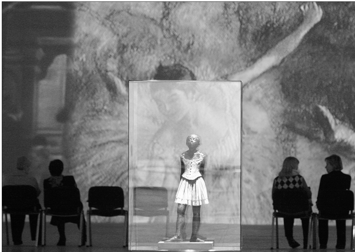
Уперше до Києва привезли колекцію скульптур Едгара Дега, і його знамениту "Юну танцівницю"

У столиці триває Великий скульптурний салон