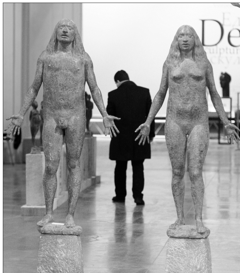
Скульптури "Адам і Єва" Володимира Кочмаря потрапили на салон із Харкова