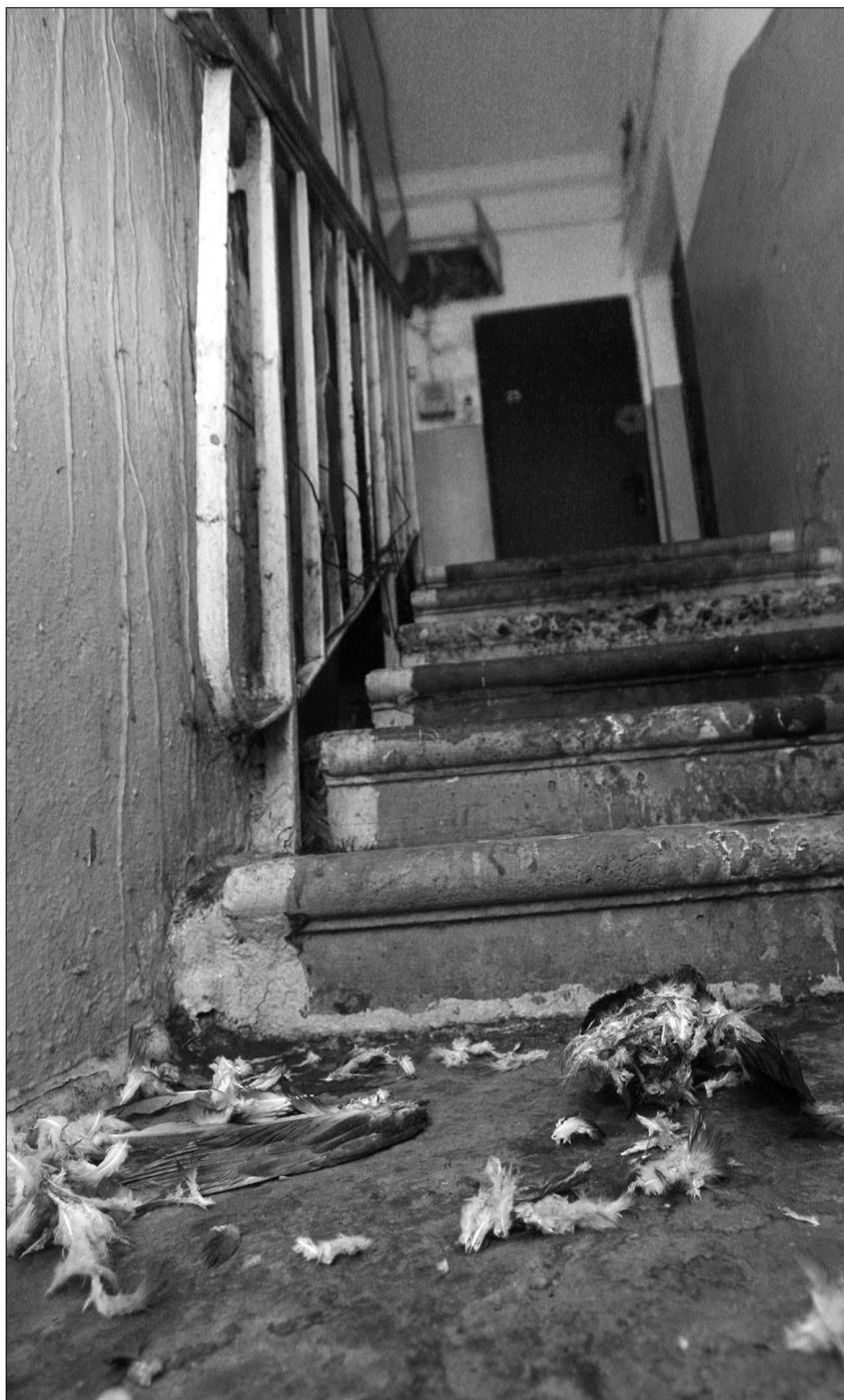
Парова завіса, в якій опинився дім на Салютній, знищила під'їзди

"Хрещатик" вирішив опікуватися долею "парового" будинку. Ми стежитимемо за розвитком подій та поінформуємо читачів про реакцію на проблему комунальних служб і чиновників ●