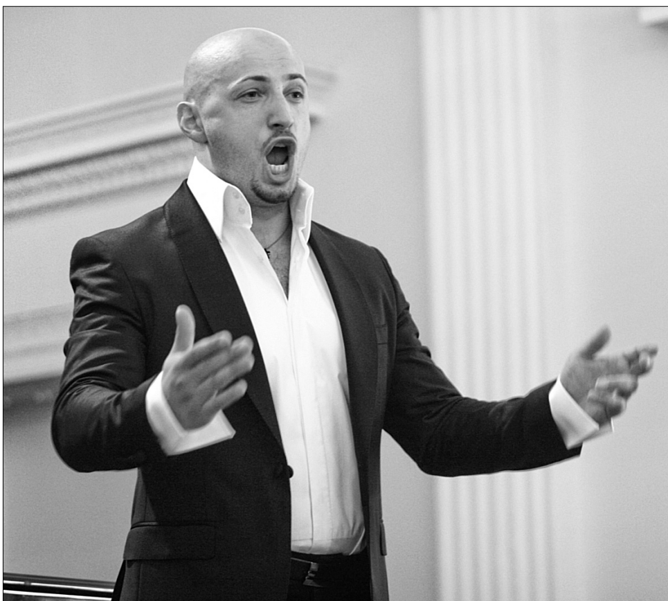
Я вихованець консерваторії, і мені хочеться працювати в стилі, який поєднує класичну музику, оперну, естрадну і рок

— Усім виконавцям, які їдуть за свої кошти, не вигідно витрачати умовно 500 тисяч чи мільйон доларів на конкурс, коли за ці гроші можна успішно побудувати стабільний бізнес удома, який приносить прибуток не один рік. Це перший момент. Другий момент — коли артист немає грошей, він просить їх у держави. Я проти того, щоб фінансувала держава. Як і всі музиканти, я ходив до музичної школи і знаю, в якому вона стані. Уявіть собі, скільки ми могли б відремонтувати музичних інструментів за мільйон доларів! Скільки могли б за ці кошти дати зарплат для музичних педагогів. У даний момент я за виховання. Держава не повинна вкладати кошти у виконавців,