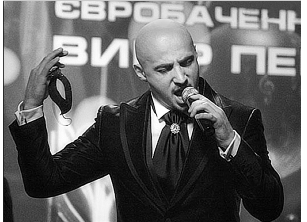
Якби кожен займався своєю справою, ми мали б ідеальний рівень розвитку в усьому

— Те саме можна сказати і про Євробачення. Артисти зростають на іміджі та на епатажності. Епатажні артисти — Верка Сердючка, яка посіла друге місце на цьому пісенному конкурсі. Це непогано для країни. Але уявімо, що там виступив “невідомий” Френк Сінатра чи Лучано Паве-