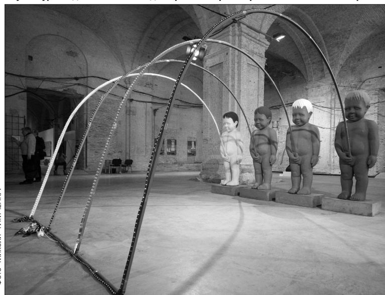
Парки Києва збираються прикрасити сучасними скульптурними об'єктами та арт-лавками