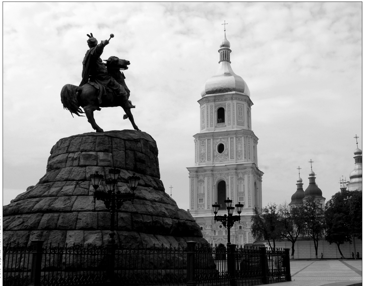
Софія Київська — серед найбільш популярних місць у іноземних та вітчизняних туристів

За вимогами УЄФА Київ має забезпечити 7300 номерів у готелях категорій 3—4—5 зірок. Сьогодні з готелями, які працюють нині, вже укладено угод на 6 495 номерів, проте найбільший дефіцит становлять номери в 4—5-зіркових готелях (приблизно 3 тисячі та тисяча відповідно). До проведення чемпіонату Євро-2010 будуть 9 готелів на 1683 номери, які заплановано ввести в експлуатацію до кінця 2012 року. З них — два 5-зіркових ("Фермент Готель Київ" і "Хіл-