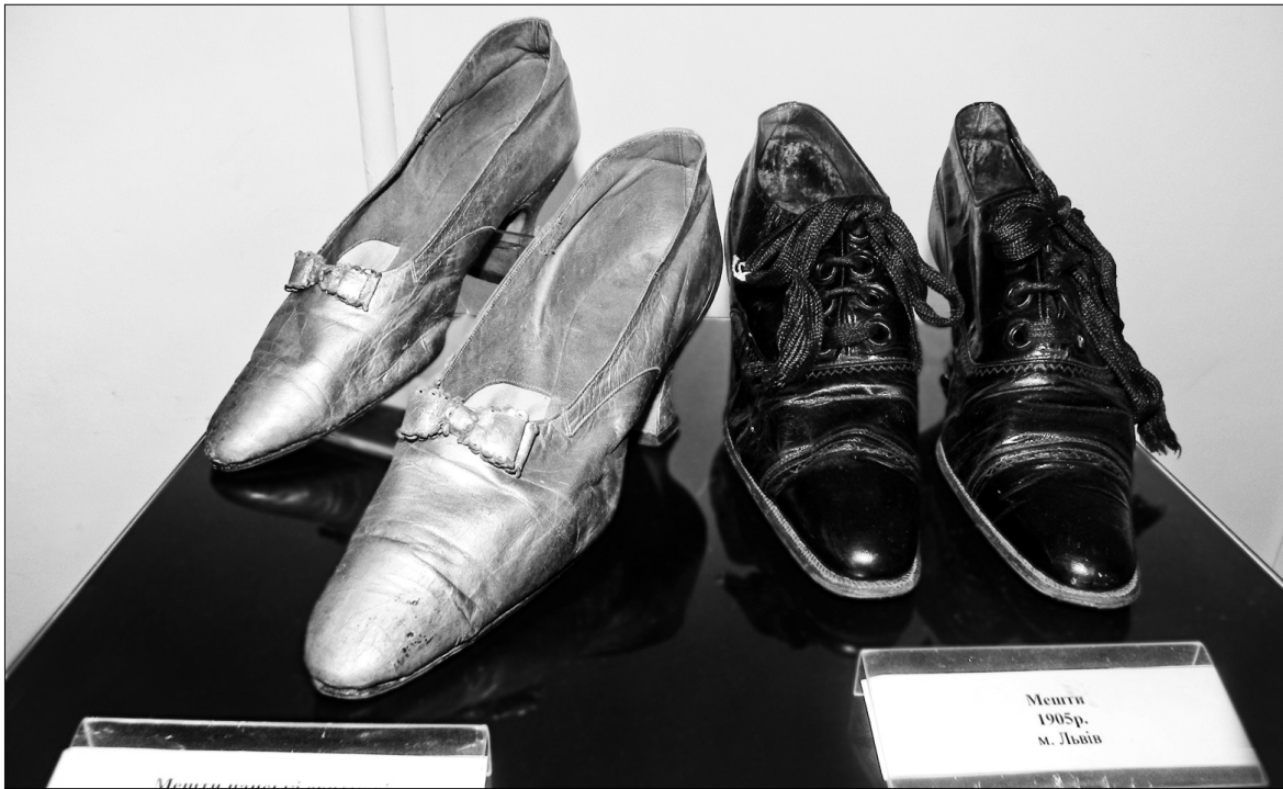
Дизайн взуття з першої половини минулого сторіччя майже не змінився

У столиці відкрилася виставка шкіряних виробів західних регіонів України