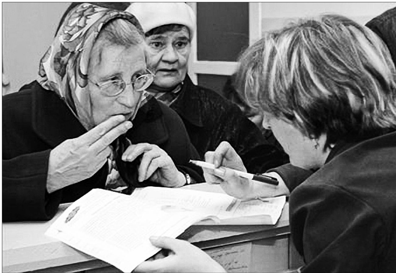
Найчастіше люди скаржаться на роботу комунальних служб

Окрім цього, працівники Управління з питань звернень громадян проводять виїзні дні контролю у районних державних адміністраціях Києва. Під час таких рейдів відбувається перевірка стану виконання доручень, наданих за результатами аналізу звернень громадян. За минулий