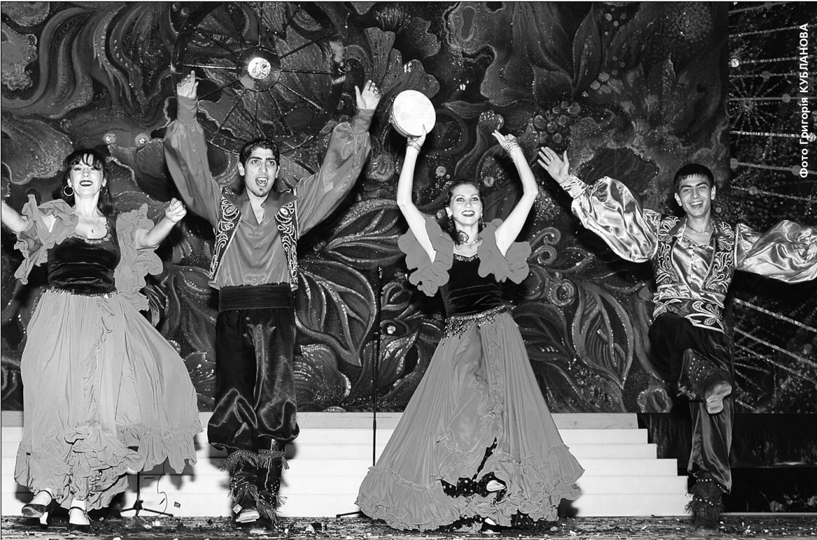
19 та 26 лютого у столиці відбудуться концертні виступи циганського театру "Романс"

У столиці презентують концерти, присвячені старовинним циганським романсам