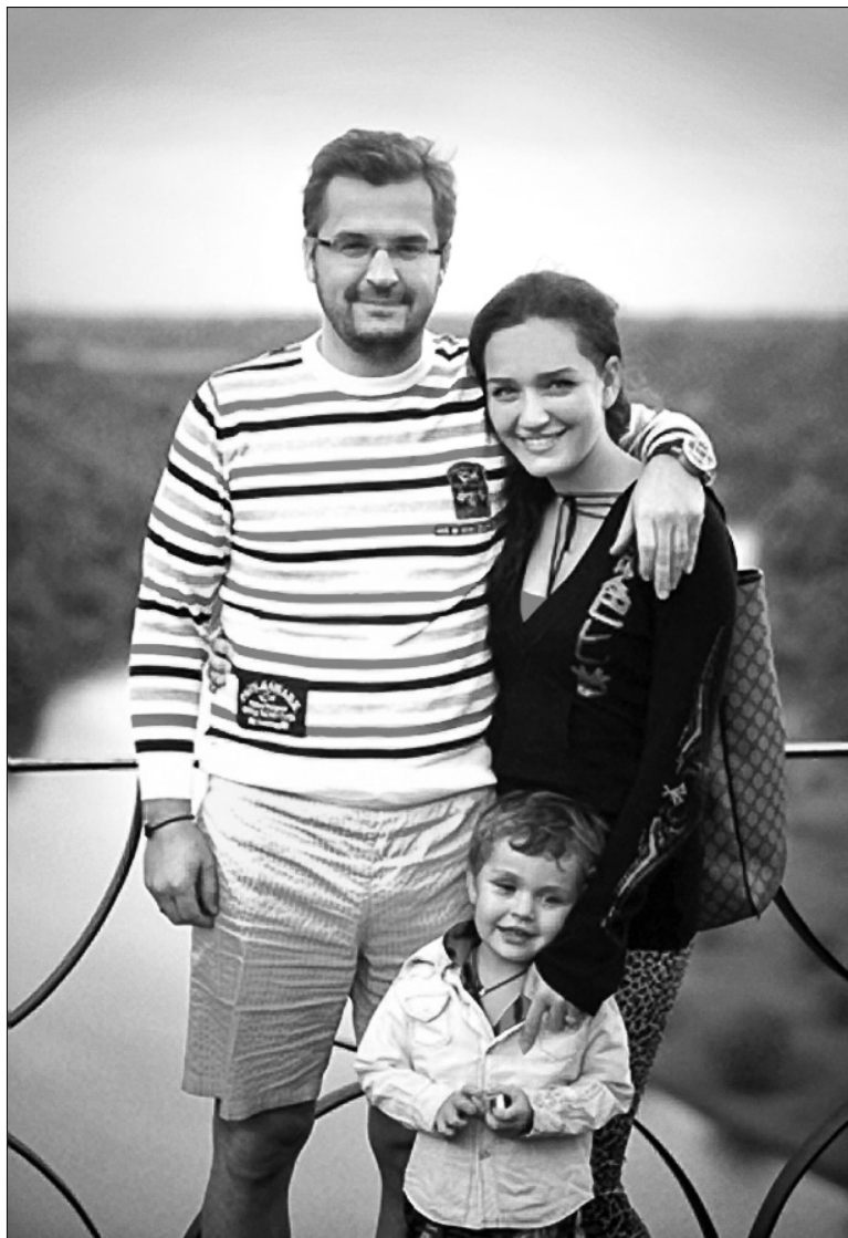
“Моє головне завдання як батька — прищепити дітям почуття любові до країни та поваги до людей”