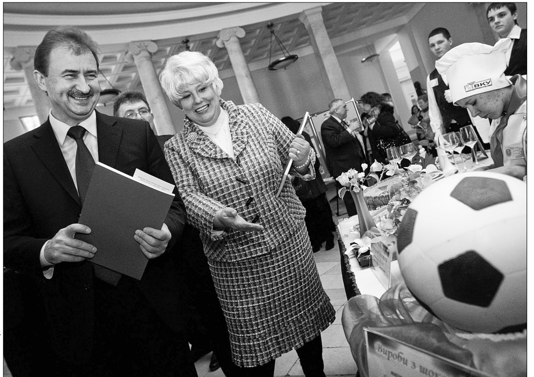
У рамках зустрічі голова КМДА Олександр Попов ознайомився з роботами учнів професійно-технічних училищ

умовах Київська міська державна адміністрація відшукала можливість залучити 80 мільйонів гривень для виплати надбавок до посадових окладів працівникам соціально-культурної та медичної сфер. На стимулювальні доплати за складність і напруженість роботи усім педагогічним працівникам буде спрямовано кошти в розмірі 61,64 мільйона гривень. Я сподіваюся, що відповідні