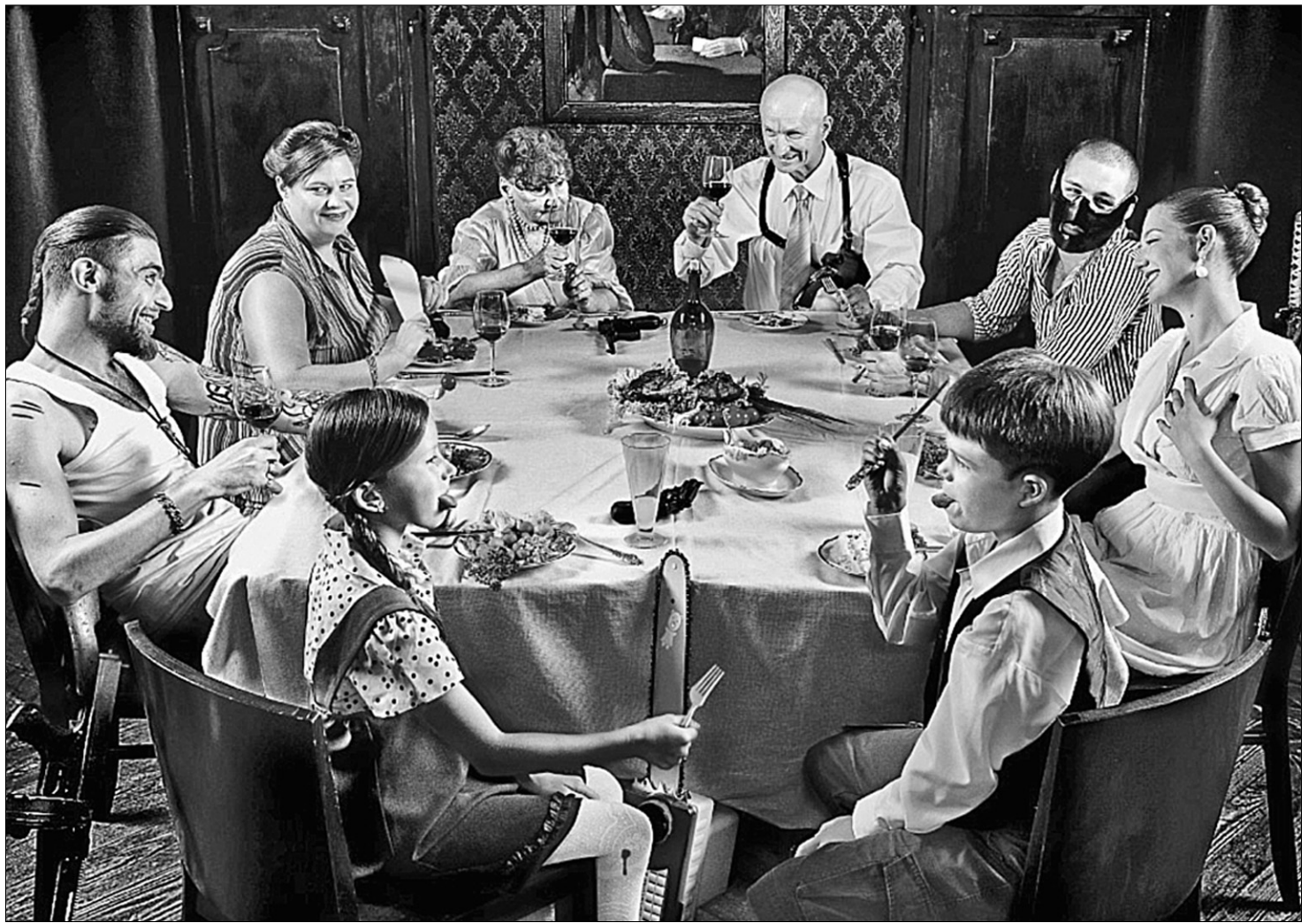
“Мафія” створювалася за мотивом італійського серіалу «Спрут», в якому комісар Каттані бореться з сицилійською cosa nostra

Спробую пояснити правила цієї складної, але неймовірно цікавої гри. З популяризацією “Мафії” відкривається безліч аматорських та професійних клубів, та водночас кожен клуб створює власну ва-