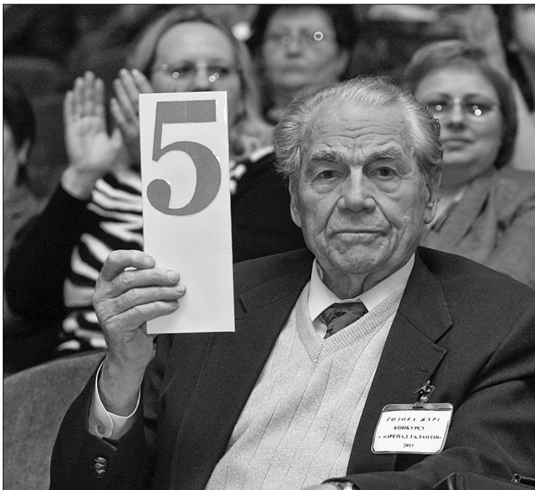
Народний артист СРСР, народний артист України легендарний Дмитро Гнатюк очолює журі конкурсу "Зорепад талантів-2011"

11 лютого в приміщенні Солом'янської РДА свої творчі здібності демонстрували представники організацій, що входять до Об'єднаного комітету профспілки Київради та КМДА. В конкурсі "Зорепад талантів" з номерами — хореографічними, вокальними, розмовними — виступали 66 учасників. Переможці 1 березня влаштують гала-концерт у Колонній залі КМДА.