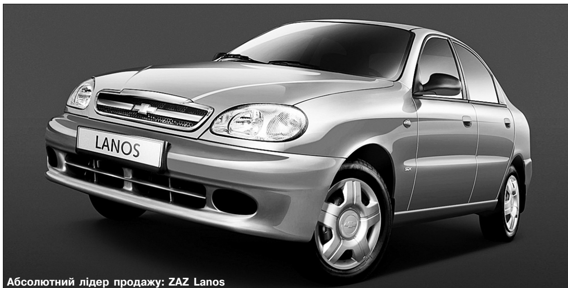
Абсолютний лідер продажу: ZAZ Lanos

У цьому конкурсі абсолютним лідером став, ясна річ, ZAZ Lanos — 9460 проданих авто. Такий парадокс в Україні повторюється з року в рік: звання “Автомобіль року” дістаються одним моделям, а найпродаванішими стають інші. Як кажуть, одних люблять, а з іншими одружуються ●