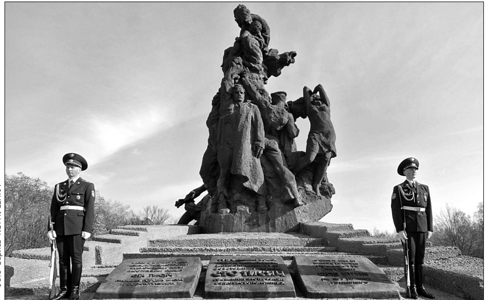
У 70-ту річницю трагедії в Бабиному Яру Київ вшанує пам'ять жертв нацистської розправи

Під час німецької окупації Києва у 1941-1943 роках Бабин Яр став місцем масових розстрілів німецькими окупантами мирного населення і радянських військовополонених. Лише за два дні, 29 та 30 вересня 1941-го, тут було знищено майже 34 тисячі євреїв. Бабин Яр став місцем розправи і над циганами. Також тут знайшли свою смерть радянські активісти, підпільники, члени Організації українських націоналістів, полонені й "саботажники", порушники комендантської години. Список тих, хто, на думку нацистів, заслуговував на таку смерть, лише за національно-етнічною ознакою не вичерпувався. Людей масово розстрілювали в Бабиному Яру та розташованому поряд Сирецькому