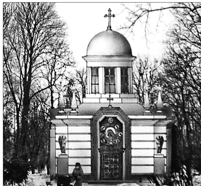
Для каплиці в Києві шукають доцільніше місце

Останнім часом дедалі частіше в столиці говорять про архітектурні проблеми: незаконна забудова, стан історичних пам'яток, доцільність створення нових об'єктів. У середу, 9 лютого, відбулося засідання архітектурно-містобудівної ради при Головному управлінні містобудування, архітектури та дизайну міського середовища. Столичні здодчі зокрема зауважили, що в зелених зонах міста з'явилося забагато каплиць. І більшість з них відкриті для відвідувачів лише кілька разів на рік.