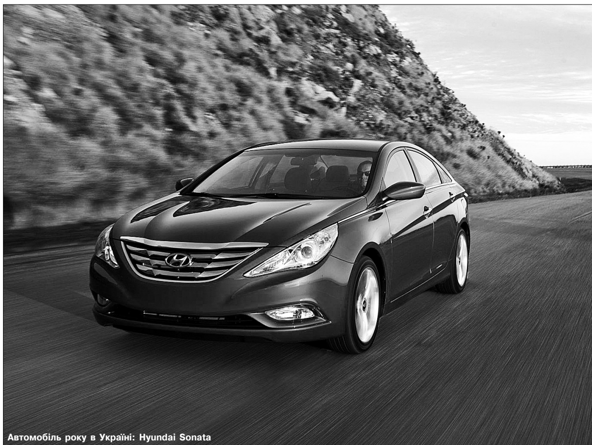
Автомобіль року в Україні: Hyundai Sonata

Член журі щорічного національного конкурсу “Автомобіль року в Україні 2011” розповідає, які авто і чому обрали найкращими