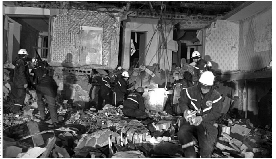
За попередніми даними, причиною вибуху став витік газу