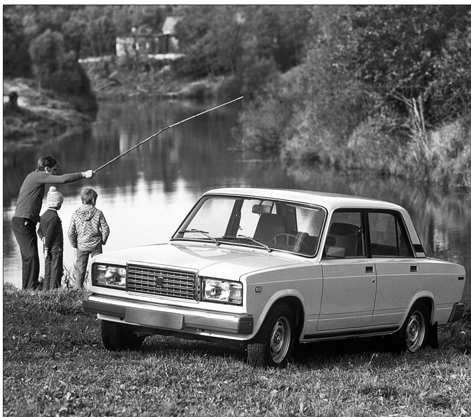
Вічно молода "Лада"

Після незграбного Тісо мультяшний дизайн компактного хетчбека або навіть