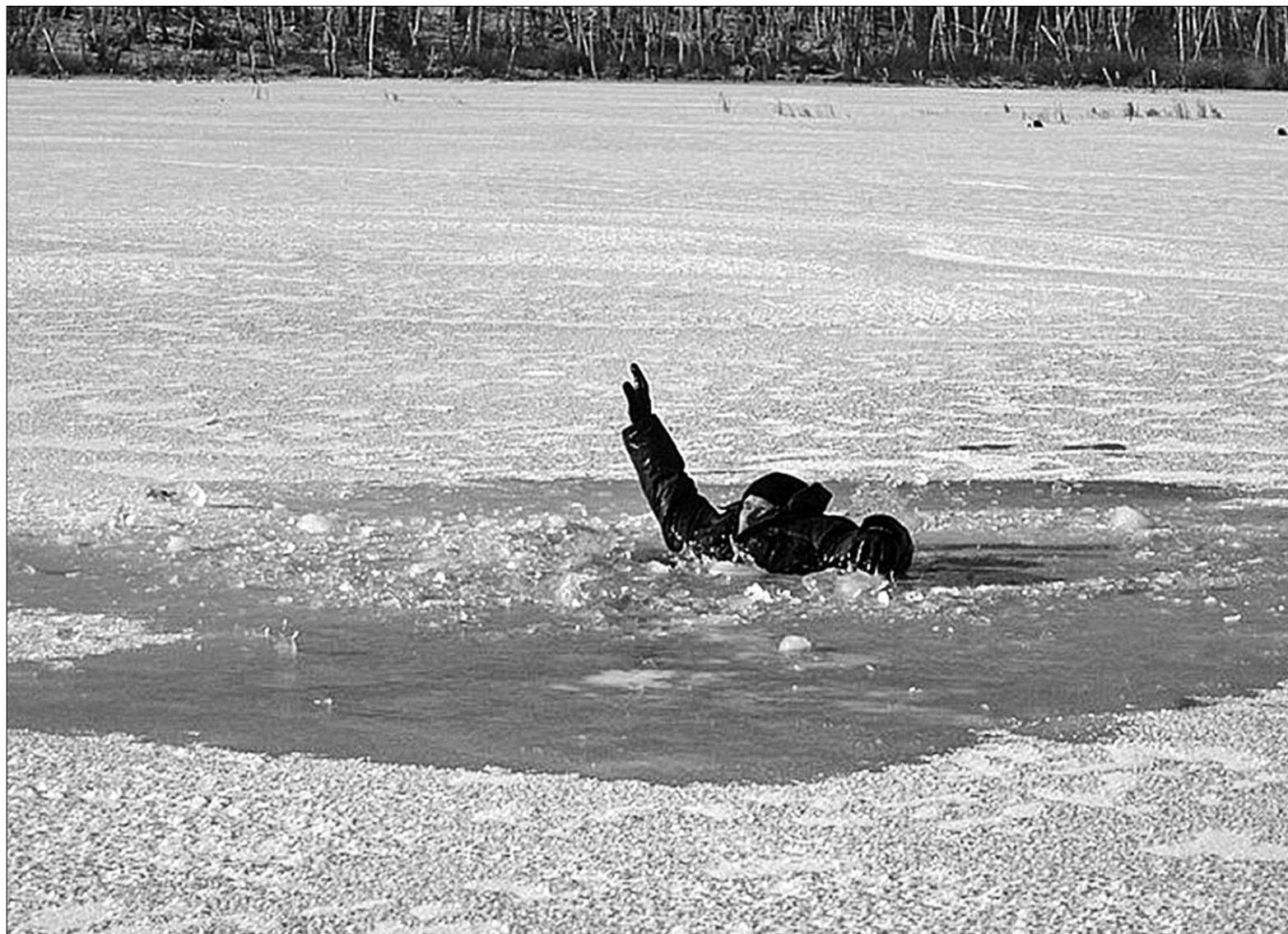
Нехтування правилами безпеки на льоду може призвести до трагедії

Рятівники розповідають, що головна небезпека на водоймах Києва чаїться в течіях і воронках. Саме тут вода підмиває лід й робить його тоншим. Лід на річках та озерах може бути тонким поблизу кущів, очерету, під кучугурами, у місцях, де водорості вмерзли у кригу. Фахівці радять оминати вкриті товстим сніговим шаром ділянки, адже тут льодовий покрив тонший. Міцність льоду можна визначити візуально: найміцніший лід блакитного кольору, білий менш тривкий, найнебезпечніший — сірий, матово-білий або з жовтуватим відтінком. Обережними варто бути біля берега, адже тут крига може нещільно з'єднатися з сушею, можливі тріщини. Якщо дуже потрібно вийти на замерзлу річку, візьміть із собою палицю, аби перевіряти міцність льоду. Якщо він проламується від одного удару, негайно повертайтеся. Щоб не довелось перевіряти за своєю поради, не бийте по кризі ногою. Перші кроки варто робити, не відриваючи підшви від поверхні. Якщо ви на лижах, пошукайте, чи немає вже прокладеної лижні. Якщо немає, і вам треба її прокласти, кріплення лиж відстебніть (щоб, у крайньому випадку, швидко їх позбутися), палиці тримайте