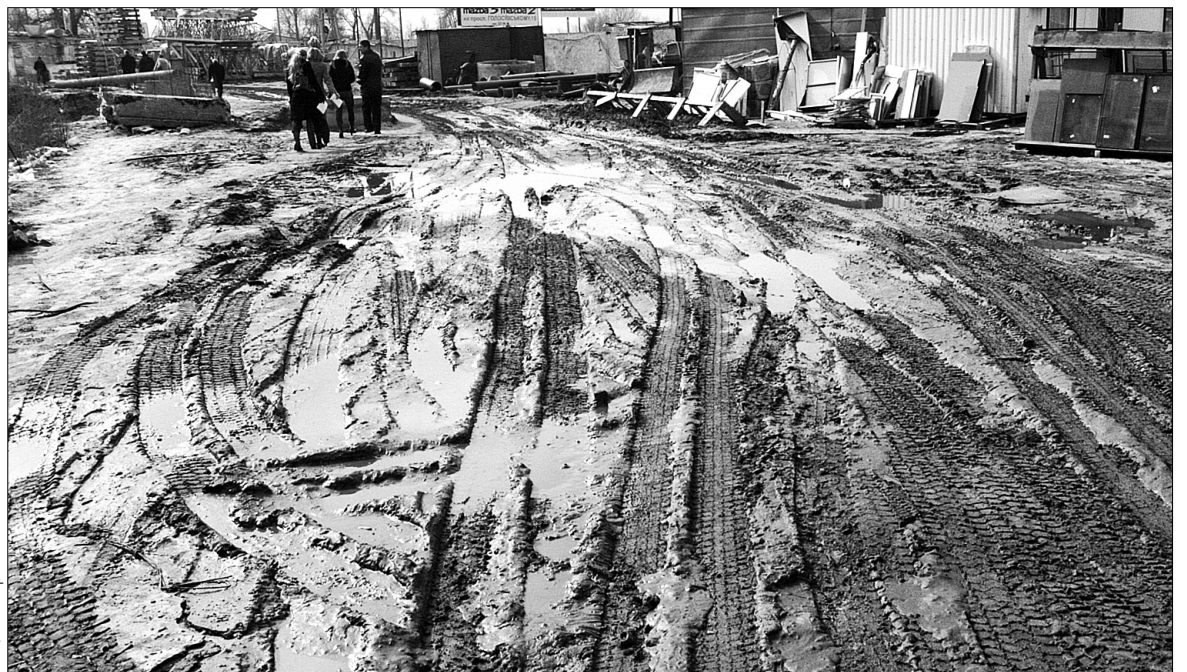
Рекультивация занедбаних ділянок — одне з пріоритетних питань "Програми ефективного використання та охорони землі на 2011—2015 роки"

На сьогодні територія Києва становить 83,6 тисячі гектарів. Питома вага — це забудована територія, що займає приблизно 43,7 %, ліси та інші площі — 42,3 %. Нині в Головному управлінні діє автоматизована система земельного кадастру. Завдяки їй проведено інвентаризацію та внесено в базу інформацію про 62,6 тис. гектарів території столиці, тобто 75 % від загальної площі. У повному обсязі завершено інвентаризацію ділянок сільськогосподарського використання, ділянок у власності громадян і різноманітних підприємств. Є також підсумкова інформація про надходження від використання землі за попередньої програми на 2005—2010 роки. Так, якщо в 2005 році оренда землі давала 180,3 млн грн надходжень до міського бюджету, то в 2010-му вже 1,2 млрд грн. Надходження від продажу за п'ять років становили 3,8 млрд грн.