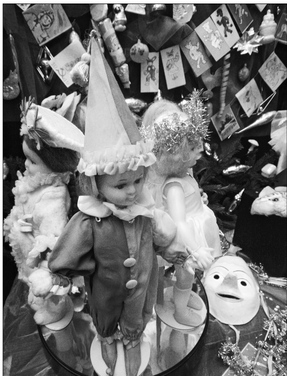
Як змінювалися ялинкові прикраси та новорічні іграшки протягом минулого століття, показує виставка "Зимова казка"

У кожний період часу ялинкові прикраси та новорічні атрибути відображали, чим жила країна. Так, у 1940-х роках виготовляли фігурки мешканців радянських республік та ялинки з курячого пір'я, дарували іграшкових слоненят і кицьок із фланелі. Наприкінці 1950-х з'явилася так звана ялинка-па-