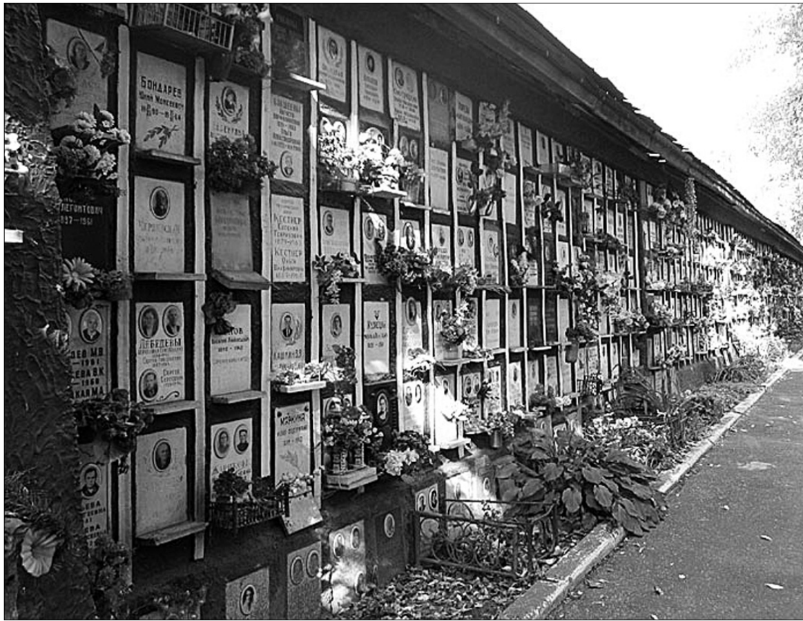
Через брак місць на кладовищах останнім часом усе більше киян для поховання рідних і близьких використовують колумбарій