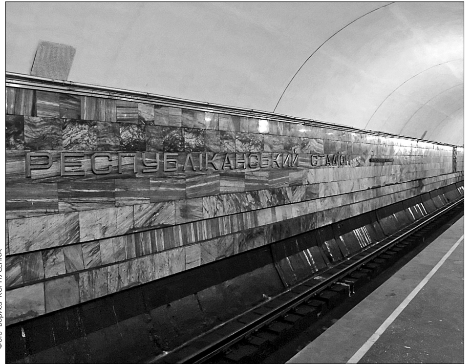
Уже найближчим часом станцію метро «Республіканський стадіон» можуть перейменувати на «Олімпійську»

сольства Іспанії назвати одну з вулиць на честь почесного президента Міжнародного олімпійського комітету Хуана Антоніо Самаранча. Він помер у квітні нинішнього року. Депутати вважають, що на його честь доречніше поки що назвати один зі спортивних закладів. На Віфлеємську можуть перейменувати, приміром, вулицю академіка Шліхтера, якщо в Палестині одну з вулиць назвуть на честь когось із відомих українців. Має бути паритет: «ми вам — ви нам».