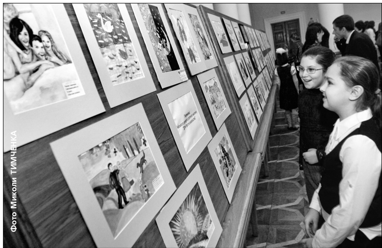
У мистецькому конкурсі «Діти проти насилля», який проводив київський міський центр сім'ї «Родинний дім», взяли участь майже 300 столичних школярів

Підбито підсумки конкурсу малюнка "Діти проти насилля"