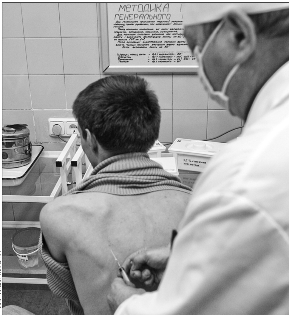
В 11 медичних закладах столиці послуги з вакцинації киянам надають безплатно

Кабінети працюють у Центральній районній поліклініці Деснянського, Дніпровського, Дарницького, Печерського, Шевченківського районів, міській студентській поліклініці, поліклініці № 2 Подільського району, поліклініці № 2 Голосіївського району, дитячій лікарні № 4 Солом'янського району, дитячій поліклініці № 1 Дарницького району, дитячій поліклініці № 2, що в Оболонському районі •