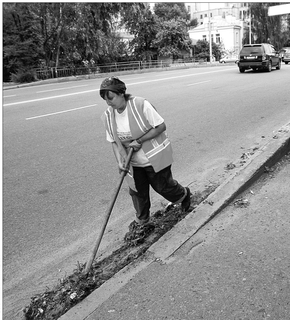
Через непрестижність робітничих професій і невисокі зарплати до комунальних служб фахівці не йдуть працювати

Як і на багатьох столичних підприємствах, у ЖЕКу № 805 Святошинського району не вистачає електрогазозварників. "Із шести потрібних у нас лише два електрогазозварники: один працює з електро-