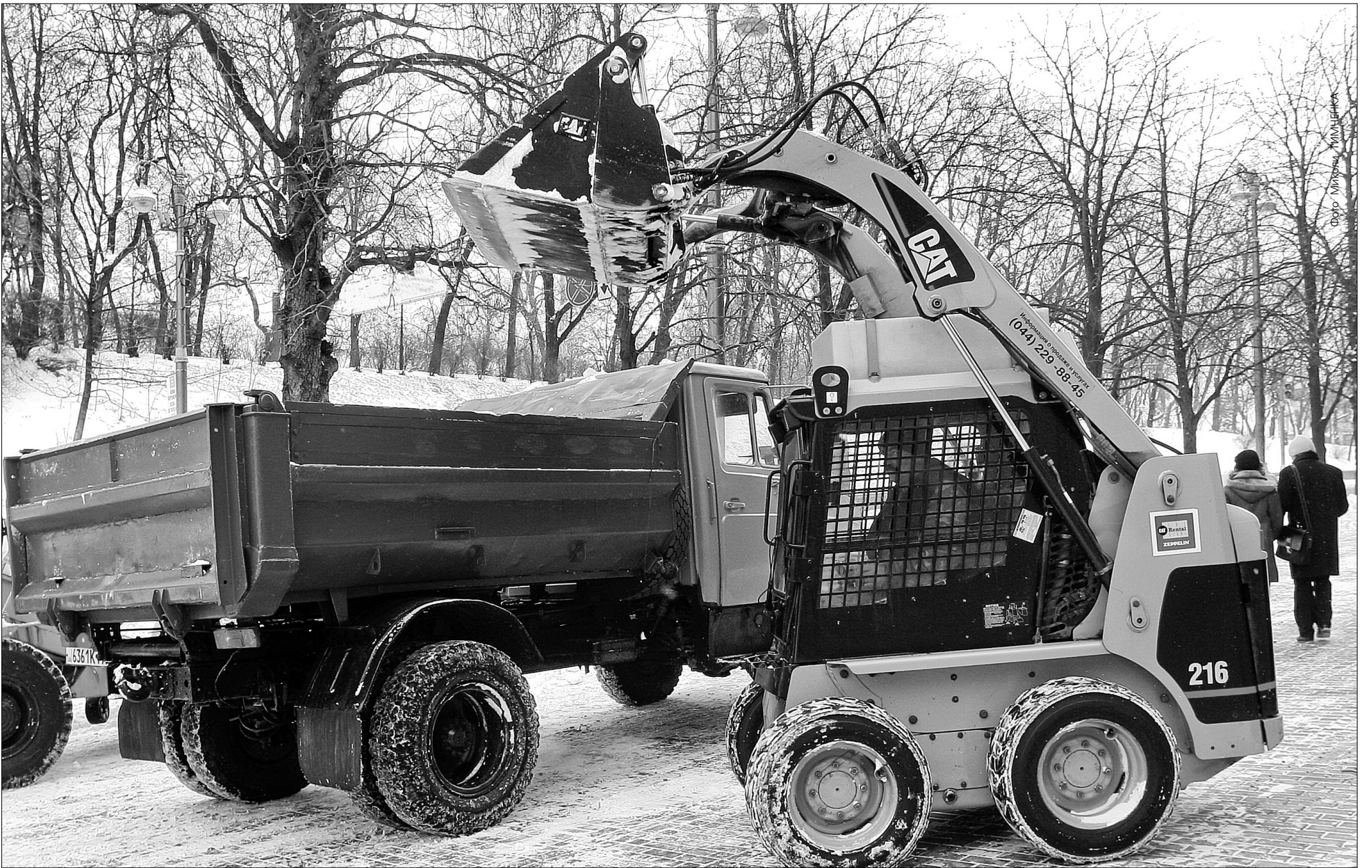
На засніжені вулиці столиці виїхали 250 одиниць снігоочисної та допоміжної техніки

Столичні комунальні служби склали перший зимовий іспит