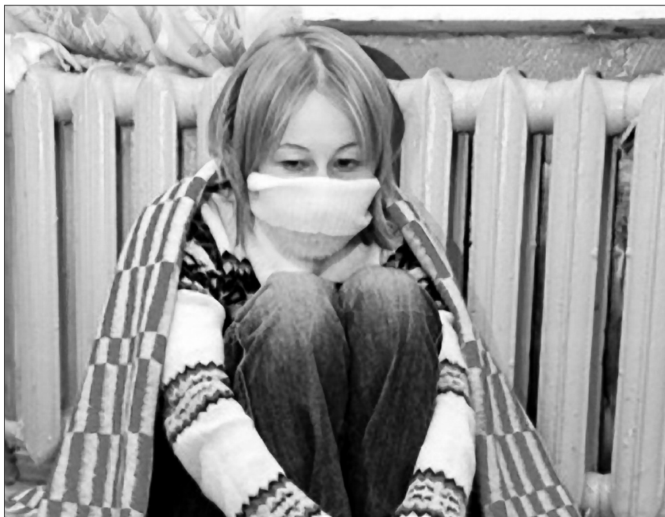
Чимало киян, які справно сплечують за послуги, потерпають від частого відключення тепла