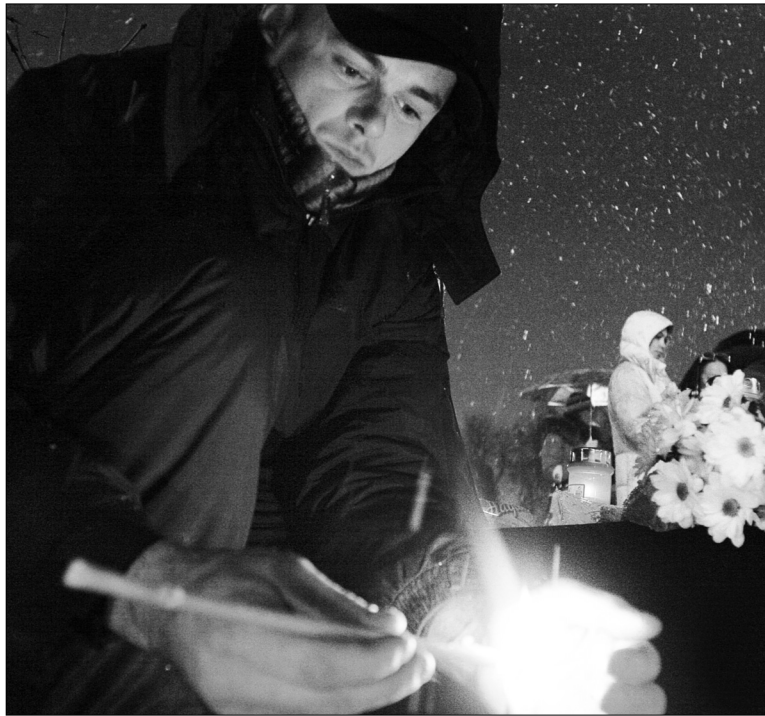
Сьогодні ввечері усі охочі запалюватимуть поблизу Палацу "Україна" свічки на знак солідарності з хворими на ВІЛ/СНІД

Сьогодні, третього грудня, в рамках відзначення Всесвітнього дня солідарності з ВІЛ-позитивними людьми та підтримки тих, які живуть із ВІЛ/СНІДом, у Києві відбудеться щорічна широкомасштабна акція "Свічкова хода". О 18.00 поблизу центрального входу до Палацу "Україна" всі охочі викладуть запалені свічки у формі "Червоної стрічки" — загально-визнаного символу взаєморозуміння та підтримки людей, які живуть із ВІЛ/СНІДом. Проте поки що зупинити цю інфекцію в Україні і Києві зокрема не вдається.