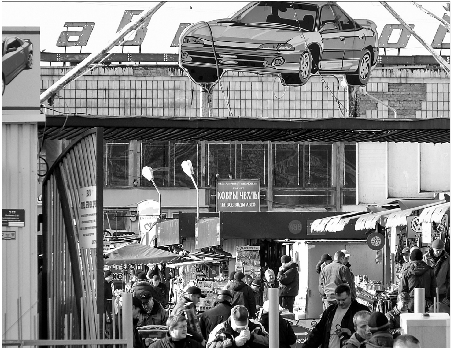
Найнижчі ціни, а з ними — і найбільша ймовірність купити контрафактний товар на ринку

Корейські автовиробники, зокрема Hyundai, вже не один рік вистежують виробників контрафактних товарів у Південній Європі. Із сюжетів, які регулярно транслюють по китайському телебаченню, видно, як у спільних рейдах із поліцією виявляють десятки підприємств із примітивного, кустарного виготовлення підробок. А також сотні складів і магазинів, де впереміш із оригінальними знаходяться і фальшиві запчастини. Цікаво, що в деяких торгових точках, що прикрашені логотипами всесвітньо відомих автомобільних компаній, продавці мають під прилавком тайники. Вони показують клієнтові оригінальну запчастину, а після оплати товару запаковують йому зі схованки фальшиву, демонструючи спритність рук, як під час гри в наперстки. При таких магазинчиках є два види складів. У відкритому зберігаються напоказ оригінальні деталі, в підпільно-му — фальшиві.