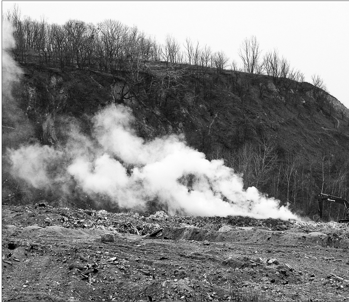
Більшість сміттєзвалищ столиці вичерпали свій ресурс