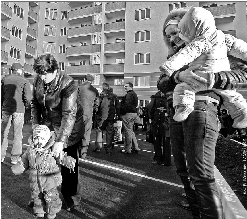
У майбутньому 1089 сімей отримають квартири за програмою доступного житла

Столиця продовжує розбудовуватися. На щастя, не лише за рахунок приватних забудовників, а й за кошти державного замовлення. Завдяки програмам доступного та соціального житла у нинішніх складних умовах отримати квартиру реально. Це підтвердить 721 сім'я, які цьогоріч придбали квартиру за програмою доступного житла. Від початку року за пільговими програмами збудовано п'ять будинків. Днями список доповнив шостий, що в Солом'янському районі на вулиці Васильченка, 3.