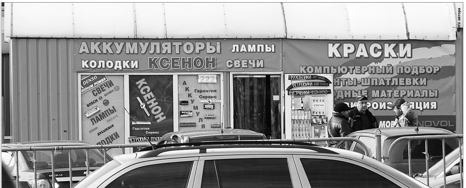
Кожен продавець вважає своїм обов’язком прикрасити торгову точку логотипами відомих виробників. Найчастіше — без їх офіційного дозволу