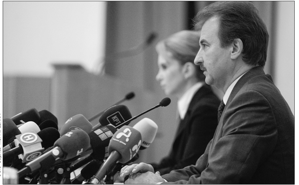
Голова КМДА Олександр Попов розповів журналістам про розвиток інфраструктури, залучення молоді до управління містом, удосконалення системи влади

Під час зустрічі з журналістами новопризначений голова КМДА Олександр Попов, подякувавши їм за увагу до міських проблем, зауважив: “Ми ставимо перед собою амбітні плани. Але для реалізації їх столиці потрібен план розвитку й генплан міста. Для цього ми проводимо активні консультації з фахівцями та науковими інститутами, плануємо залучити громадські організації, киян. Звернемося до іноземних експертів-практиків. Хочу наголосити, що ми реалізуватимемо ці плани з допомогою партнерів, не використовуючи бюджетних коштів”. Окремо зупинився Олександр Попов і на проблемі, пов'язаній з комунальними мережами. “Підприємства, які забезпечують життєдіяльність міста, повинні належати громаді,— заявив голова КМДА.— Тому столична влада вже тепер спрямовує зусилля на поновлення втраченого контролю. З активами “Київводоканалу” та “Київгазу” все зрозуміло. До кінця року плануємо поновити контроль над їхніми активами”. На сьогодні проведено консультації з міжнародними організаціями, котрі можуть надати підтримку в реалізації інвестиційної програми розвитку міських служб, зокрема й “Київводоканалу”. Олександр Попов додав, що її вартість на сьогодні визначено майже у 7,8 млрд грн. За його словами, значно складніша ситуація наразі з “Київенерго”, що вже не є у комунальній власності міста. “Процес від-