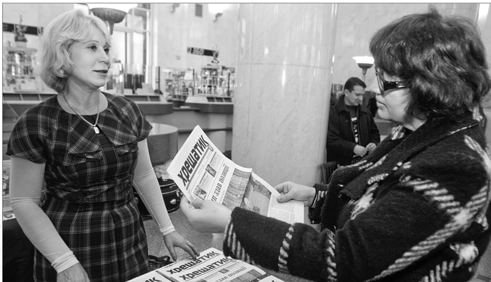
Муниципальный “Хрещатик” взяв активну участь у Дні передплатника

“Хрещатик” також не лишився осторонь і взяв участь у цій акції. Нагадаємо, кияни, які не зробили передплату на наступний рік, 9 грудня ще матимуть таку нагоду — в останній День передплатника. (10,00, центральна зала УДППЗ “Укрпошти”) ●