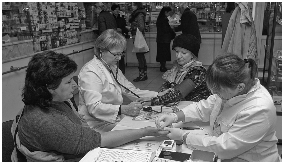
П'ять днів поспіль у 22 столичних аптеках протягом двох годин усі охочі безплатно могли проконсультуватися в лікаря-ендокринолога та визначити рівень глюкози в крові

День діабету відзначають 14 листопада в усіх країнах світу. Його започаткували Всесвітня організація охорони здоров'я і Міжнародна діабетична федерація. Уже кілька років поспіль кияни мають змогу взяти участь у добродійній акції, ініціатором якої виступає комунальне підприємство “Фармація”. Зокрема, цього року 15-19 листопада у 22 столичних аптеках щодня протягом двох годин кожен охочий має змогу безплатно проконсультуватись у лікаря-ендокринолога, визначити рівень глюкози у крові, виміряти артеріальний тиск, а також отримати інформаційно-освітню літературу з питань діабету. Протягом тижня по-