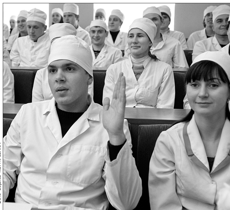
Майбутні лікарі матимуть змогу працювати в сімейній медицині, спираючись не лише на моральну, а й на практичну підтримку влади

Днями у столиці відкриють першу амбулаторію сімейних лікарів. Тож і кияни, і медики матимуть змогу перевірити ефективність нової системи на власному досвіді ●