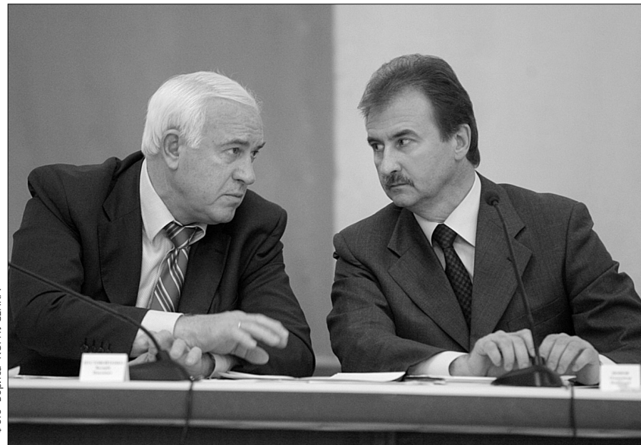
Голова КМДА Олександр Попов та радник Президента Валерій Пустовойтенко обговорюють перспективи оптимізації роботи управлінського апарату

Одним з найважливіших питань на сьогодні в Києві є дещо розбалансована система управління містом, вважає голова КМДА Олександр Попов. Також потребують уваги питання належної організації взаємодії між загальноміським і районним рівнями управління та ефективного використання бюджетних коштів. У перші ж дні на посаді голови КМДА Олександр Попов вдався до рішучих дій — обіцяна влітку ліквідація збиткових комунальних підприємств стане реальністю. 17 листопада на засіданні колегії КМДА було представлено проєкт їх реорганізації. За словами заступника голови КМДА Олександра Пузанова, потрібно скорочувати бюджетні витрати на утримання підприємств, що працюють неефективно або ж дублюють роботу, яку повинні виконувати міські чи районні управління. Зокрема, загальна сума збитків підприємств за 9 місяців нинішнього року сягає 300 млн грн, а прибуток становить лише 40 млн грн. Причому зі 183 комунальних підприємств