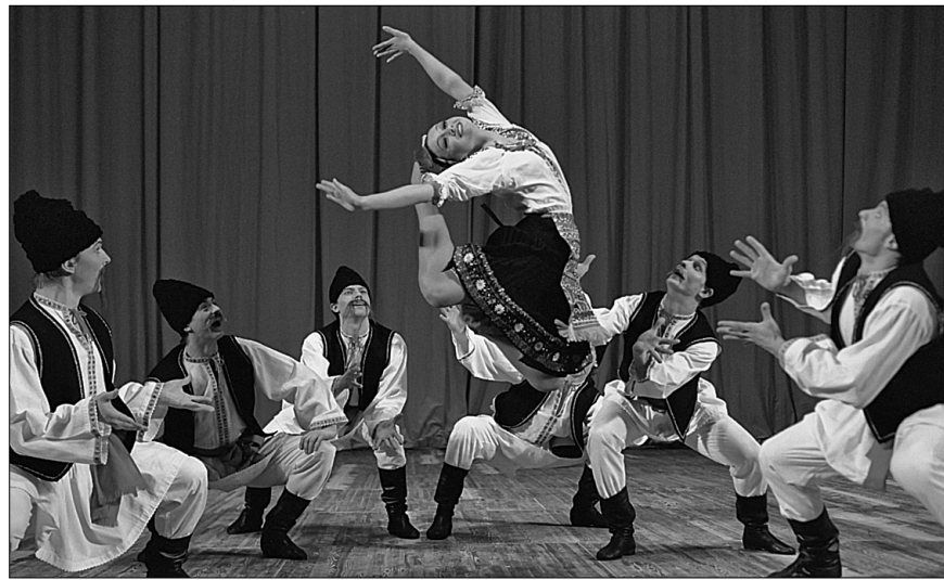
23 та 24 листопада у Національному палаці мистецтв "Україна" артисти Державного академічного ансамблю народного танцю імені Ігоря Моїсеєва презентують найкращі номери фольклорної хореографії

Нині в репертуарі ансамблю понад 300 оригінальних творів, які поставив Ігор Моїсеєв. У складі трупи танцюють 85 професійних танцівників, що здатні перевтілюватися в різні образи з народної культури, найчастіше це випускники школи народного танцю, яка діє при ансамблі. Видатний хореограф Ігор Моїсеєв пішов із життя в листопаді 2007 року на 102 році життя і залишив по собі унікальний ансамбль, яким керував 70 років. 105-річчю від дня народження свого засновника Державний академічний ансамбль народного танцю імені Ігоря Моїсеєва присвятив великий гастрольний тур. Для киян найкращі номери "Танці народів світу" колектив виконає 23 та 24 листопада на сцені Національного палацу мистецтв "Україна" ●