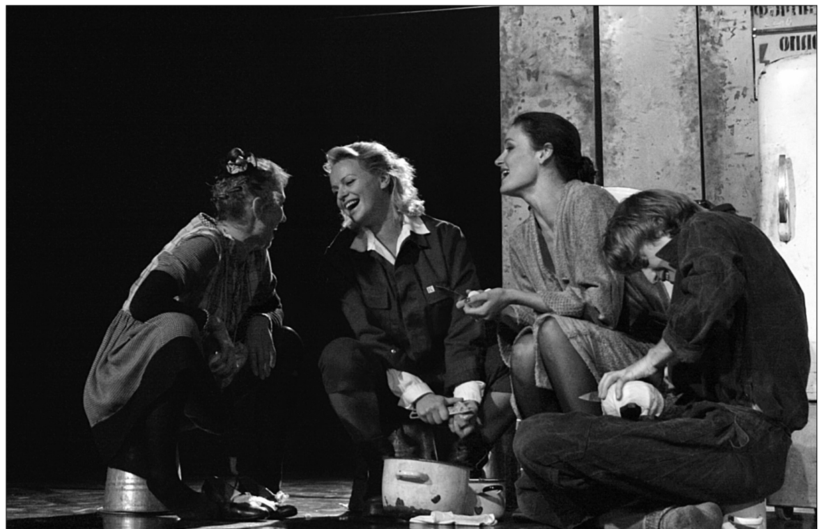
Скандальна "Четверта сестра" сучасного польського драматурга Януша Гловацького в перекладі Олександра Ірванця є пародією на чехівських "Трьох сестер"