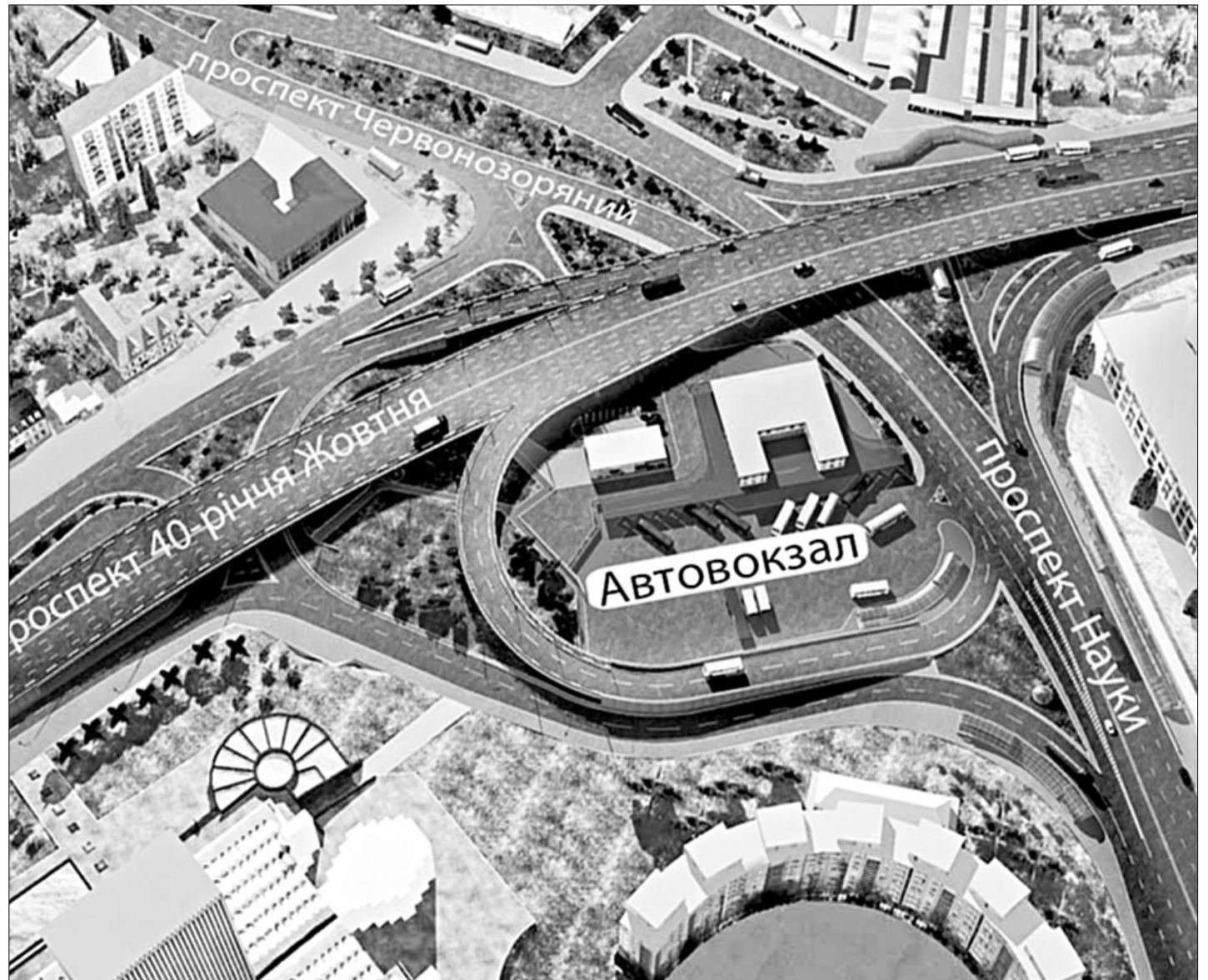
Ірина ЦЕРБАТА "Хрещатик"

Нею щогодини тепер можуть проїжджати на три тисячі більше машин, ніж раніше