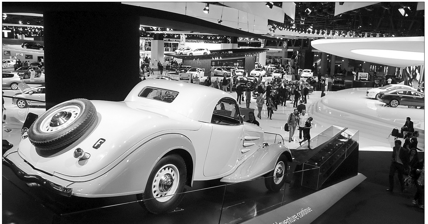
Паризький автосалон запропонував чимало новинок

Одразу на кількох подіумах дебютував у Парижі Hyundai ix20, який належить до класу MPV, а фактично є сумішшю хетчбека з мінівеном. На сьогодні це поки що остання модель у лінійці Hyundai, розроблена в Європі, і яка успадкувала концептуальні риси стилю fluidic sculpture — "текуча скульптура". 4,1-метровий автомобіль має незвично довгу для свого класу колісну базу 2,615 мм і високий дах — 1,600 мм. Завдяки таким розмірам у салоні ix20 простору не менше, ніж у більшості автомобілів більшого С-класу.