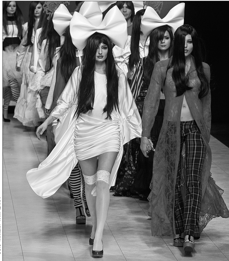
За шість днів на столичному подіумі продемонструють понад 40 колекцій дизайнерського вбрання на сезон весна-літо 2011

Сьогодні розпочинається 27-й Український Тижень Моді, що триватиме в Києві до 19 жовтня. Його учасники — вже відомі та молоді дизайнери — продемонструють свій погляд на те, як можуть вдягатися українські модниці наступної весни та влітку. Почесним гостем Ukrainian Fashion Week стане президент Національної Палати Моді Італії Маріо Бозеллі, що свідчить про увагу до української моди з боку Європи. А завершить модний тиждень показ колекції Haute Couture французького кутюр'є Стефана Роллана, який відбудеться 22 жовтня.