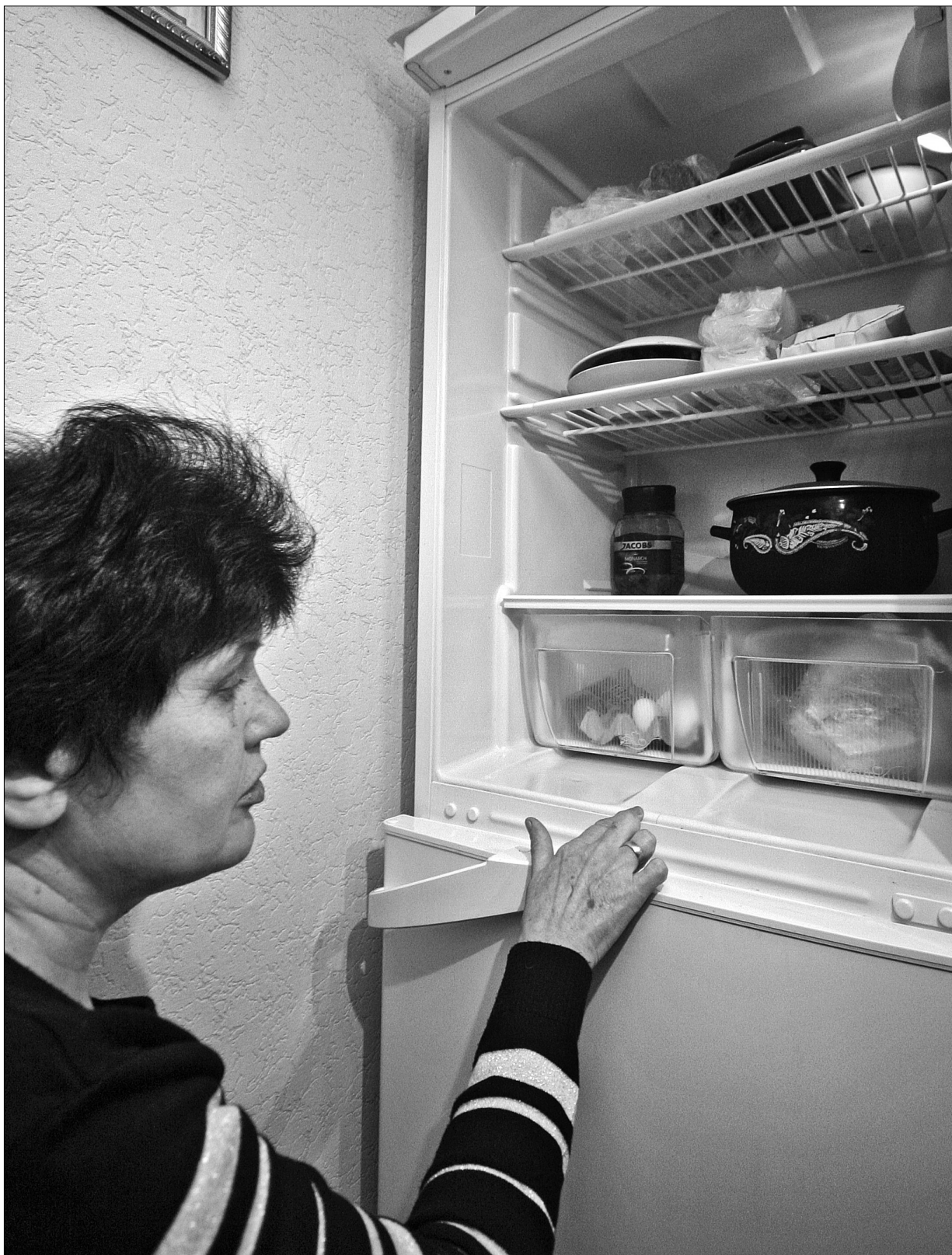
"Холодильник із тріщиною не підлягає ані ремонту, ані заміні", — кажуть у сервісному центрі

Через прогалини в українському законодавстві представництва фірм-виробників можуть відмовити у гарантійному ремонті