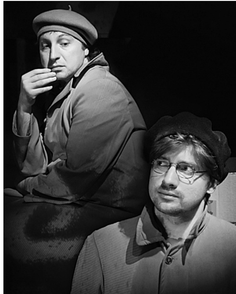
Гоголівська класика у виконанні акторів театру звучить дуже сучасно