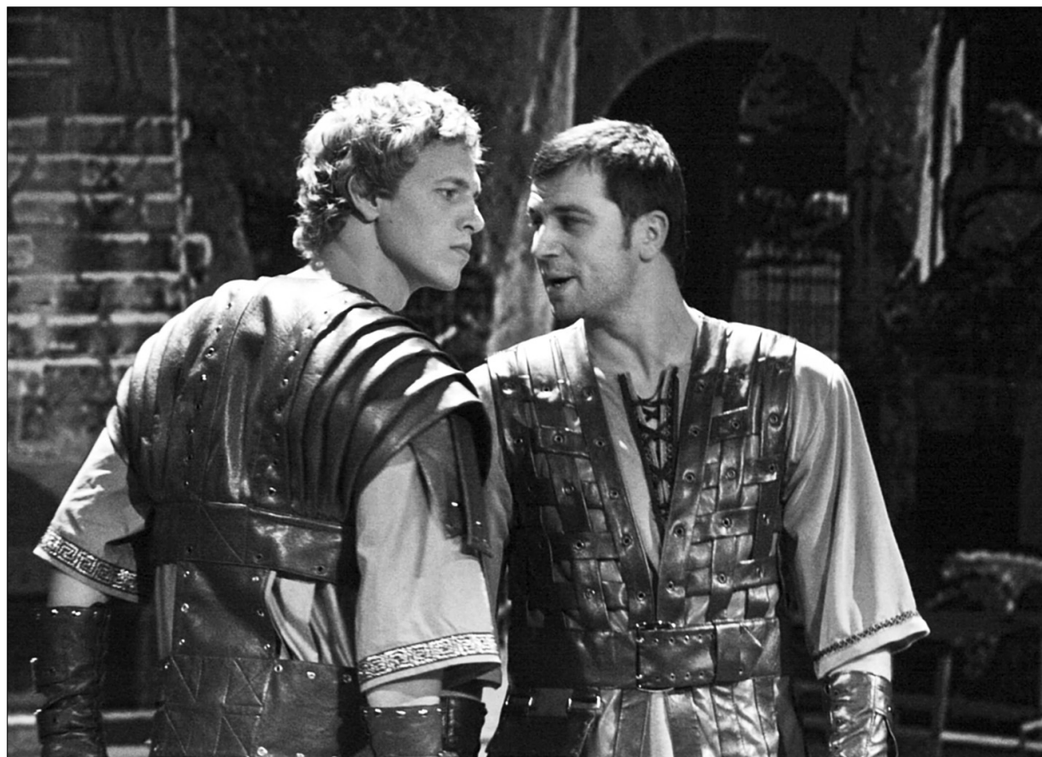
Дорослі глядачі дають позитивну оцінку акторській майстерності у спектаклі "Химера"

До слова, в суботу дають "Чарівну Пеппі" та "Ігри вночі". Якщо ще не маєте планів на вихідні, радимо подивитися. Адреса театру: вул. Липська, 15/17, тел.: 253-62-19, 253-54-83 ●