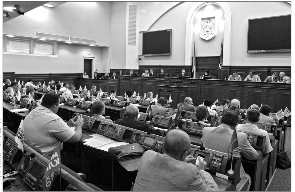
Депутати гуртом відстоюватимуть "земельні" рішення

Одним дають — у інших забирають. Сесія Київради розгляне питання передачі приміщень нинішніх райрад і РДА у власність територіальної громади Києва. Нагадаємо, з 1 листопада районні владні структури припинять своє існування. Аби їхнє майно до цього часу не встигли десь "прилаштувати", вже нині є сенс вилучити його у власність громади міста. До слова, позавчора відбулося перше засідання ліквідаційної комісії. Як зізнаються самі депутати, поки що в них не вималювалося чіткої картини, як здійснюватиметься управління містом зокрема і з окремих галузей, наприклад, ме-