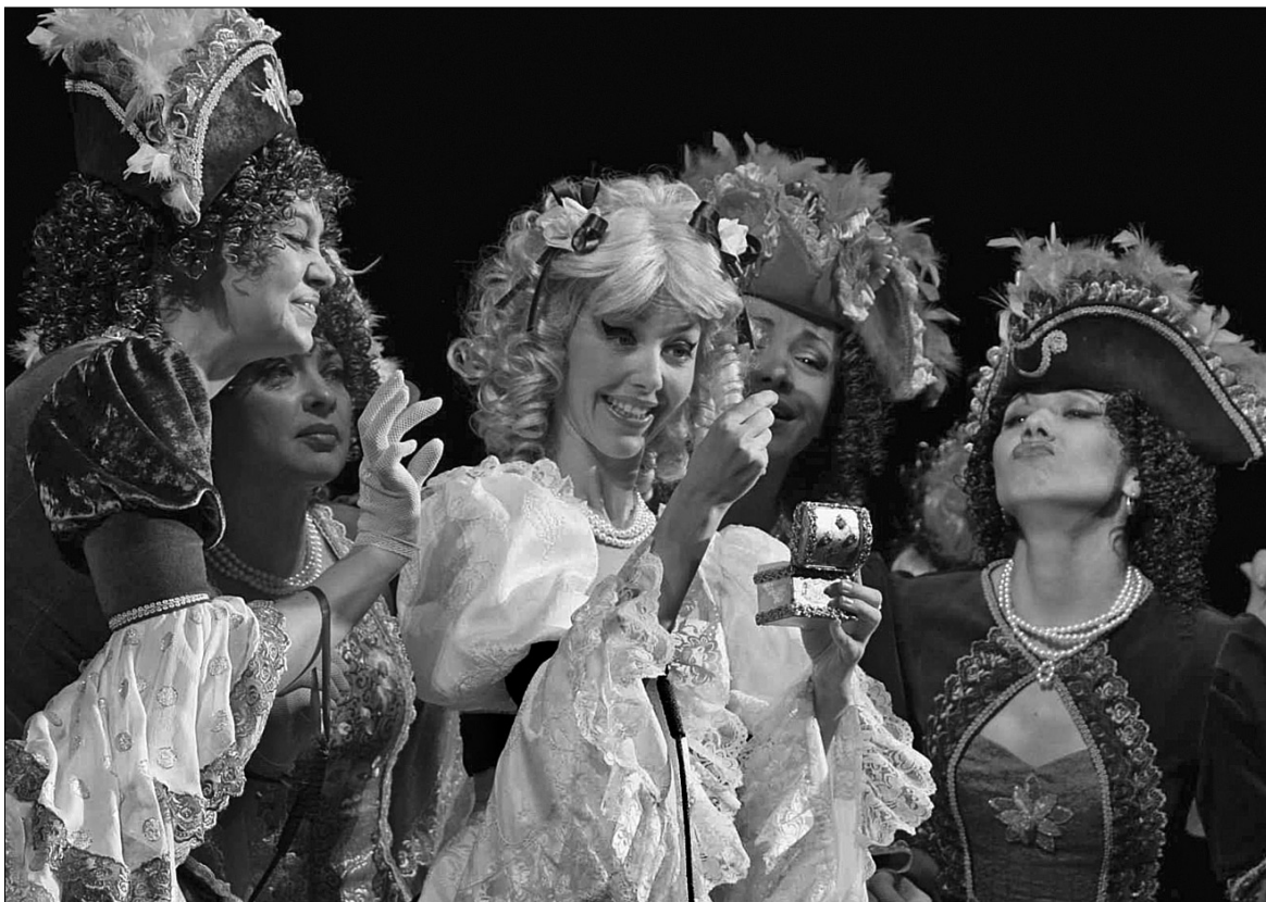
Сцена із спектаклю "Принц і принцеса"

Щоб мати успіх у молоді, треба говорити з нею однією мовою, і в мистецтві також