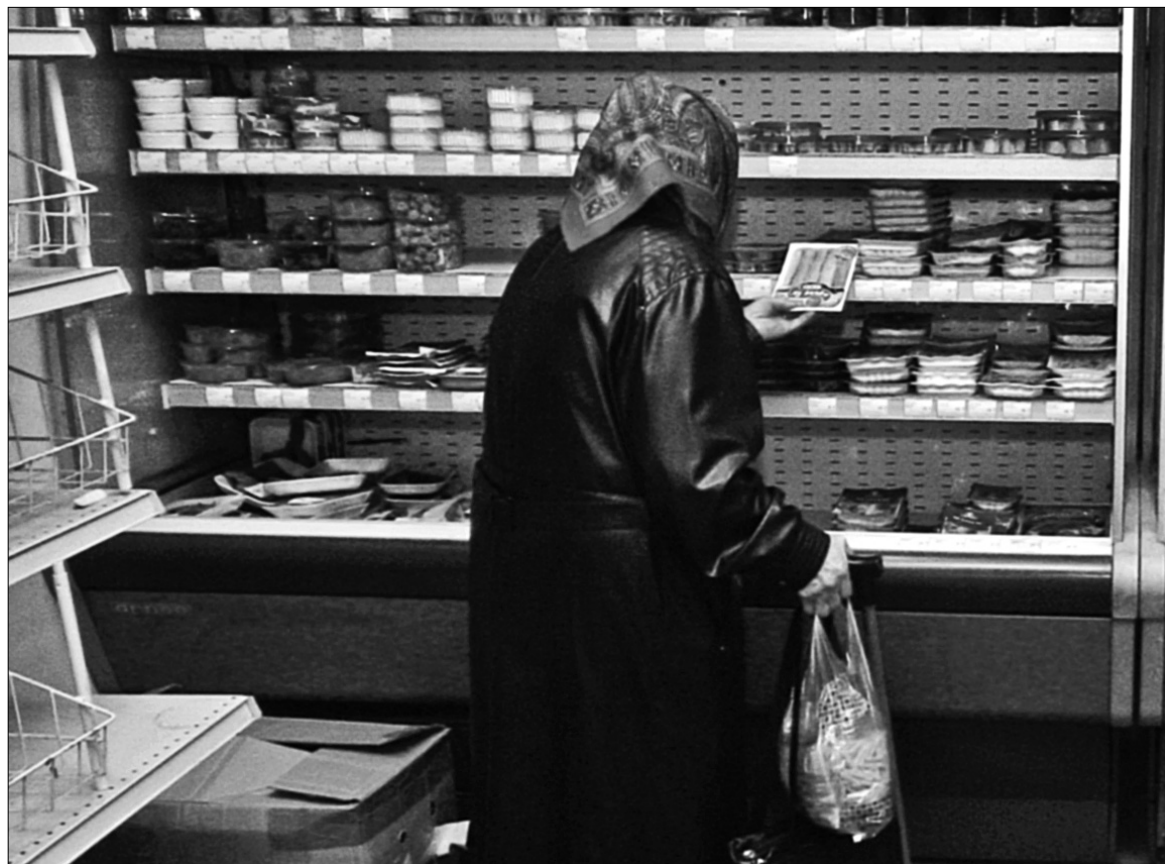
Пильніше придивляйтеся до зовнішнього вигляду товару: часто терміни придатності на упаковках не відповідають дійсності

Нашу увагу на продуктових полицях привертала не лише гранично допустимі терміни придатності, а й порушення температурних умов. Так, згушене молоко, яке рекомендують зберігати