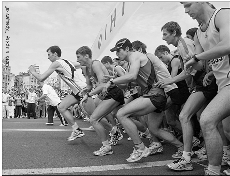
Привертати увагу до проблеми ВІЛ/СНІДу на Майдані будуть бігом

У суботу в столиці відбудеться благодійний марафон на підтримку ВІЛ-інфікованих