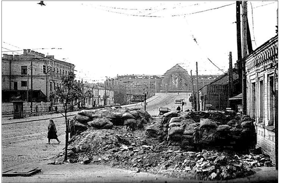
Барикади Києву у 1941 році не знадобилися

Оборона Києва розпочалася 11 липня 1941 року і тривала 72 дні — до 19 вересня. Трагедію київського котла називають однією з найбільших в історії Другої світової війни. Північний бік був завдовжки 190 км, південний — 390 км. За розмірами він дорівнював Західному фронту у Франції. Пастка, до якої потра-