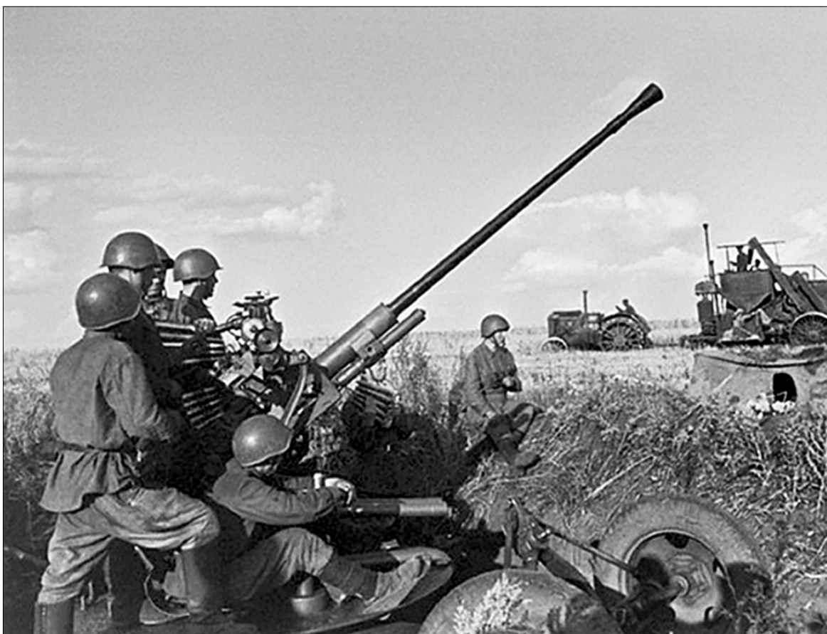
Першими киянами, що вступили в бій, були зенітники. Пропагандистське фото, зроблене на Київщині у 1941 році

Група військових істориків під керівництвом Григорія Кривошеєва називає цифру незворотних втрат радянських військ під час Київської оборонної операції 1941 року як 616,3 тисячі осіб. Довідник з історії наводить цифру — 1 мільйон.