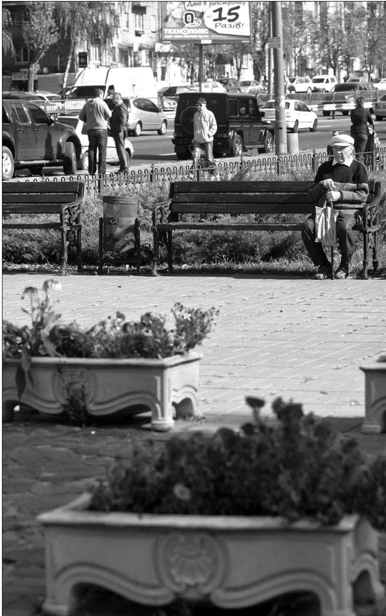
Барвисті квіти та зразковий благоустрій навпроти райадміністрації Святошинського району

Підсумки осіннього місячника з благоустроєм підбивають, імовірно, на основі контрольних об'їздів. Однак чиновників везуть 20-кілометровим маршрутом, уздовж якого ідеальна чистота, свіжопофарбовані огорожі та посаджені дерева. У темних закутках благоустрою зовсім не такий. Якщо з бездоріжжям упоратися кияни не в змозі, то з непотребом — під силу кожному. Найближча нагода поприбирати після себе випаде вже у вихідні під час масових суботників.