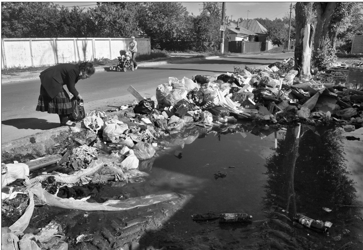
Зовсім інший вигляд має вулиця Клавдівська. Не кожен може обійти купи сміття та "водойми" на розбитій дорозі

В ідеалі кожен мешканець повинен дбати про чистоту ареалу свого існування. Це природно навіть для тварин. Але такий рівень свідомості властивий не кожному киянину. Скільки б не прибирали в парках, на завтра все одно валатимуться порожні пляшки, буде повно сміття. Про те, щоб хтось із мешканців спробував прибрати бодай у своєму дворі, мріяти поготів. Чиновники тим більше не поспішають дбати про те, щоб в місті було чисто. Завтра контрольні об'їзди в рамках осіннього місячника з благоустроєм комісія КМДА здійснить Дарницьким і Дніпровським районами. Під час попередніх об'їздів Святошинського та Солом'янського районів було зафіксовано фактично зразковий благоустрій. Усюди чисто, скрізь прибирали усміхнені комунальники, студенти і мешканці.