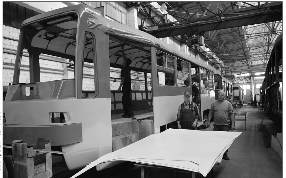
Модернізовані вагони готують до запуску на Київському заводі електротранспорту