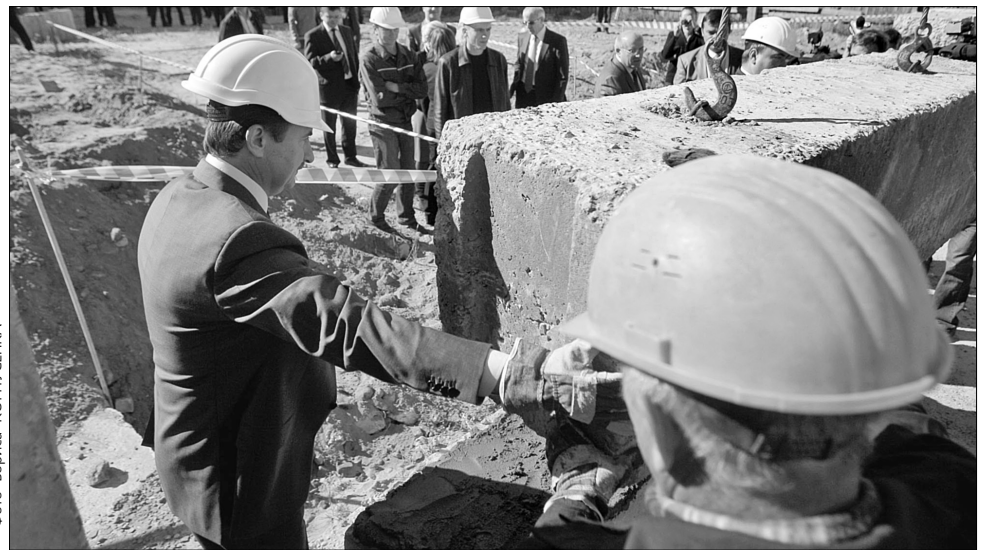
Перший заступник голови КМДА Олександр Попов разом із будівельниками встановив один з бетонних блоків майбутнього дитячого садочка

У вівторок у рамках робочого візиту в Деснянський район завітав перший заступник голови КМДА Олександр Попов. Він оглянув будівельний майданчик, де в майбутньому буде дитсадок. "На превеликий жаль, будівництво об'єктів соціальної ін-