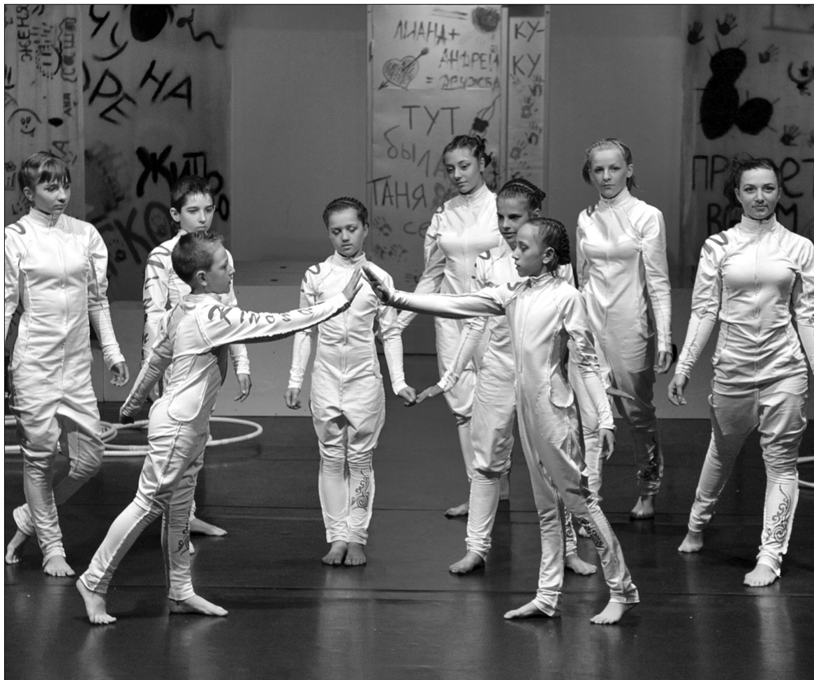
Вистава “Янголи серед нас” буде цікавою і дітям, і дорослим